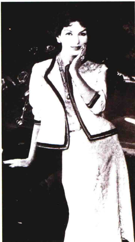
图1-6（右）夏奈尔1956年的春夏套装作品，堪称夏奈尔风格的经典：黑白招牌式配色，内层上装、外衣的缎子衬里以及翻出的白色袖口形成色彩呼应和节奏；款式简洁轻松，短上衣和长裙形成了优雅比例和外观。

图1-5（左）20世纪50年代，夏奈尔的粗花呢套装再次引领了时尚潮流。简洁明快、直线条的设计尤其受到美国女性的欢迎。该作品采用白色两件套装，无领，黑色镶边装饰，上衣沿袭其短上衣风格，裙摆仍保持中长长度。作品贯彻了夏奈尔的审美观，也使这个经典品牌始终散发着现代气息。