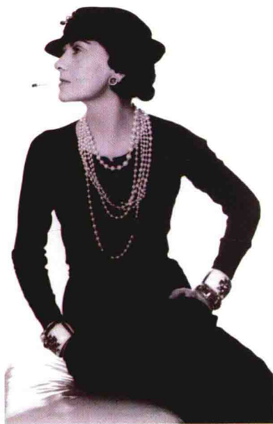
图 1-2 20 世纪 20 年代夏奈尔的小黑裙作品，其简洁、功能性的设计理念将妇女从束缚中解放出来，堪称服装史上里程碑式作品。没有繁杂的束缚人的累赘装饰，线形流畅自然，样式较贴身，有男性化的风格元素。多层白色珍珠项链提亮色调，使作品仍不失女性化的优雅。这款服装日后成为了夏奈尔品牌标志物之一。富有个性的黑色是夏奈尔一生的钟爱。

把时装设计以男性为中心的立场改变为以女性的舒适和美观为中心的立场，从而使时装设计能够更好地为使用者服务，使女性表现出自信和自强，不再成为男性的附庸。这是革命化的设计。