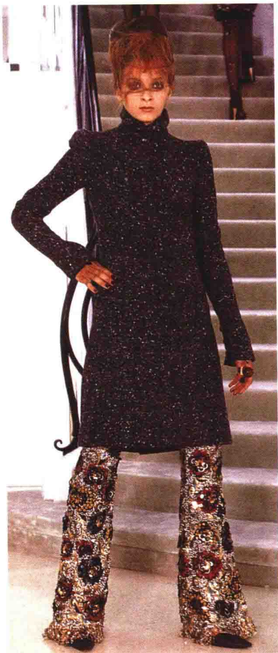
图 1-11 2002 年秋冬拉格菲尔德设计的夏奈尔作品。作品造型简洁、合体，长长的外衣有清教徒般的庄重，但又不失奢华。上衣灰黑色中有活跃的点纹，而裤装上装饰着华丽的巴洛克式纹样，使作品内敛中有着难掩的奢华。

拉格菲尔德对风格的理解不是机械的，他抓住的是夏奈尔精神。他坚持高端设计线路，在把握夏奈尔品牌的原则与精神基础上进行大胆地改革，使夏奈尔的经典和当代精神完美地结合起来。拉格菲尔德凭其对时代精神的诠释及对潮流触觉的敏感，将风行 60 年的夏奈尔风格注入新的元素，大胆引入街头元素，表现街头的狂野。夏奈尔品牌的拉格菲尔德版本色调较为艳丽，剪裁更加高雅素媚，具有融典雅与幻想为一体的特征（图 1-7~ 图 1-9）。拉格菲尔德抓住 20 世纪 80 年代复古浪漫风悄悄盛起的契机，使夏奈尔变得更年轻和现代。他在合体的裙子上配上皮带，还设计出航海家风格的运动装，加上镀金链子，粗犷中又见浪漫和温馨。可可·夏奈尔认为女性要端庄、