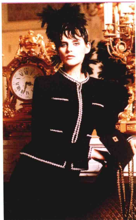
图 1-10 1996 年拉格菲尔德设计的夏奈尔作品。夏奈尔的黑色短上衣和简练的风格进一步得到发展和升华。作品为两件式套装，色彩以黑色为主，以白色作饰边。黑色软呢面料色泽高雅，精良的剪裁、合体的造型和对称的装饰显得经典高贵。由金属质地的闪光饰品组成的镶边极具现代感。

故居特有的装饰特点——法国的室内装饰风格，以寻找夏奈尔的设计精髓。洛可可纹饰和日本屏风的浓郁东方风韵成为他的创作灵感，之后他推出的饰以刺绣的夏奈尔女装显得更加精美绝伦、端庄、典雅。