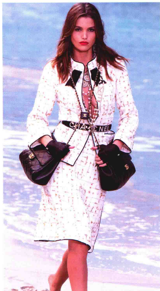
图 1-25 (右下) 2019 年春夏拉格菲尔德设计的夏奈尔品牌成衣作品。作品围绕夏奈尔引以为傲的粗花呢套装展开, 米色、白色等色彩让端庄淑女的套装更显少女气。此外, 链条、夏奈尔徽标等元素一应俱全, 并且在配件和包袋设计上增添了更多中性化元素, 使少女气之余不乏英气。

图 1-24 (右上) 2015 年春夏夏奈尔品牌高级时装作品。拉格菲尔德本次将秀场选在了迪拜的一座小岛上, 给大家带来了巨大的惊喜。“2015 早春度假系列”延续了以往的经典与优雅, 并应景地将充满中东风情的阿拉伯长袍、新月图案头饰以及繁复的珠宝配饰等完美地融入其中, 充盈着异域风情。