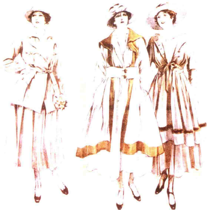
图1-1 1916年夏奈尔把宽松、舒适而廉价的渔民服引入时装设计,用针织面料设计富有弹性、穿着舒适的夹克、外套和裙子,这些服装穿着自由,款式简洁,裙长首次露出脚踝,便于行走,吸引了大量富有阶层女顾客。这种简洁利落取代奢华的一个原因是作品创作于战争期间,妇女参与社会所需。从夹克衫中还能看到军装的影子。

对现代主义的探索,法国著名女设计师可可·夏奈尔首先身体力行。夏奈尔生于1883年,出身贫寒,她的成功归功于坚强的性格、天生的丽质、自身的魅力和掌握自己命运的强烈愿望。1913年夏奈尔创立自己的品牌,从帽子起家,不久推出女装。当时上流社会妇女穿着的爱德华风格时装,利用各种褶皱、装饰突显女性的胸部和臀部,服装及服饰品繁琐不堪,不便于妇女的社会活动。于是夏奈尔决心改变它。她不断发布适应新时代女性的服装款式,去除束缚身体的缀饰,造型简洁自然,将女性的典雅蕴藏于简朴之中,在服装作品中运用男装化造型,突破传统女装风格(图1-1、图1-2)。夏奈尔被公认为现代时装最重要的奠基人物之一,她的重大贡献不仅仅在于她设计了一些具有国际影响的时装,而是改变了时装设计的规则,