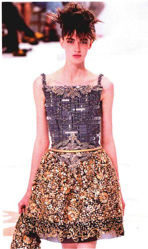
图 1-24 (右上) 2015 年春夏夏奈尔品牌高级时装作品。拉格菲尔德本次将秀场选在了迪拜的一座小岛上, 给大家带来了巨大的惊喜。“2015 早春度假系列”延续了以往的经典与优雅, 并应景地将充满中东风情的阿拉伯长袍、新月图案头饰以及繁复的珠宝配饰等完美地融入其中, 充盈着异域风情。

图 1-23 (左上) 2015 年秋冬夏奈尔品牌高级时装作品。拉格菲尔德从 20 世纪最重要的建筑大师勒·柯布西耶 (Le Corbusier) 的设计作品中吸取灵感, 用自己独特的手法再一次创新突破表达了 Le Corbusier 式的超现实主义极简风格。他将氯丁橡胶用作面料, 与亮片、珍珠、水晶、刺绣融合在一起, 呈现的效果让人大开眼界。