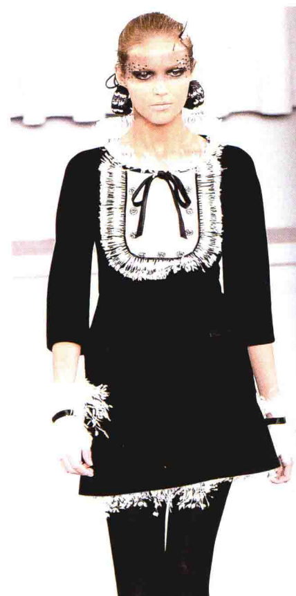
图 1-18 (右下) 2007 春夏拉格菲尔德设计的夏奈尔作品。该连裙装以黑色为主配搭白色, 色调优雅, 造型简练、合体, 裙长较短, 六分袖, 给人年轻、随意、雅致的感觉。田园风情的领子边沿、裙摆及手腕部, 都有纯白色碎羽状的装饰, 与黑色相互映衬, 显得细碎、迷人。黑白花的眼罩增添了神秘、迷人的感觉。

图 1-17 (右上) 2006 年秋冬拉格菲尔德设计的夏奈尔高级时装作品。深蓝色的连衣裙式礼服, 色彩纯正, 色泽高雅含蓄, 配以模特白皙的皮肤、金黄色头发、深邃的眼影, 还有精美的橙红色调的服饰品, 较好地烘托了贵族风格。裙腰节处的大褶皱设计具有装饰感, 避免了过于简约。此外, 作品的一大特点就是打破常规, 以非主流的牛仔面料做成礼服式长袖套等部件作配搭, 混合了优雅和街头元素。