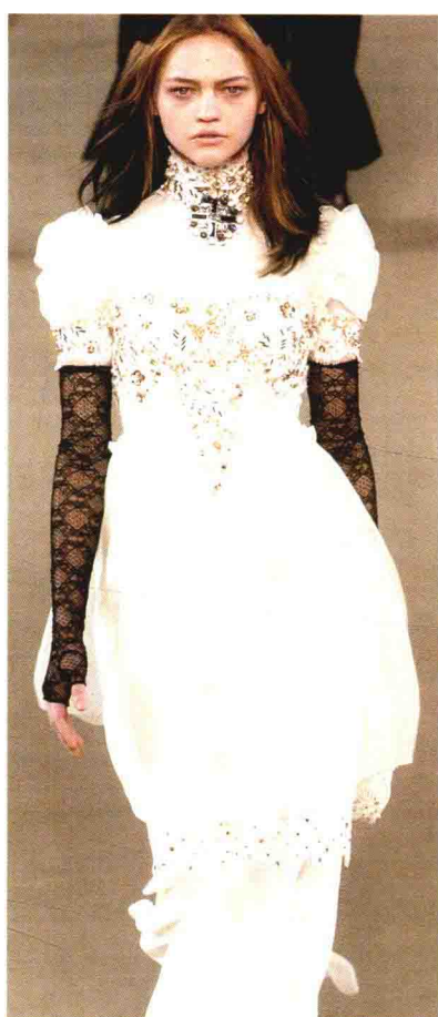
图 1-12（左） 2003 年春夏拉格菲尔德设计的夏奈尔作品。色彩柔和的薄纱塑造出或薄透垂坠、或重叠蓬松的外观，低腰的婀娜、褶皱的柔情尽显女性化特质。多圈珍珠项链和同色的蝴蝶般的缀结为作品增色不少。

图 1-13（中） 2004 年秋冬拉格菲尔德设计的夏奈尔作品。模特头戴贝雷帽，脚穿皮靴，十足的 Bicker 族形象。该作品撷取了 Coco Chanel 特色，将男装融入女装的中性风格，融合了 20 世纪 20 年代和 30 年代的