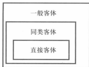
图 3-1 三类客体的相互关系