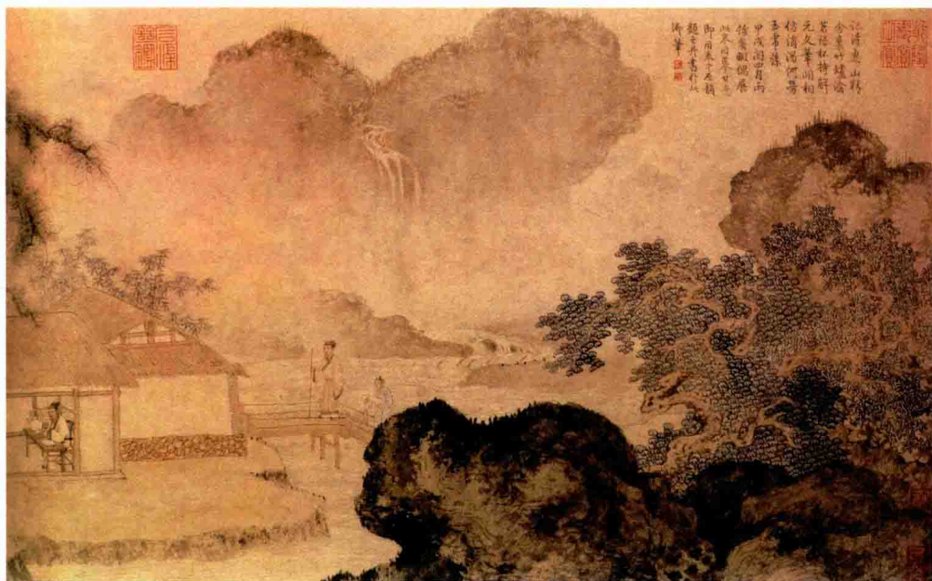
《事茗图》名画中的饮茶场景 明代 唐寅