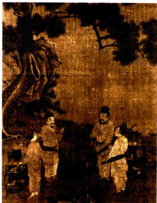
《斗茶图》中的饮茶场景 元代 赵孟頫

叶的新陈代谢类型比其他品种茶树的简单，因而更能断定，云南茶树是现在所有茶树中最为古老的原始类型。综合上述事实，我们认为茶树原产自中国西南部，云南则是茶树原产地的中心地带。