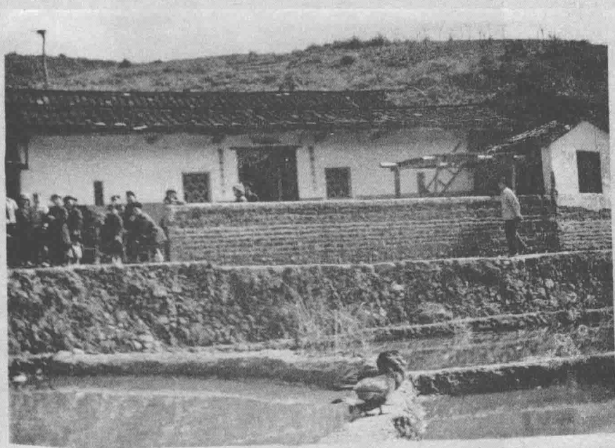
刘忠才溪故居旧貌。