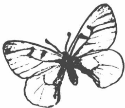
圣彼得堡地区 纳博科夫家的草图