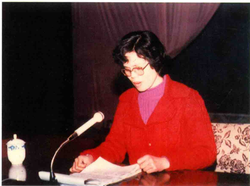
1988年，在桂林市委礼堂，第一次在全国性会议上介绍教改经验。