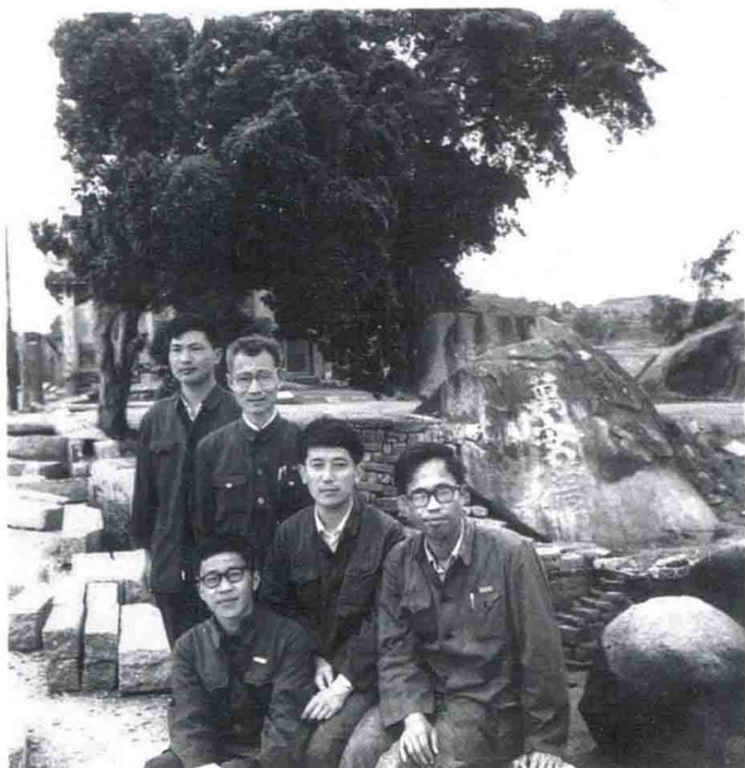
图9 1979年5月，与杭州大学历史系研究生在泉州洛阳桥合影（站立者左2为作者）