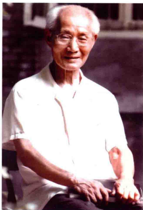
图 18 2006 年 6 月