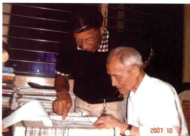
图 21 2007 年 10 月，在乐清老家查阅史料