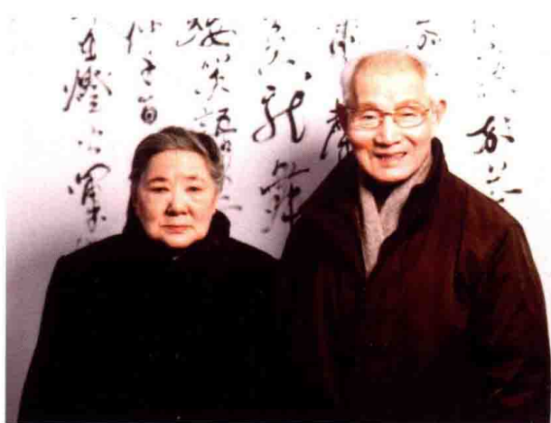
图 17 2004 年 2 月，与夫人钱伊怀