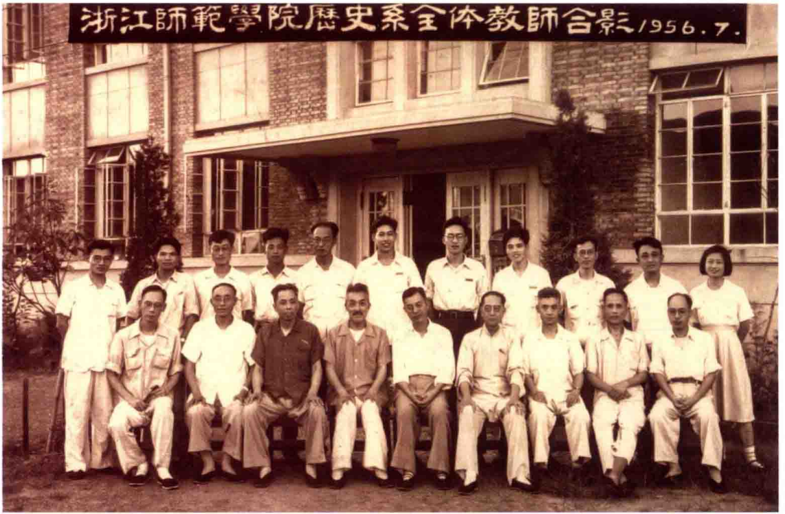
图4 1956年7月，浙江师范学院历史系全体教师合影（左1为作者）