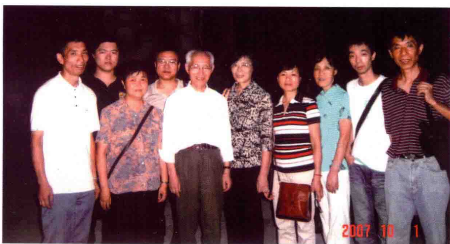
图 20 2007 年 10 月，率子女回乐清老家