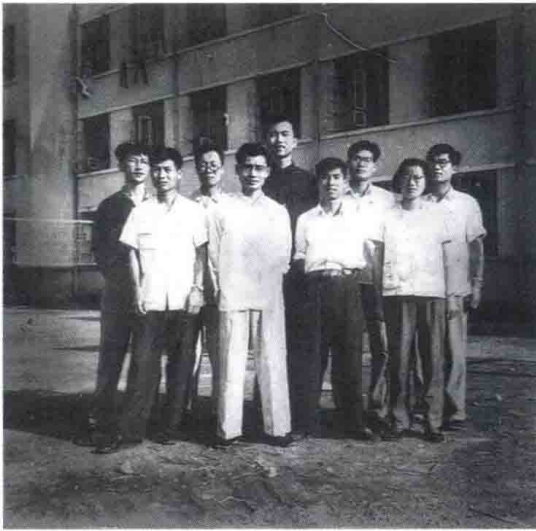
图5 1961年，杭州师范学院历史系中国史教研室全体教师合影（前排左2为作者）