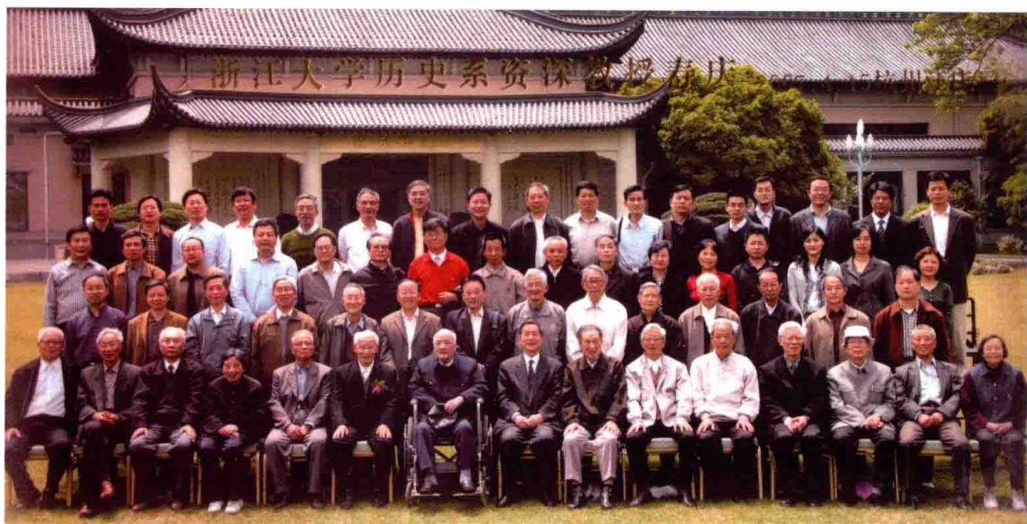
图 19 2007 年 4 月，浙江大学历史系资深教授寿庆合影（前排左 6 为作者）