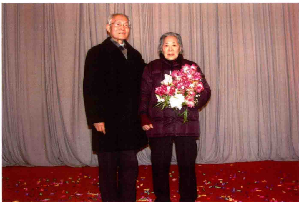
图 22 2009 年 2 月，结婚 70 周年，与夫人钱伊怀