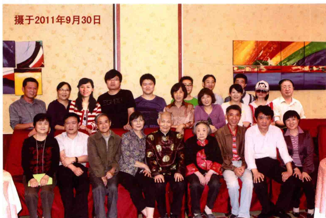
图 23 2011 年 9 月，93 岁寿诞留念