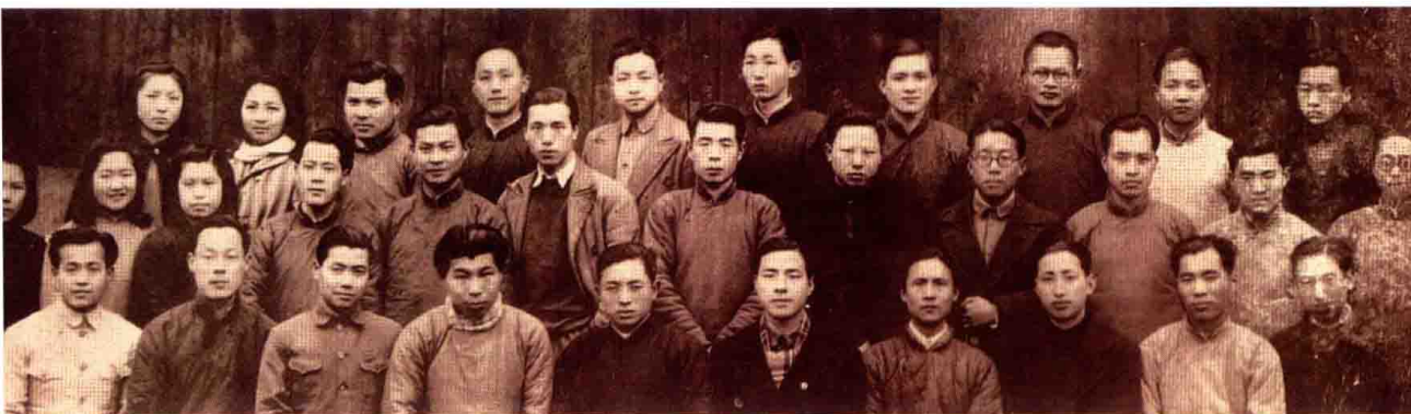
图3 1944年4月，遵义浙江大学史地系同学合影（第2排右2为作者）