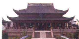
南京夫子庙大成殿