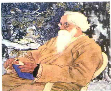
徐悲鸿中国作品选