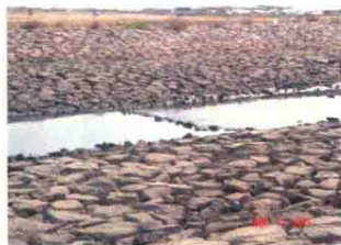
玫瑰花园地段填海后的海景(2)