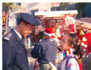
生命之源小组在海上世界采访