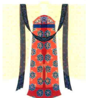
大袖对襟纱罗衫、长裙、披帛