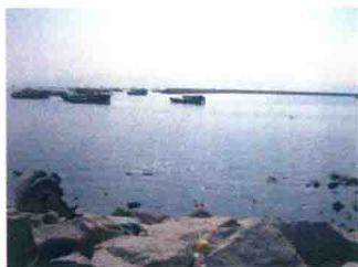
玫瑰花园地段填海后的海景(1)