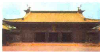
日本东京圣堂大成殿