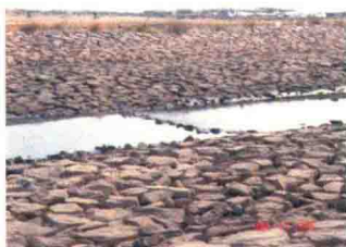
玫瑰花园地段填海后的海景(3)