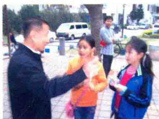
食水小组正在采访小区居民用水情况