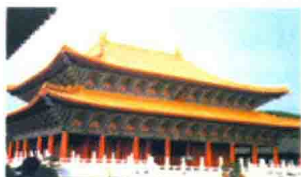
台湾高雄市孔庙大成殿