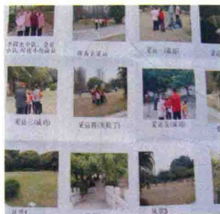
金星小组成员开展有关深圳绿化情况的社会调查