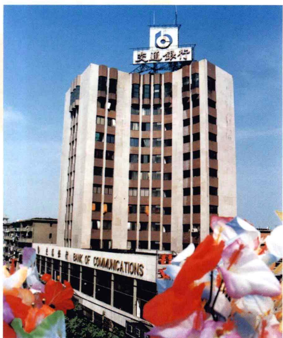
交通银行南昌支行办公大楼