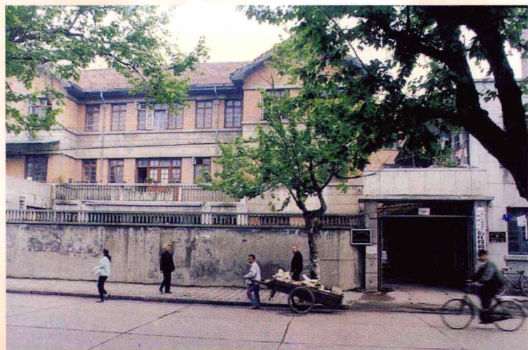
中国人民建设银行江西省分行旧楼