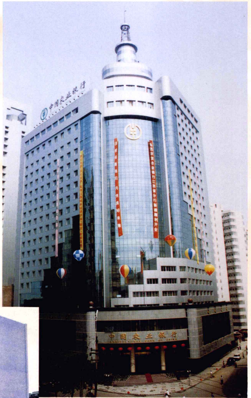
中国农业银行江西省分行办公大楼