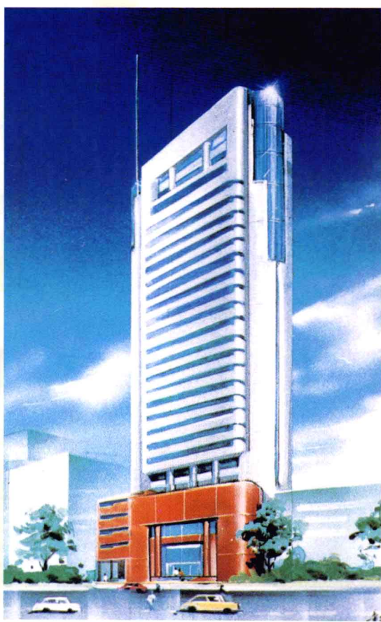
江西省国际信托投资公司办公大楼