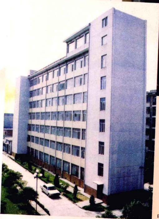
中国农业银行江西省分行旧楼