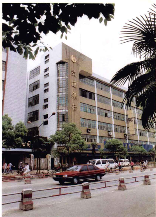
交通银行景德镇支行办公大楼