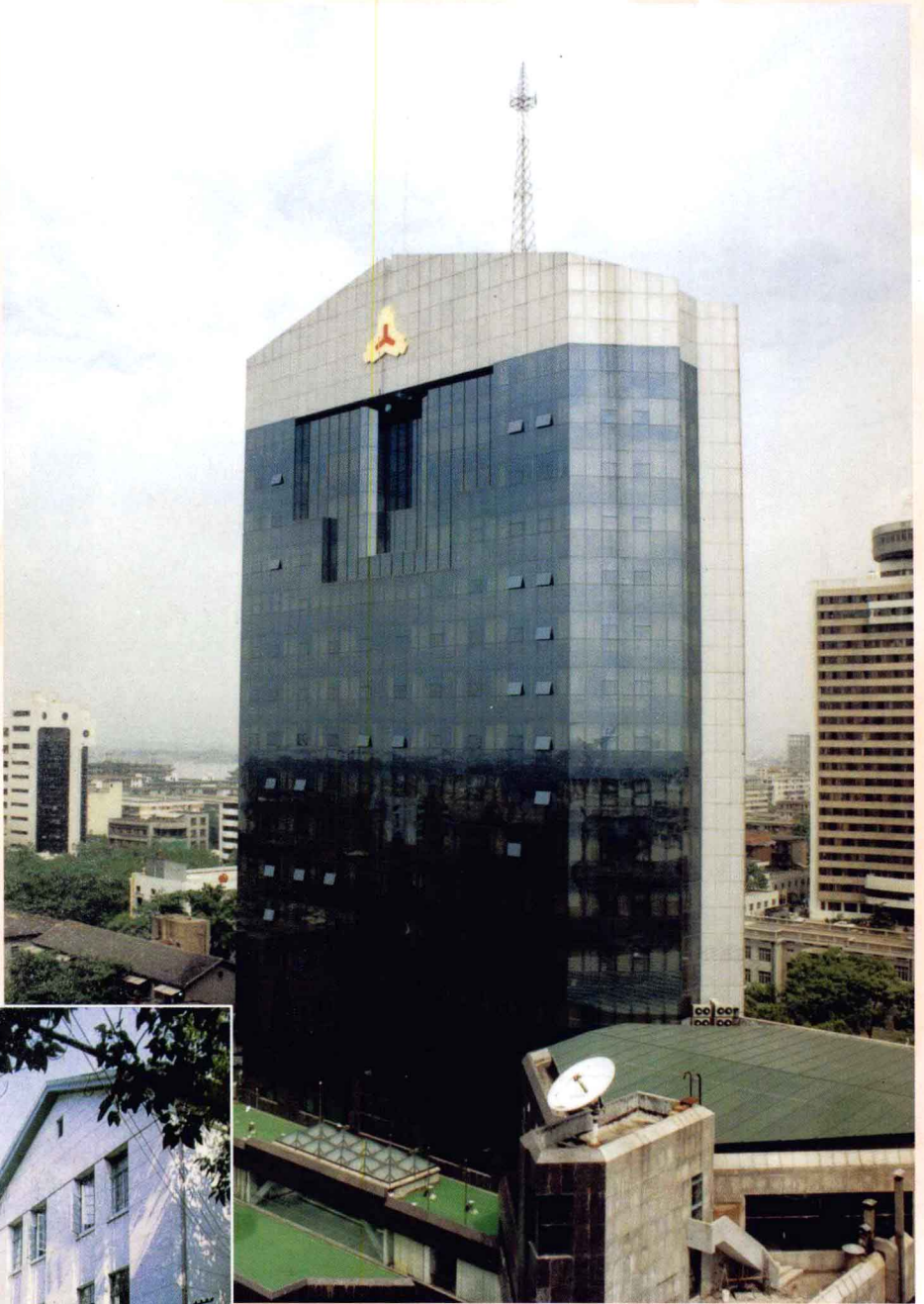
中国人民银行江西省分行办公大楼