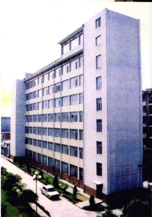
中国农业银行江西省分行旧楼