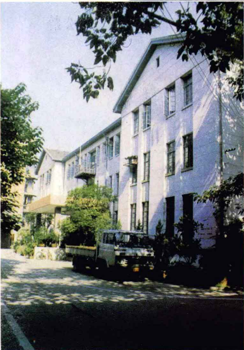
中国人民银行江西省分行旧楼