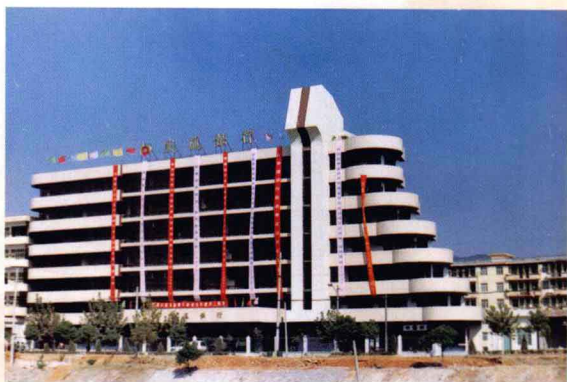
交通银行新余支行办公大楼