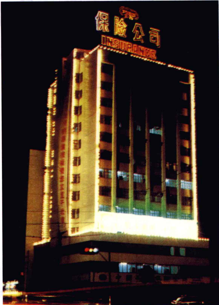
中国人民保险公司江西省分公司办公大楼