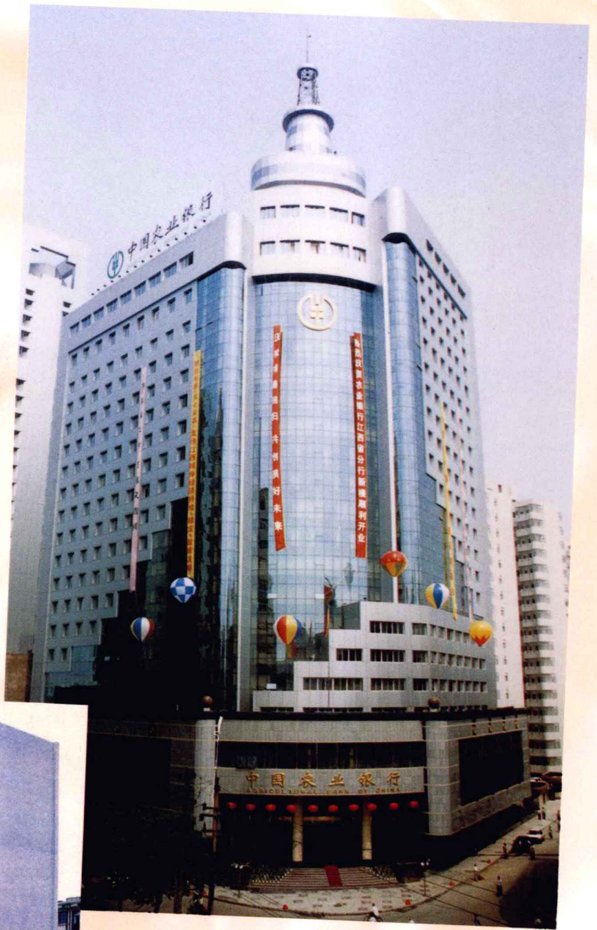
中国农业银行江西省分行办公大楼