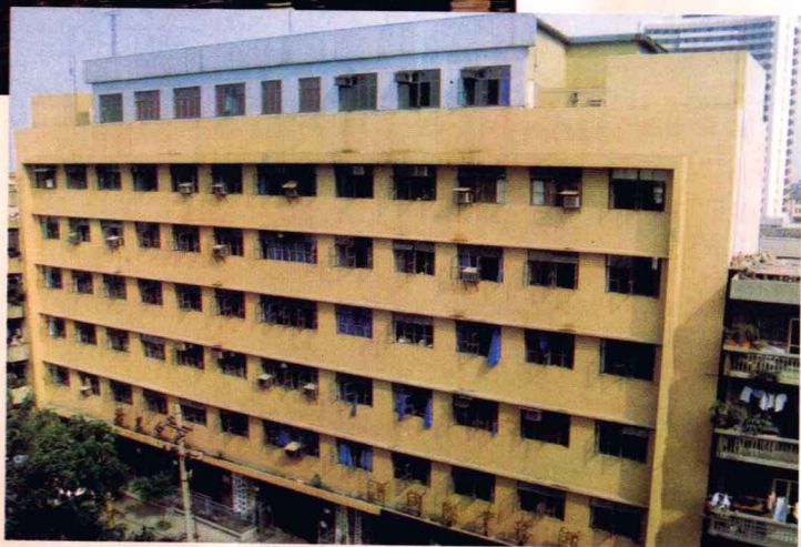
中国工商银行江西省分行旧楼