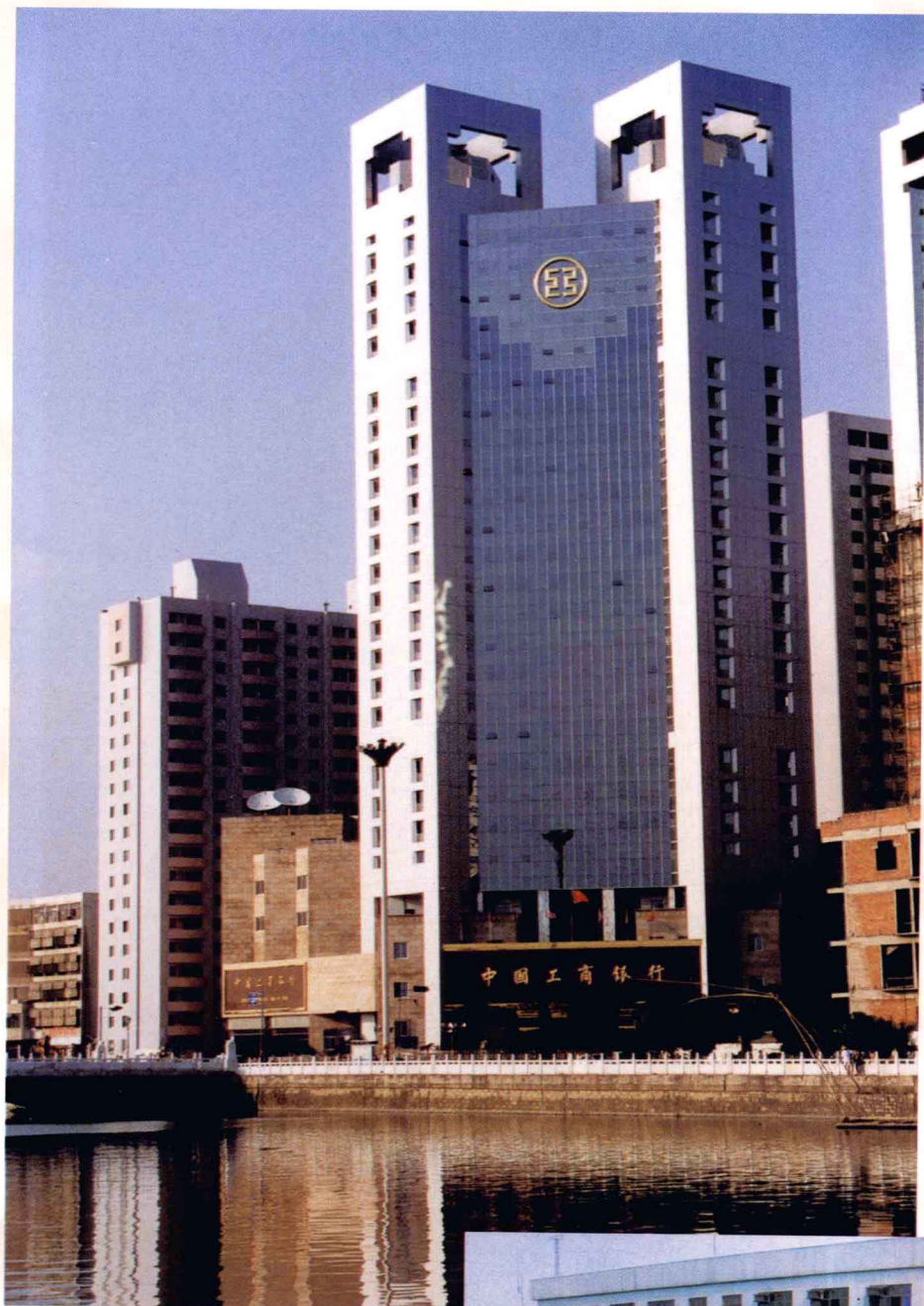
中国工商银行江西省分行办公大楼