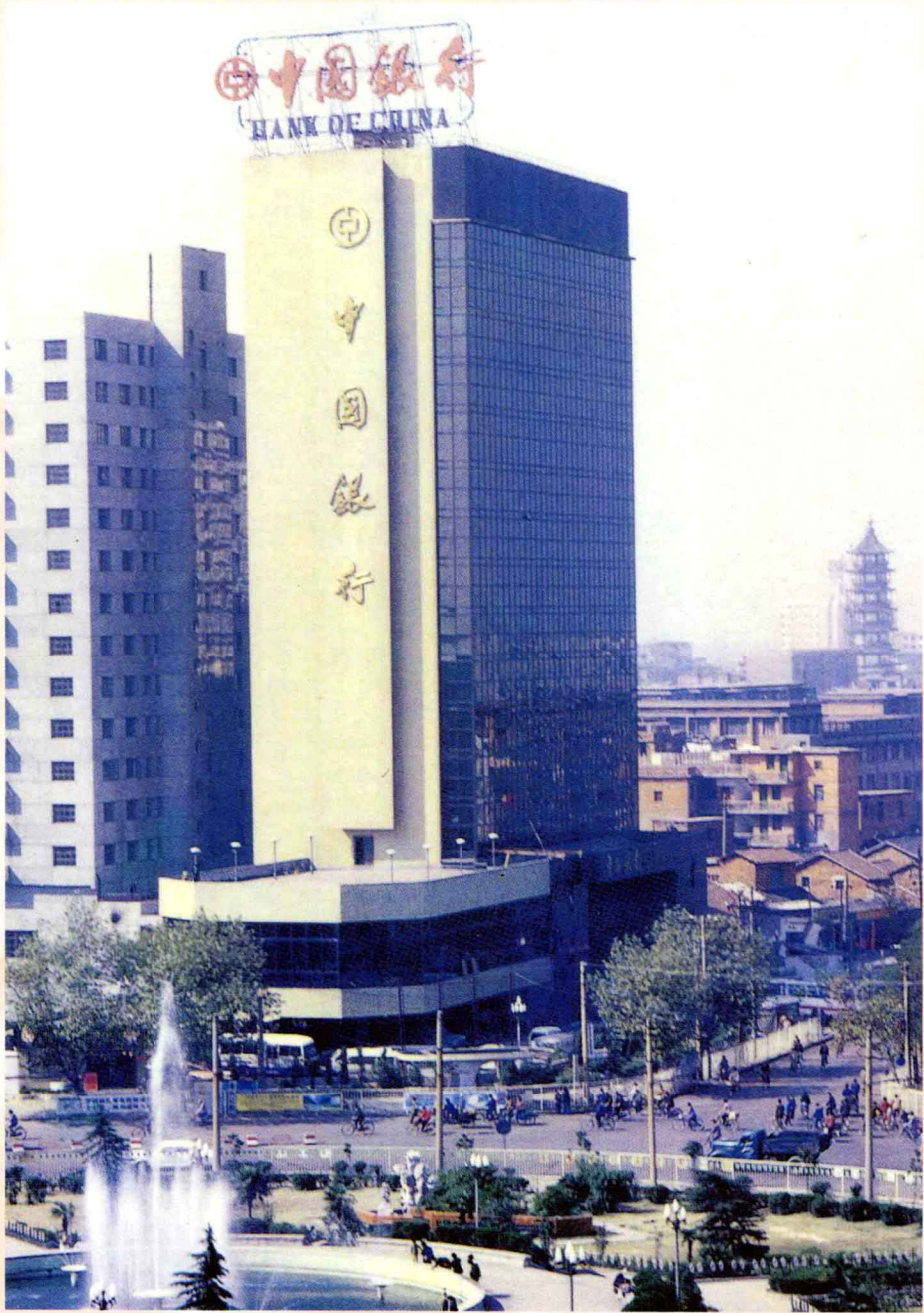
中国银行南昌分行办公大楼