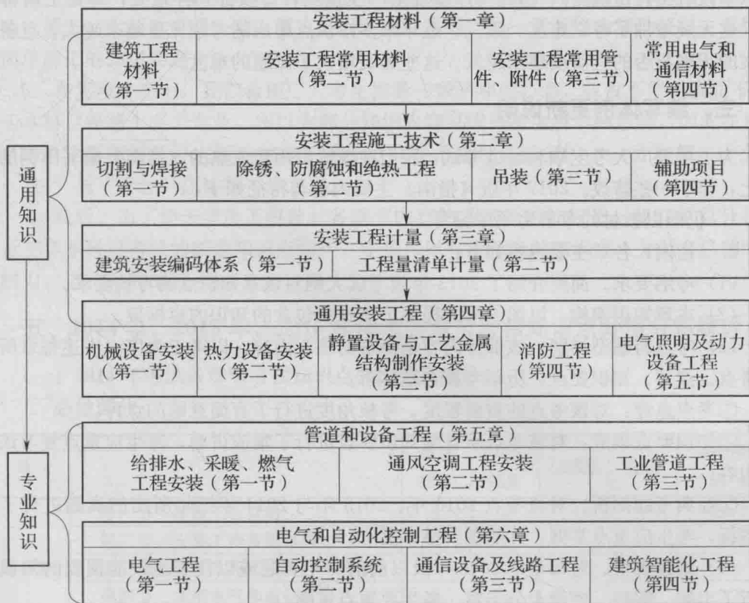
安装工程知识脉络体系图

2017年全国造价工程师执业资格考试——建设工程技术与计量（安装工程部分）所使用的教材为2017年版新编教材。2017年版教材同上一版（2013年版）教材相比，修改幅度不大，仍沿用了以往的整体格局以及绝大部分的知识内容，只有某些细节知识点作了更新与修改。具体而言，教材知识内容仍由两部分组成：第一部分为通用知识，考生必须回答该试卷部分的所有题目；第二部分为专业选考知识，考生可以根据自己的专业背景或实际工作情况从此部分题目选择回答。第一部分为通用知识，包括第一章至第四章内容。第一章安装工程材料，包括四节，是从材料角度介绍的安装工程的基础知识；第二章安装工程施工技术，也是四节，也是基础知识，但是从施工技术角度介绍的；第三章安装工程计量，是计价理论在安装工程的应用；第四章通用安装工程，即无论什么专业，都常常涉及的安装工程，是前三章的综合与应用。这四章构成了通用知识，也就是试卷中的必考部分，即无论什么专业，都必须掌握的知识。第五章与第六章构成了专业知识，即管道与设备专业和电气和自动化控制专业，这是安装工程两大主要专业。各章节知识构成详见下图。