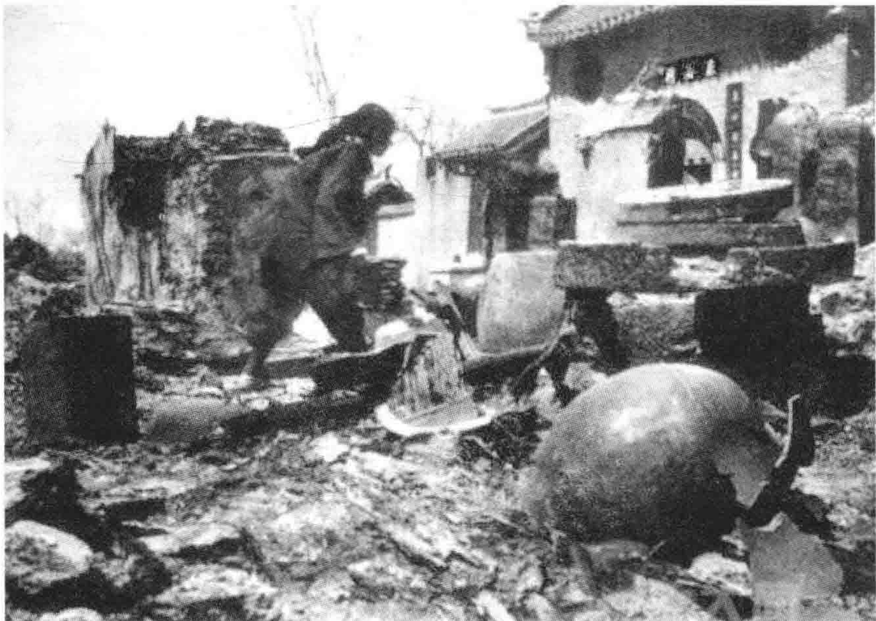
徐州子房山东山律寺(今东山寺)附近一个民居,遭日机轰炸成废墟 (作者是著名现代摄影先驱、匈牙利人罗伯特·卡伯,1938年摄于徐州)。

“5月10日,日军飞机计7批26架分4次轰炸徐州,共投弹230枚,津浦铁路南天桥两侧、下洪乡、顺河街、子房乡等地被炸。因当日风大,火势蔓延,无法灭火,大火烧了一天,计烧毁民房4000间,炸死烧死、炸伤烧伤居民300人。” ①