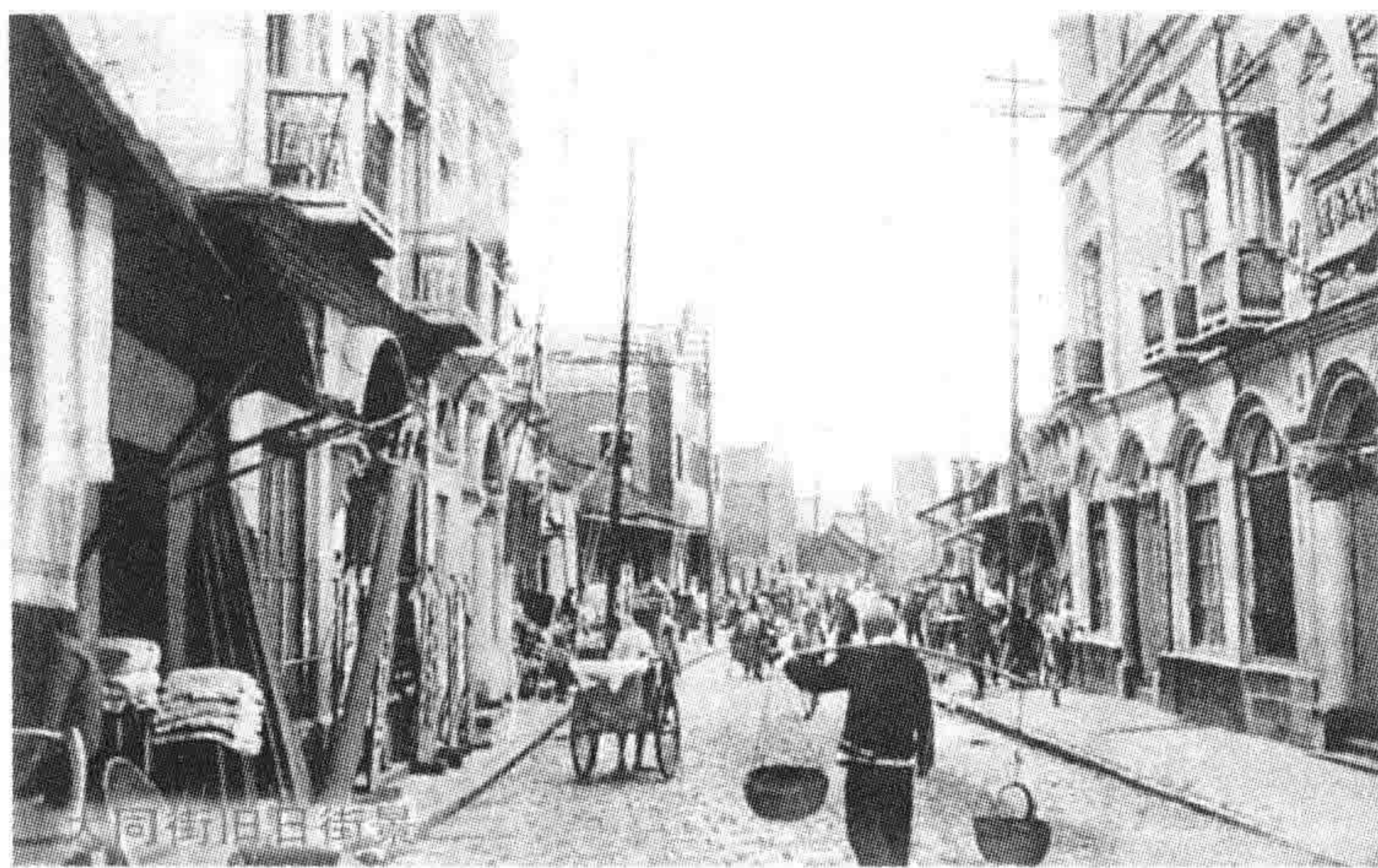
抗战前大同街呈现一派繁华景象

徐州煤矿产煤量,抗战前的1936年为347230吨,1946年为347231吨 ① ,抗战前与抗战后的两个年份的煤炭产量持平。这里有三种因素需要说明:其一,日本