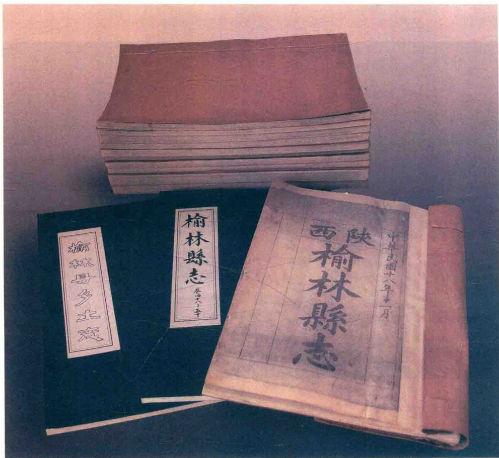
民国十八年（1929）《榆林县志》、民国六年（1917）《榆林县乡土志》