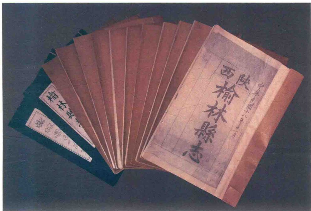
民国十八年（1929）《榆林县志》、民国六年（1917）《榆林县乡土志》