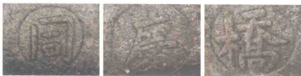
图3 清代石桥“同庆桥”