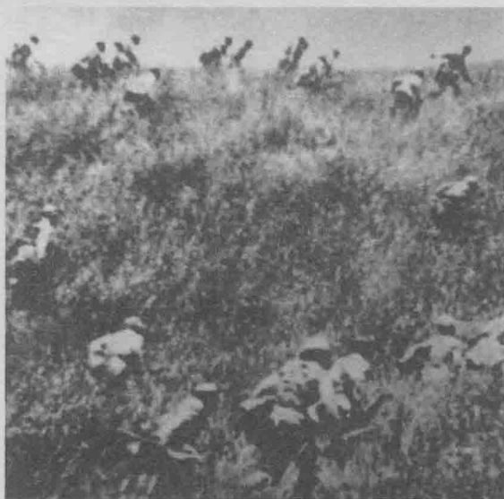
康的战斗情景。 中国人民解放军第十九军进军安