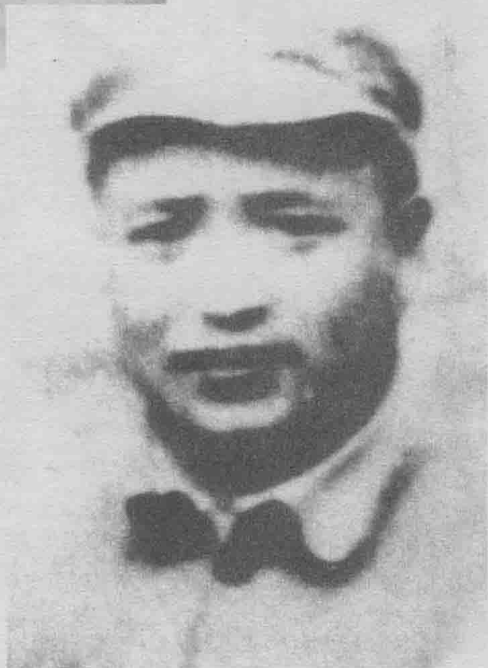
中共陕南 区委第二书记、 前委书记、陕 南军区第二政 委汪锋。