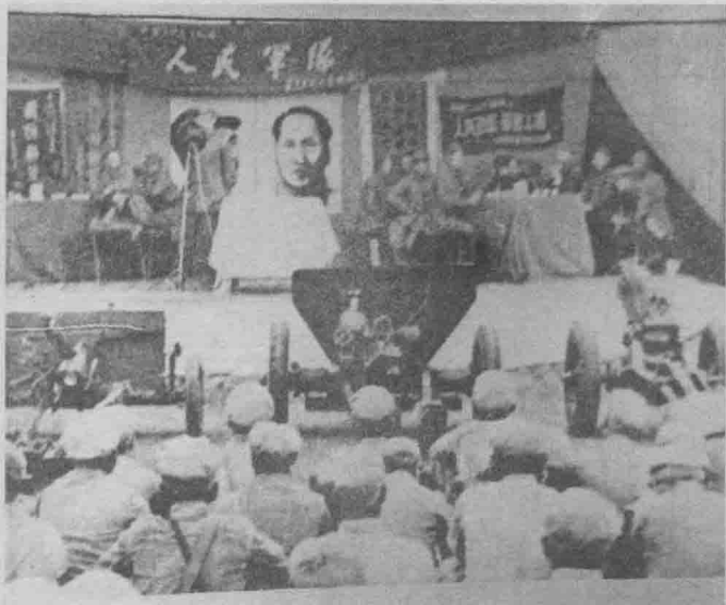
中国人民解放军第二野战军第十九军第一次进军安康前夕召开战斗动员大会。