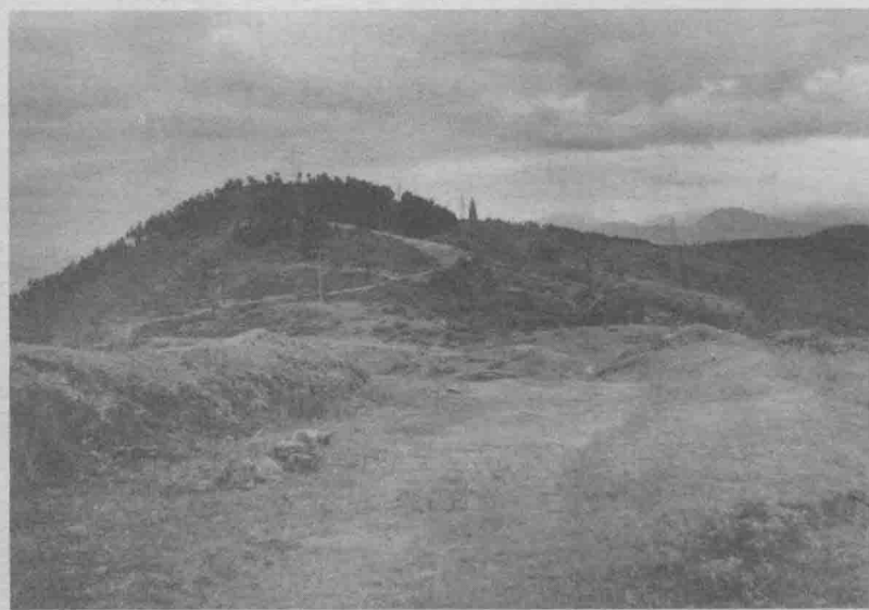
安康牛蹄岭战斗的制高点——石寨子。