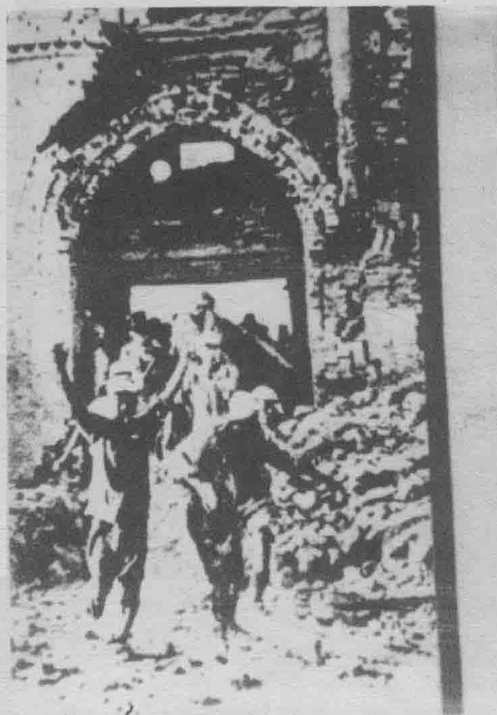
中国人民解放第十九军五十五师在平利俘虏国民党军第一四四师师长符树蓬。