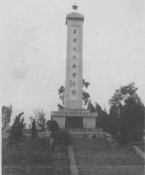
张文津、吴祖贻、毛楚雄烈士纪念塔。