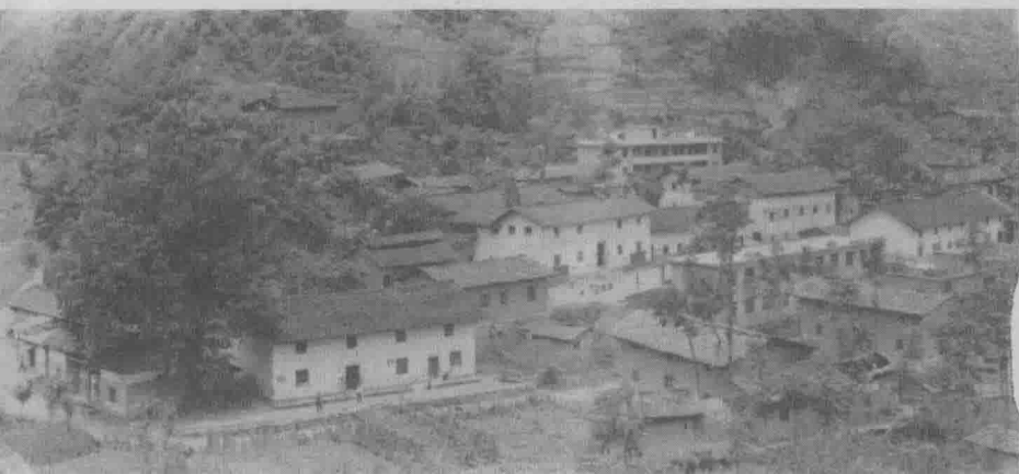
1949年8月至11月中共安康地委机关驻地——白河县裴家河今貌