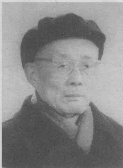
中共安康地委第一书记唐方雷。