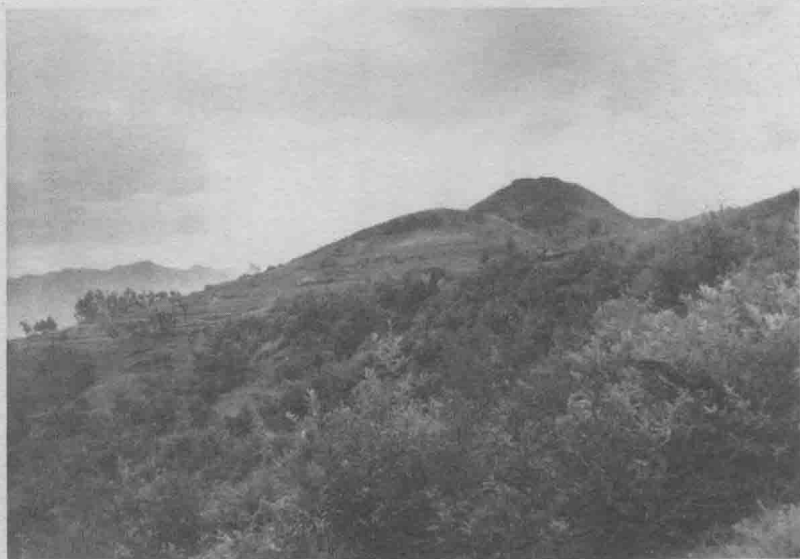
安康牛蹄岭战斗的主战场——塔梁。