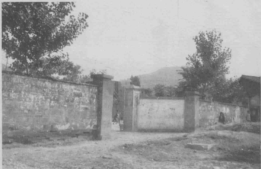
1949年6月至11月中共陕南区委员会前方委员会和中国人民解放军第十九军军部驻地——平利县普济寺。