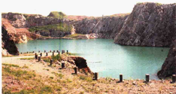
图1 中华猿猴化石考古发现地点

6000年前，先民们已在圩墩（现常州经济开发区戚墅堰街道）等处建立原始村落；（图3）寺墩（现天宁区郑陆镇）遗址发掘表明，约5000年前，这里已形成古城国的雏形。（图4）