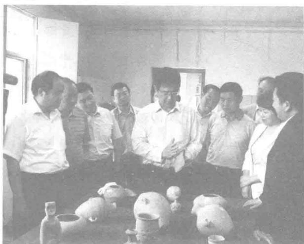
汉中市委书记王建军（左二）在古汉台视察 汉中市委书记王建军（中）考察龙岗新旧石器遗址

宫文物等，再是西北联大在汉中办学八年，为延续中国高等教育血脉，奠定西北高等教育基础做出了不可磨灭的划时代的贡献。