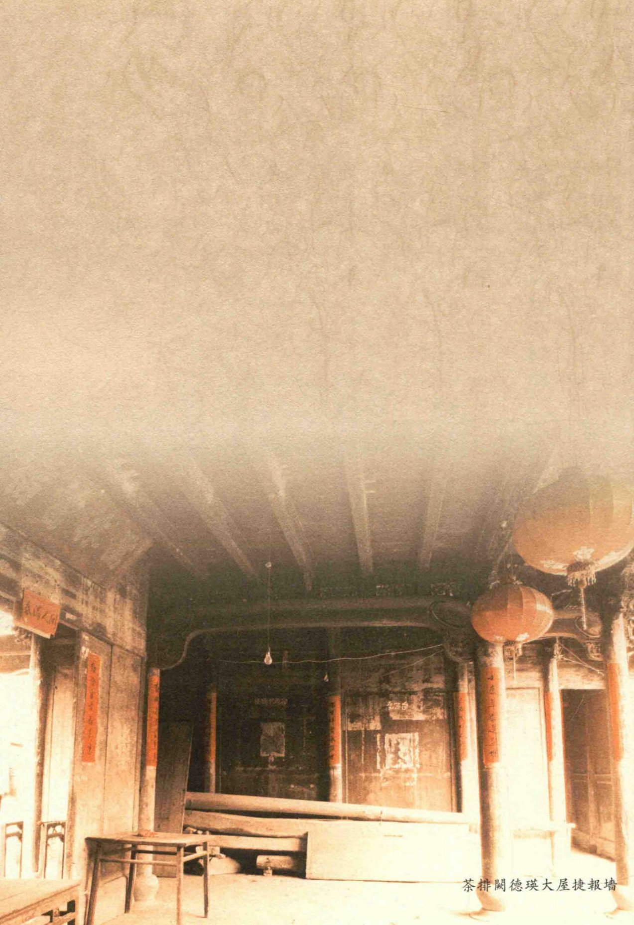
茶排闥德瑛大屋捷報牆