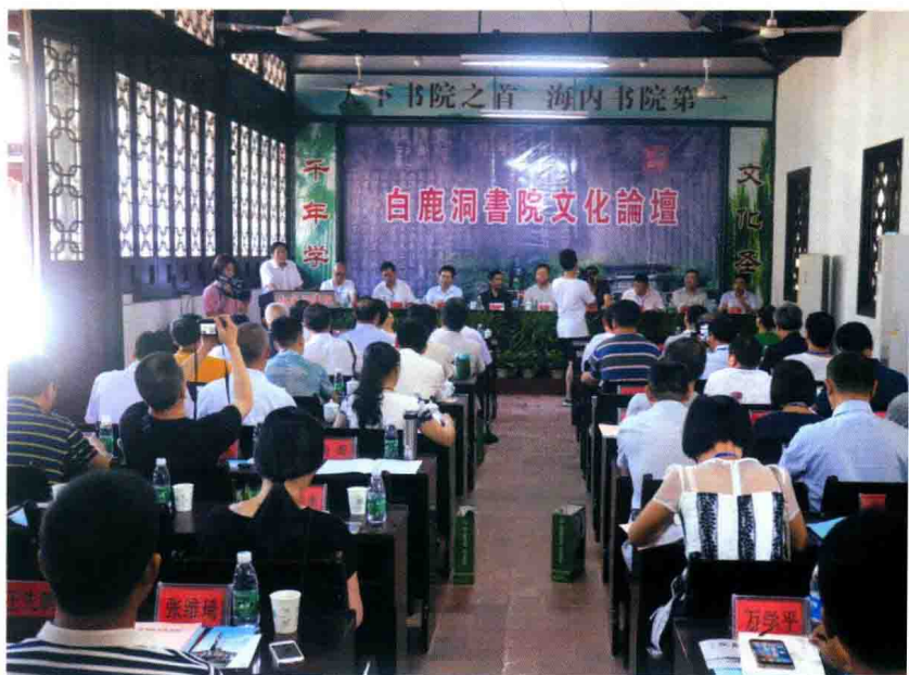
2016年8月17日—19日，首届“白鹿洞书院文化论坛”举办。