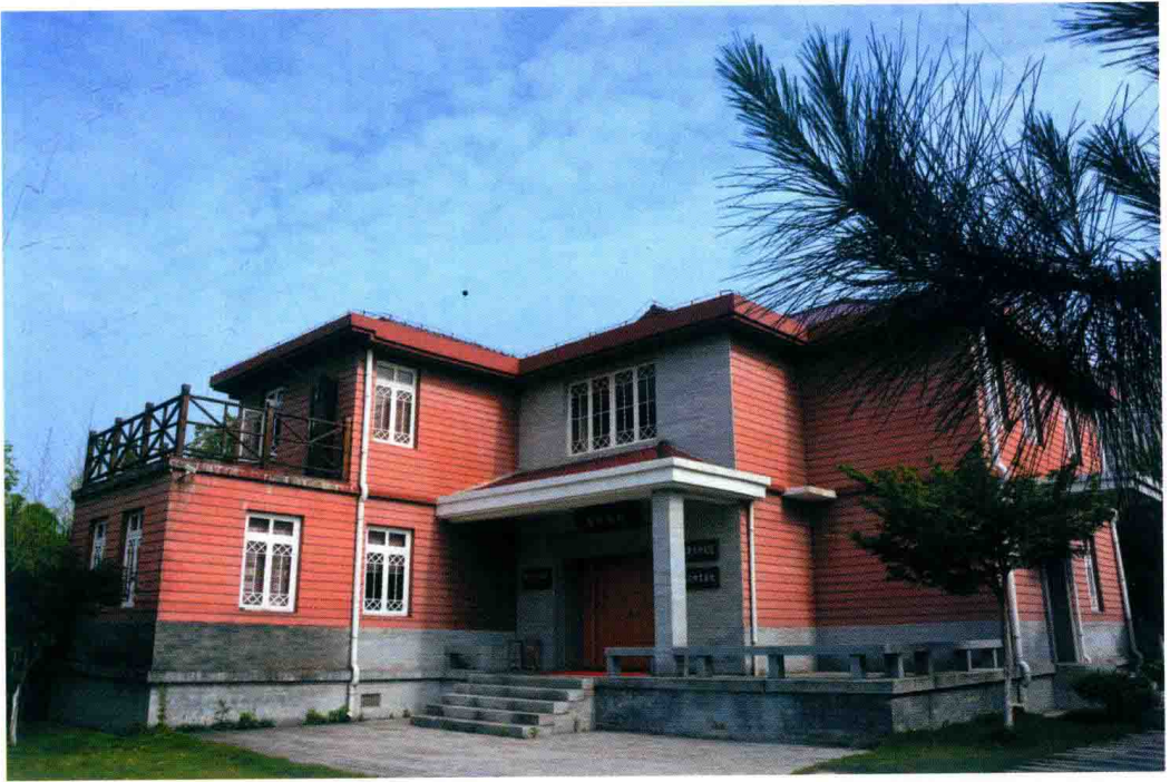
九江学院陈寅恪研究院。