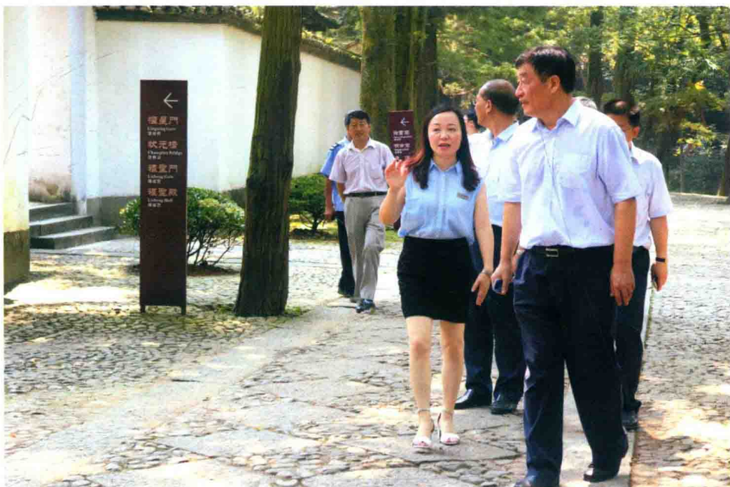
2016年7月24日,江西省委副书记、代省长刘奇来白鹿洞书院调研。