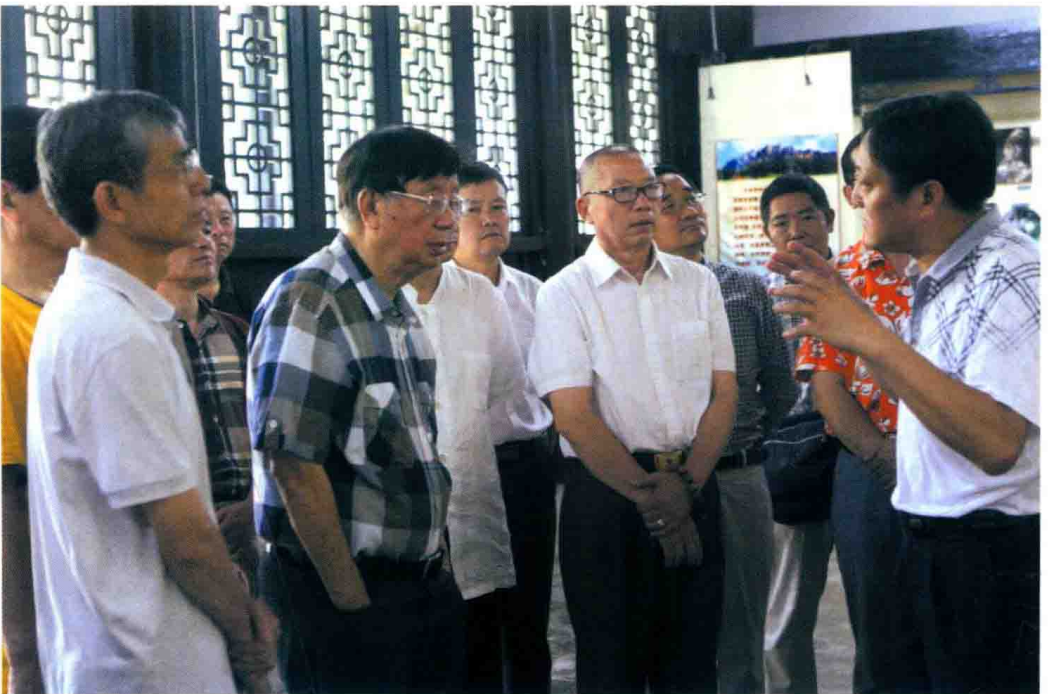
2015年8月1日,美籍华人学者、世界著名哲学家成中英先生来白鹿洞书院参观。