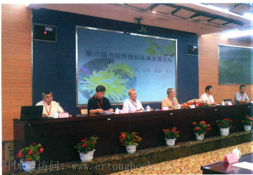
2016年8月8—11日，“第六届书院传统和未来发展论坛”在北京七宝阁书院举行。