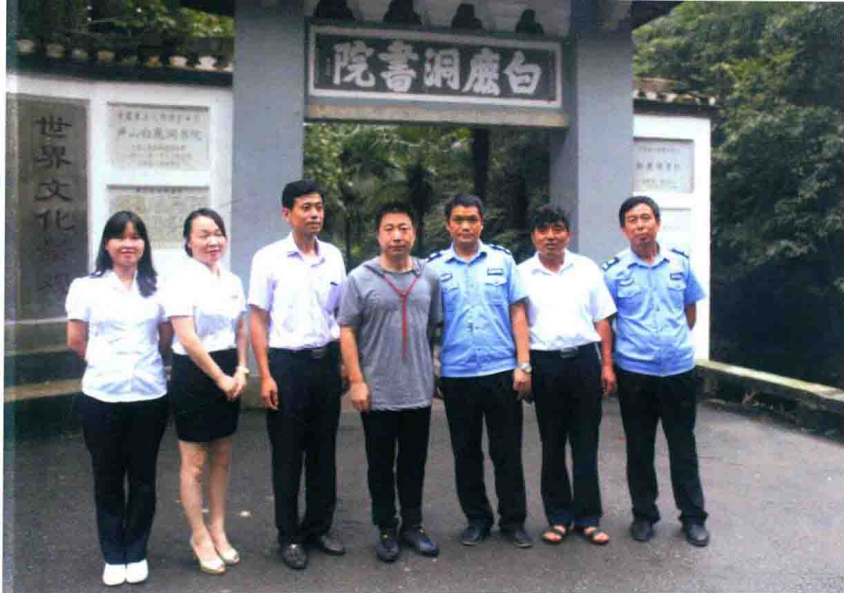
2015年8月20日，“航天英雄”杨利伟少将一行来白鹿洞书院参观。