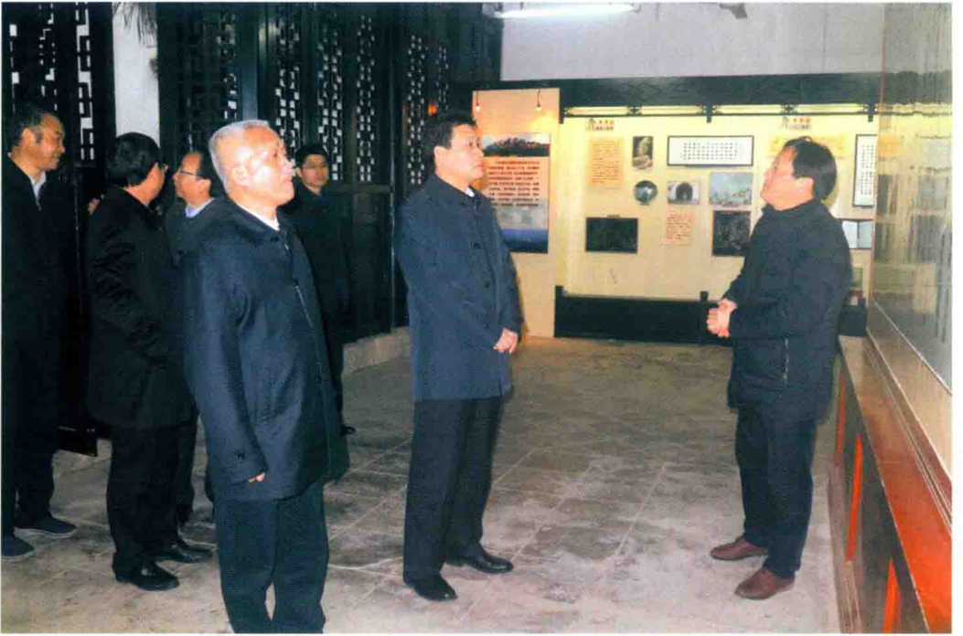
2017年2月7日,江西省纪委书记孙新阳来白鹿洞书院调研。