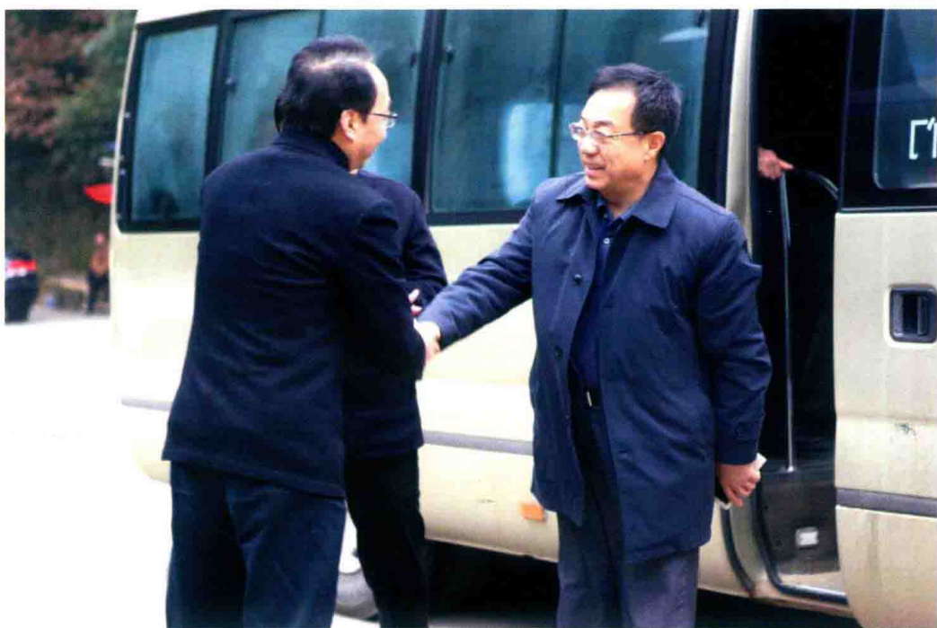
2016年1月16日,国家民政部副部长宫蒲光带队来白鹿洞书院调研,九江市委常委、庐山管理局党委书记杨健陪同。