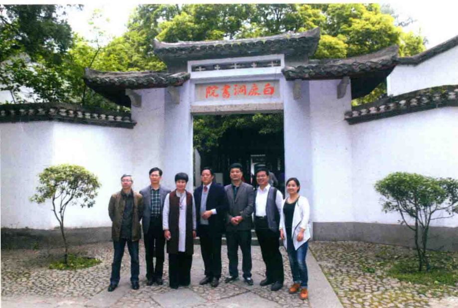
2015年4月23日，浙江明招文化研究会来白鹿洞书院交流。