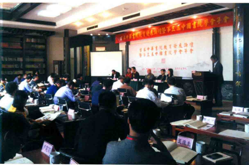
2016年12月4—6日，“首届中华书院教育发展论坛暨第三届中国书院学会年会”在厦门筓筓书院举办。