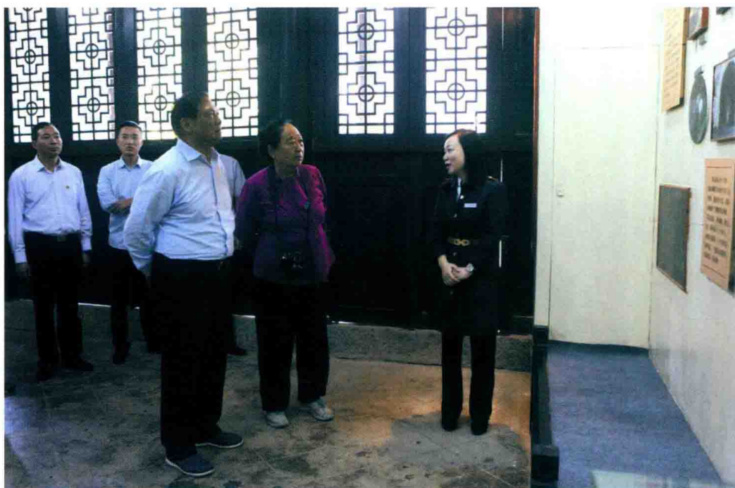
2015年10月18日, 中央政治局委员、北京市原市委书记刘淇来院参观。