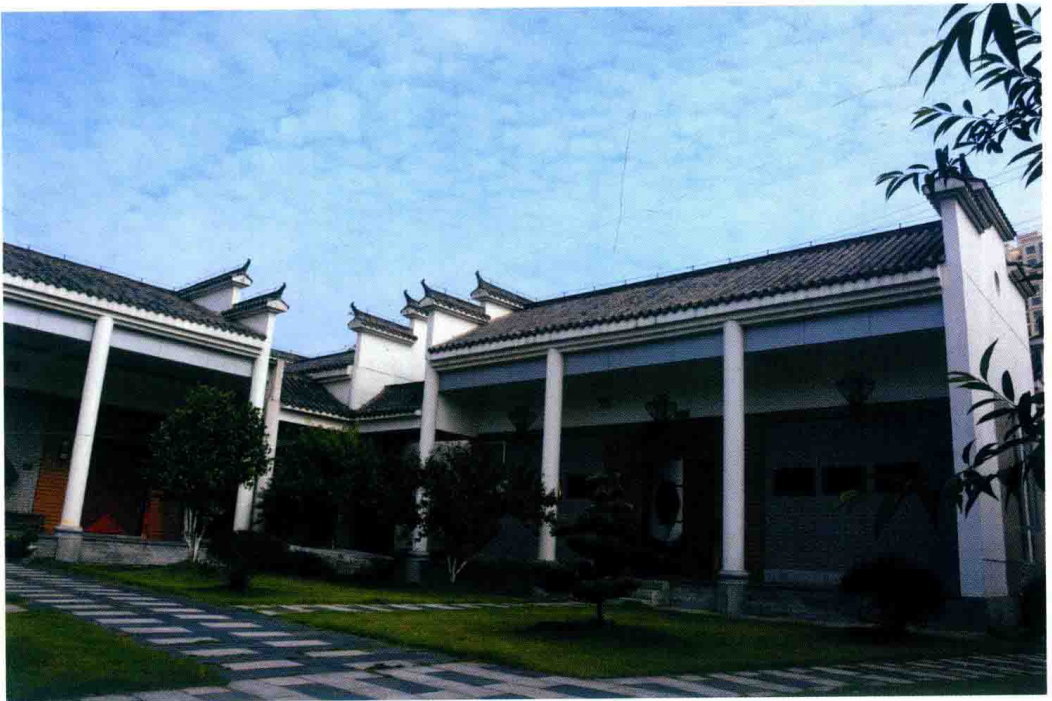
九江学院陶渊明研究院。