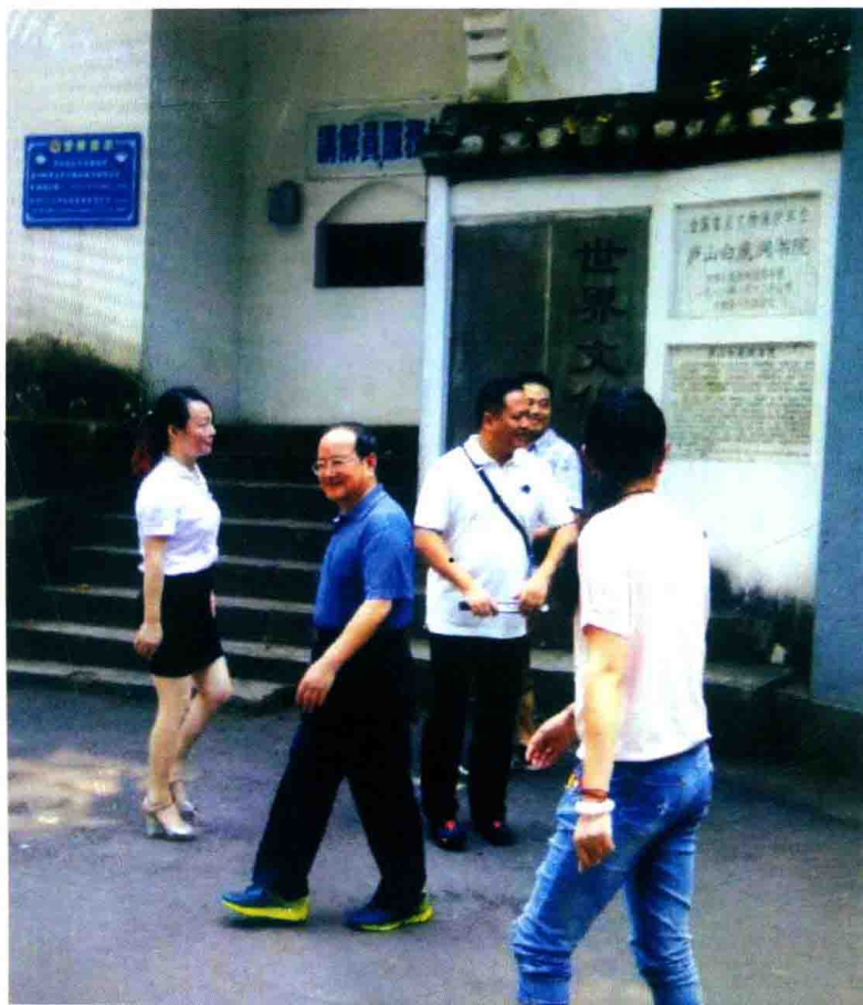
2015年8月7日, 江西省委副书记、代省长鹿心社来白鹿洞书院调研。