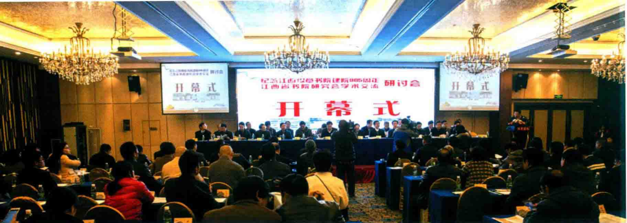
2016年11月25—27日，“纪念江西豫章书院建院885周年暨江西省书院研究会学术交流研讨会”在豫章书院召开。