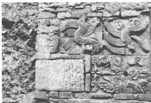
大同巷中的民居院墙砖 / 1999年

作为我国著名的历史文化名城，成都已有明确记载的建城史长达2300多年。由于多次战乱，古老的城墙早已不存，离现在最近的清代城墙也已在1958年被拆除，如今可以见到的只有几段残墙。