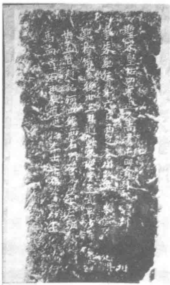
图 1-1：石门沟北壁摩崖拓片图

石门沟摩崖石刻位于舟曲县大川镇石门沟村东北约 200 米处的石门沟峡谷东西两侧的崖壁上，且两崖壁上均凿有古代修建栈道的方形榫孔百余个，大小不一，今存古栈道遗迹东西长约 200 米。北侧石壁上的摩崖石刻（图 1-1）刊刻于北宋皇祐四年（1052）十月，今高出石门沟溪河床约 90 厘米，位于古栈道的下部。石刻高 120 厘米，宽 45 厘米。其正文阴刻楷书 5 行，满行 21 字，每字约 5 厘米见方，共刻有 100 余字，下部因河流泥沙冲刷已有十余字磨灭不清，无法辨别。南侧石壁上的摩崖刻石（图 1-2）高出今河床约 10 米，位于古栈道的上部，石刻高 90 厘米，宽 60 厘米。两壁上的文字均保存较为完整。