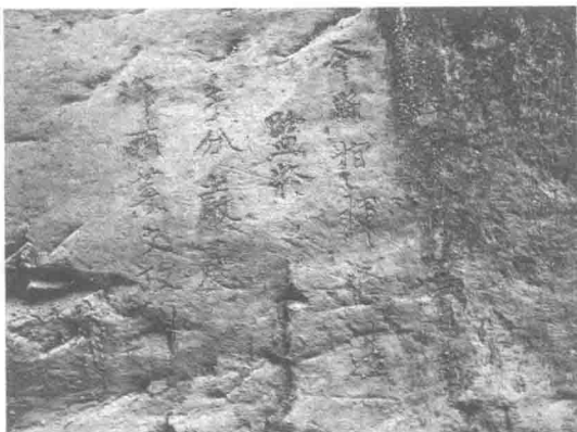
图 1-2: 石门沟南壁摩崖

自十六日西之本州故城 [5] 、峰贴峡 [6] 、平定关 [7] 点检城寨后，廿三日过此，又巡历至武平 [8] 、沙滩 [9] 诸寨回，廿五日题记河口镇 [10] 西石门峡 [11] 东壁上。左班殿直 [12] 买马 [13] 向宣 [14] 、右班殿直 [15] 巡检 [16] 李士宗、福津县 [17] 尉 [18] 王□□行。