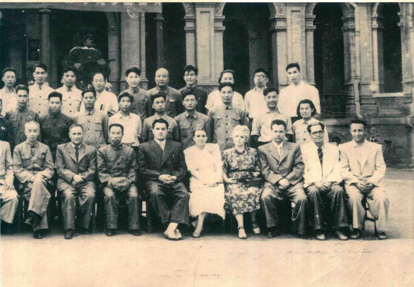
■ 学校领导、教员与苏联专家合影 1951年

Руководители и преподаватели университета с советскими специалистами 1951 г.