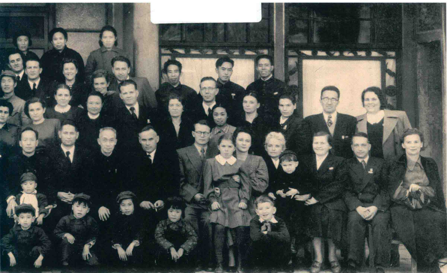
■ 学校领导、教员与苏联专家合影 1952年

Руководители и преподаватели университета с советскими специалистами 1952 г.