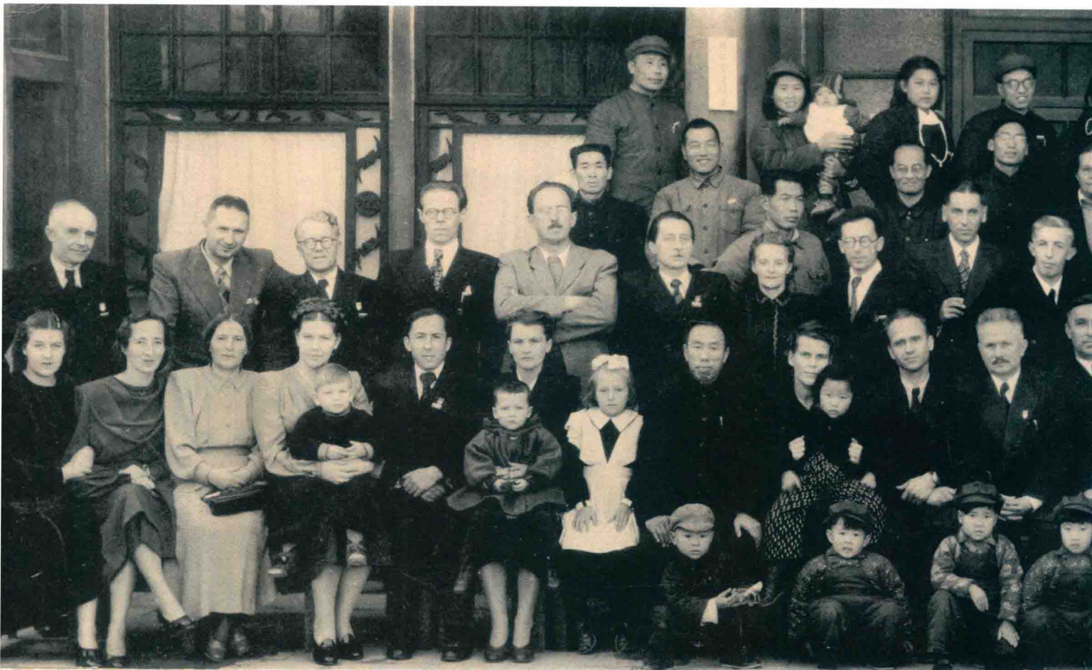
Советские специалисты в Народном университете Китая в 50-е годы XX века