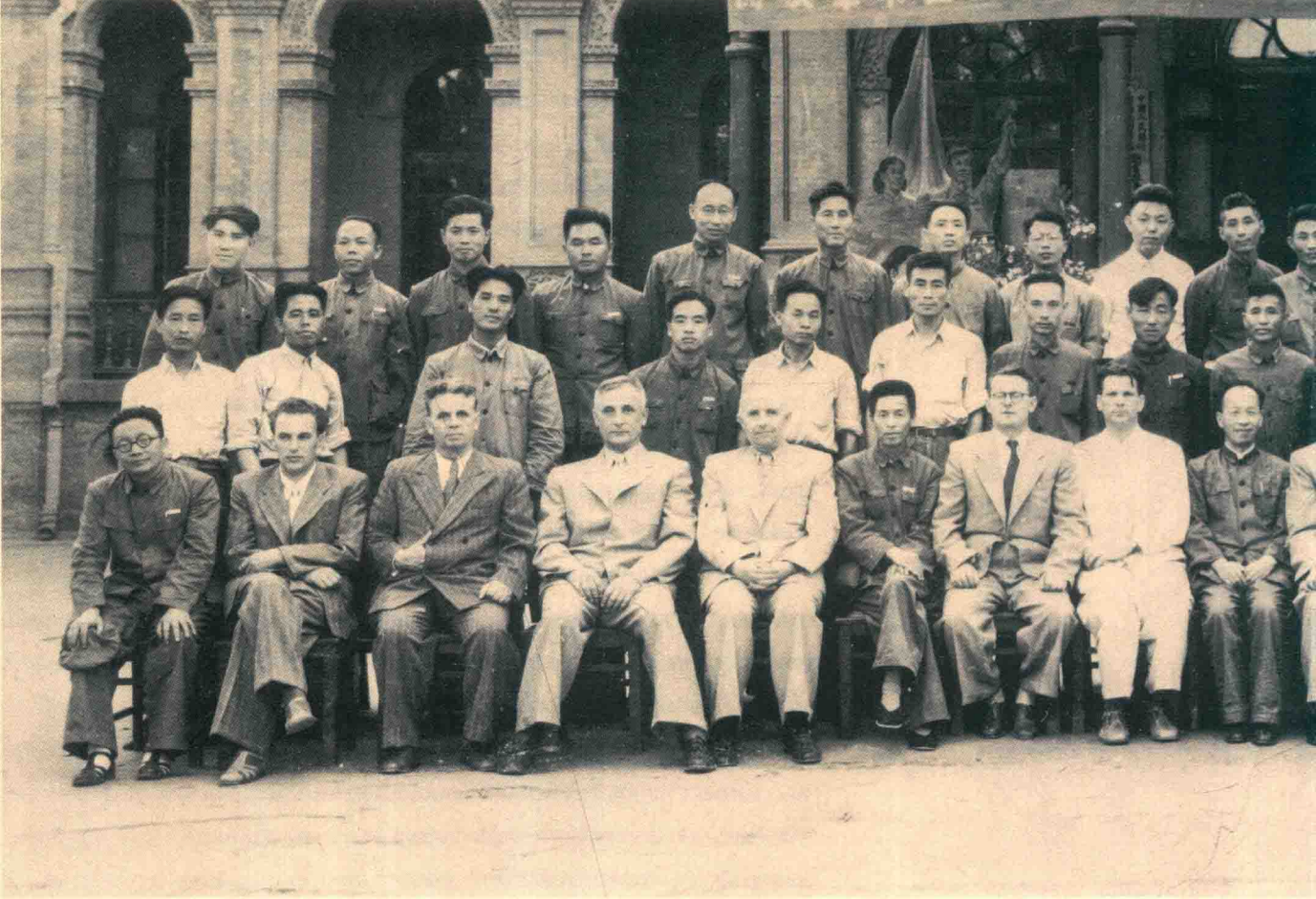
Советские специалисты в Народном университете Китая в 50-е годы XX века