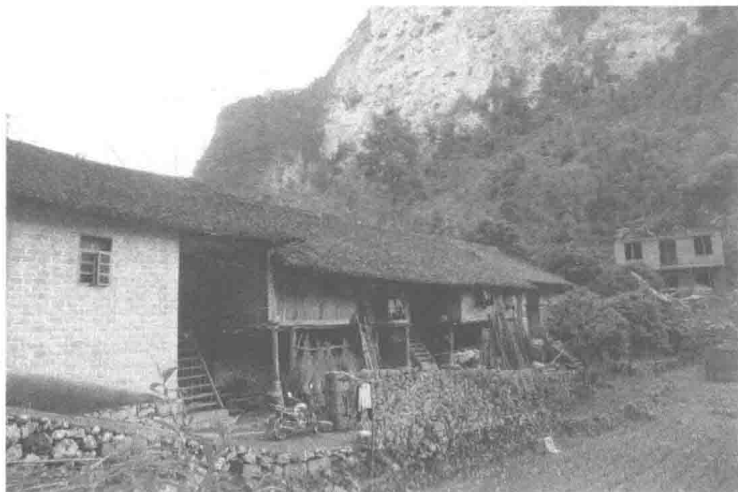
图 1-2 干栏

毛南族人大多聚居于一个村屯，村庄依山而立。石山上留有一大片护村林，既可以防止石头滚落，又美化村景，这里的树林是不允许被随意砍伐的。住房多数是泥墙上瓦，少数是砖墙盖瓦，分上下两层，上层住人，下层饲养牲畜、放置农具及柴草，形成“干栏”，随着社会经济的发展，现在这种“干栏”已经很少见了（图 1-2）。“干栏”的住房墙基多用料石砌成，坚固而美丽。“干栏”的柱脚、门槛、阶梯等也多用料石，或用木材建成一座坪台供晾晒物品用。