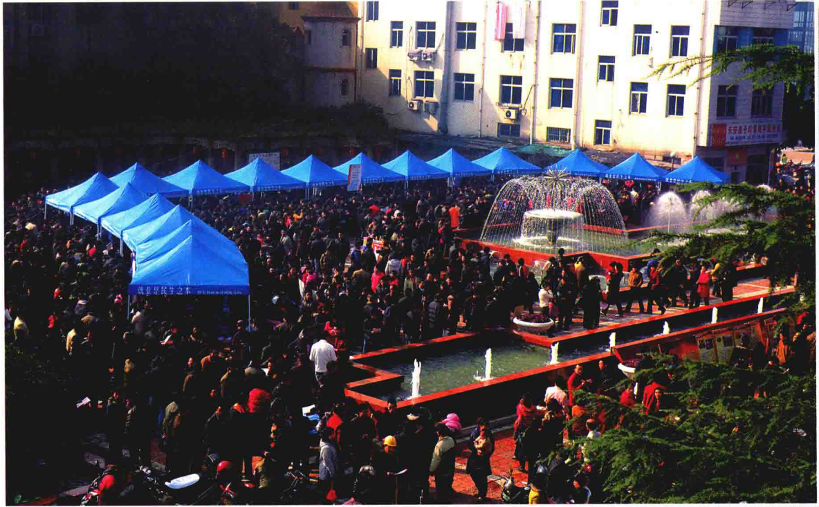
2009年2月2日，在龙山公园举办人力资源招聘会。