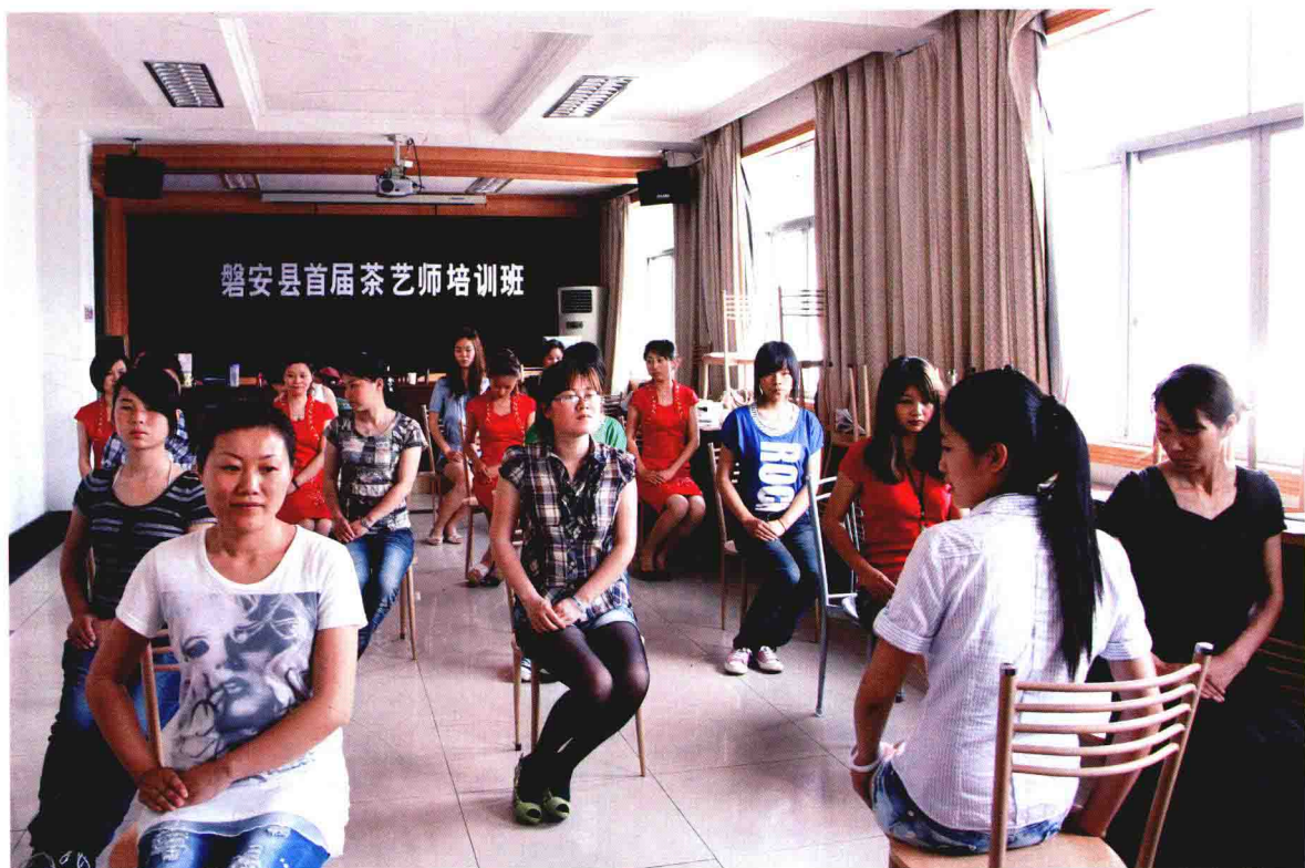
2011年5月20日，磐安县首届茶艺师培训班。