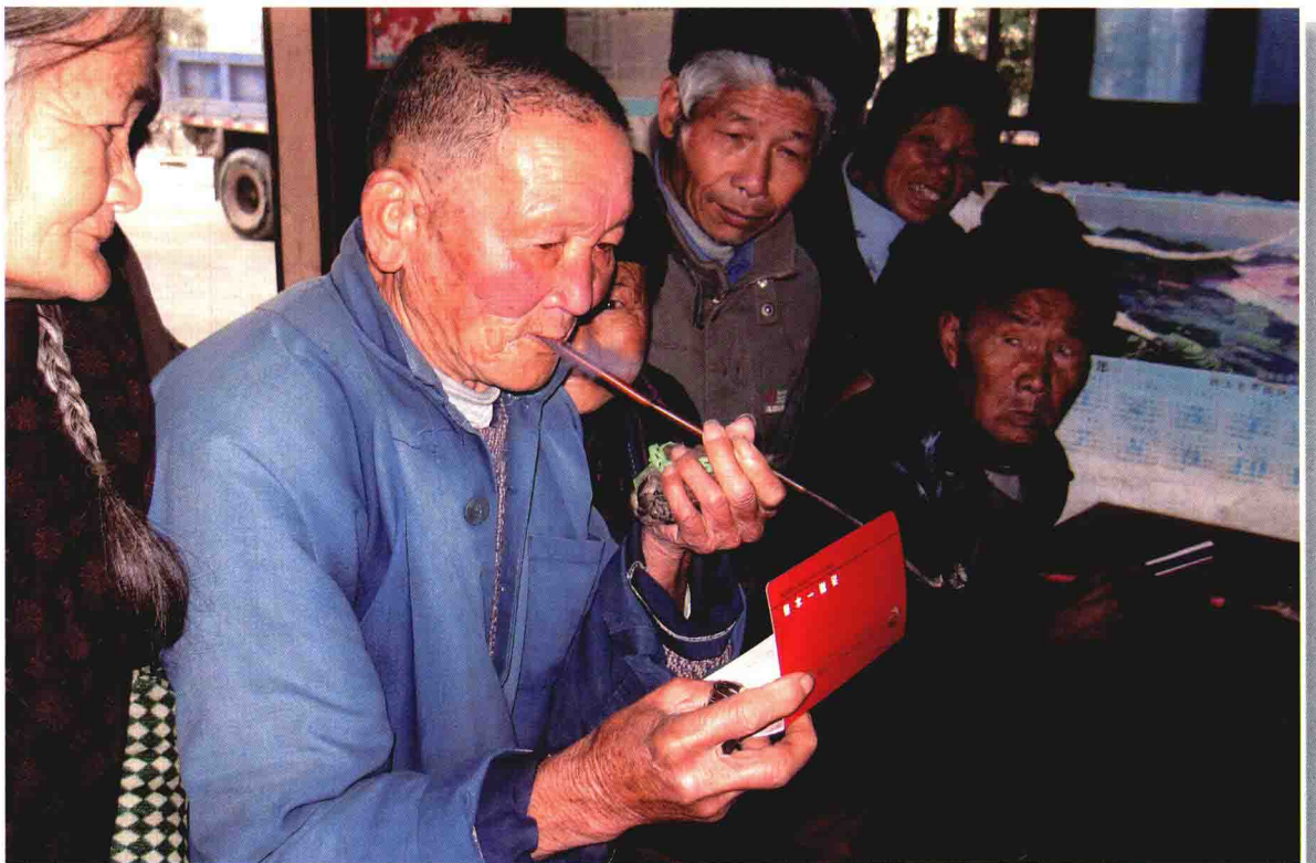
2010年1月18日，60岁以上农民喜领养老金。