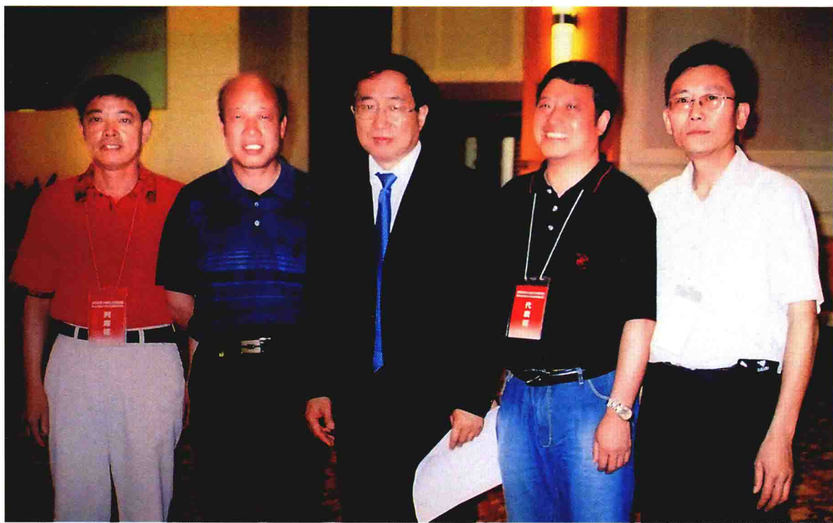
2007年5月，陈建军局长、陈金星副局长、县就业处顾正伟主任一行三人赴广东省东莞市参加劳动和社会保障部召开的“全国劳务输出示范县座谈会”，并受到劳动和社会保障部张小建副部长的亲切接见。