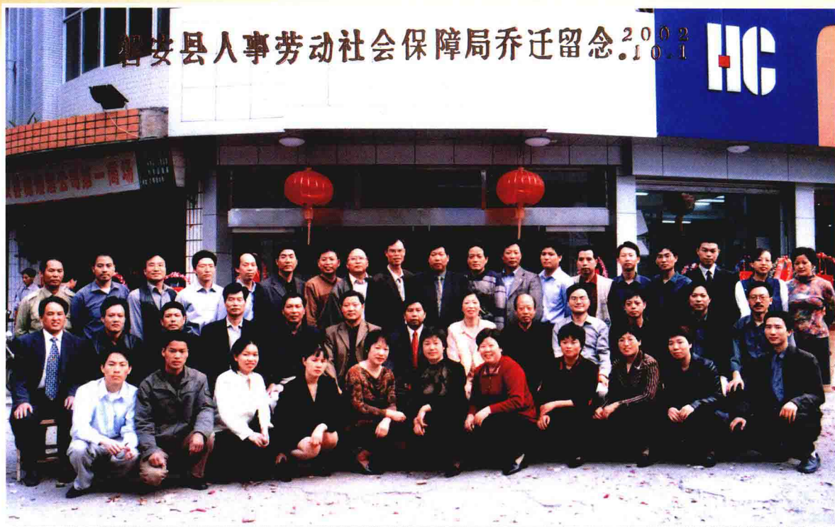
2002年10月1日，磐安县人事劳动社会保障局以及县就业管理服务处、县社会保险办公室等直属事业单位从城上街7号搬迁到新人事劳动社会保障大楼（海螺街14号）办公，局机关与直属事业单位全体工作人员合影。