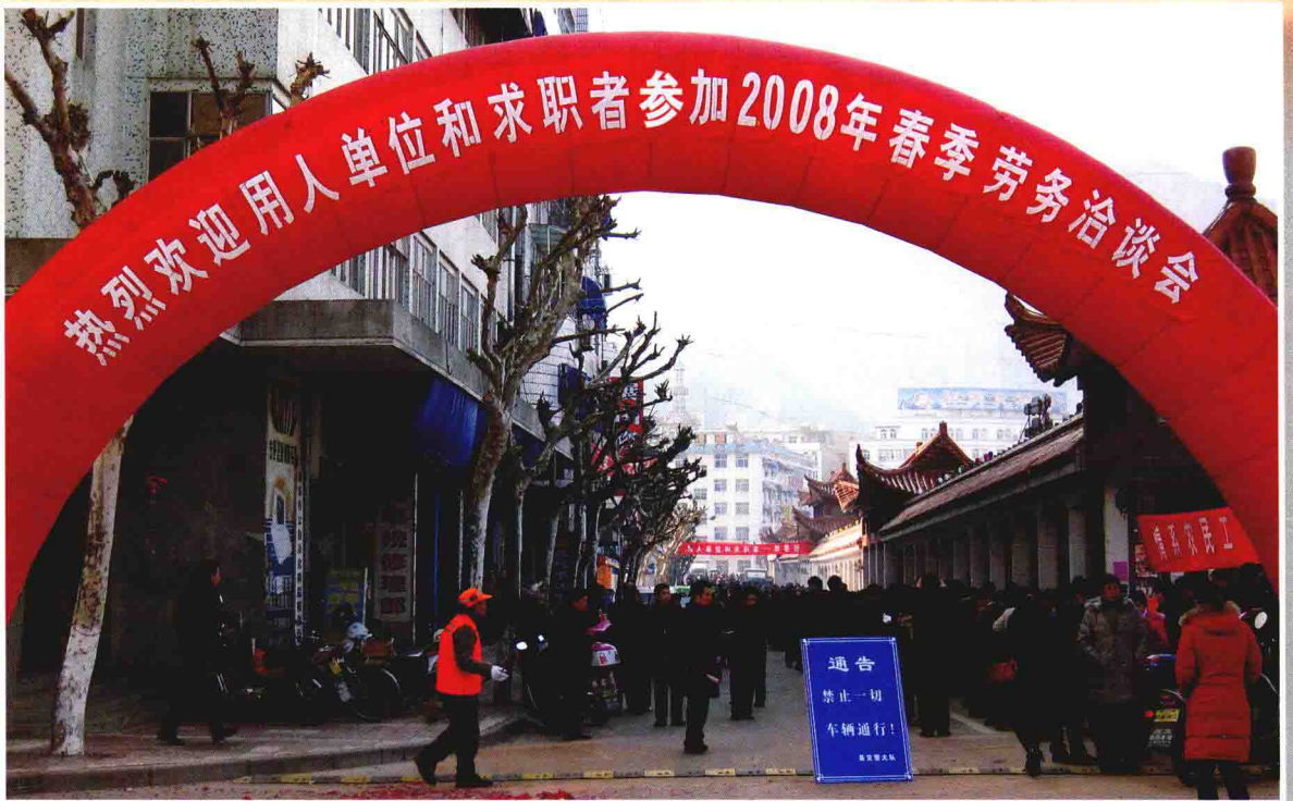
2008年2月14日，在文化长廊举办2008年春季劳务洽谈会。