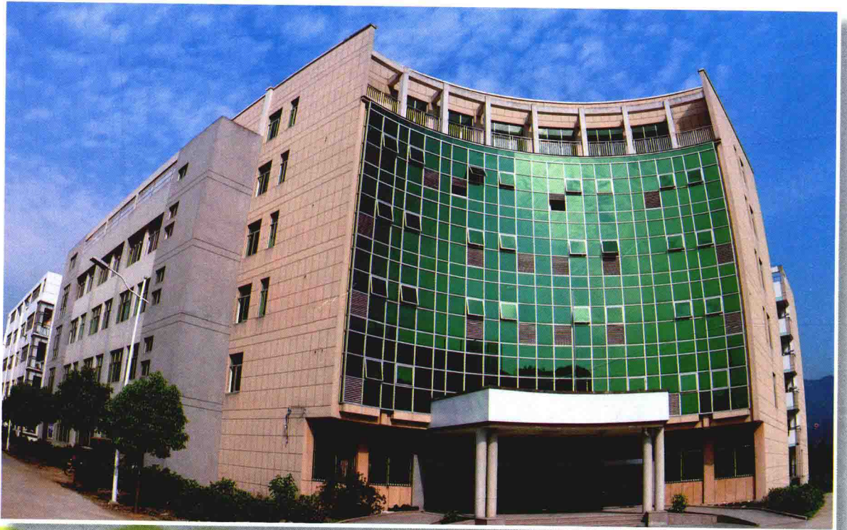
磐安县失业人员创业园。