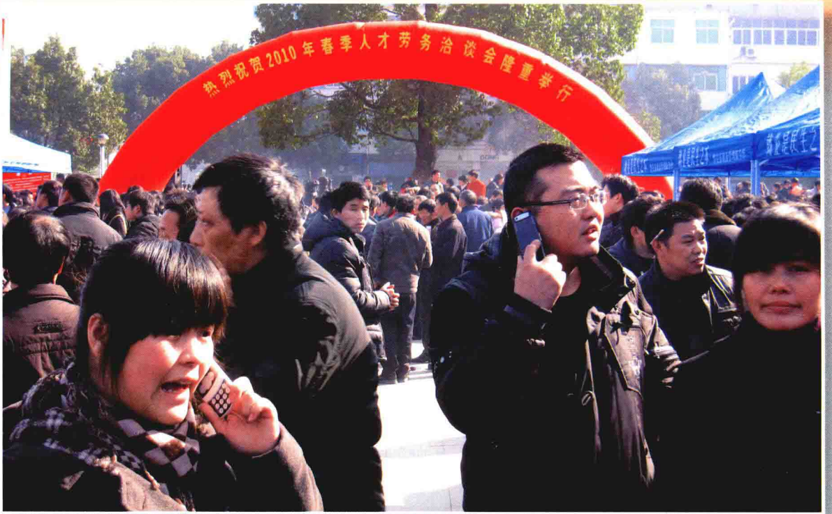
2010年春季人才劳务洽谈会现场。