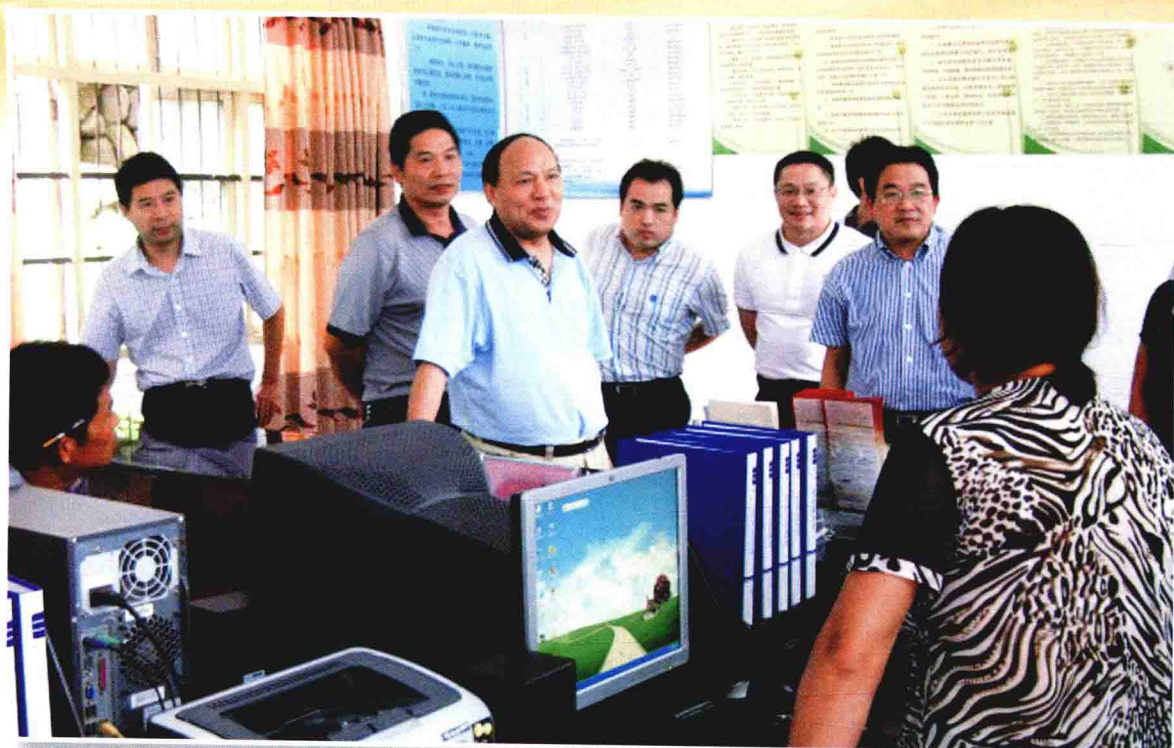
2011年8月，浙江省人力资源和社会保障厅厅长乐益民视察磐安县盘峰乡榉溪村劳动就业社会保障服务站，县委书记周剑敏陪同。