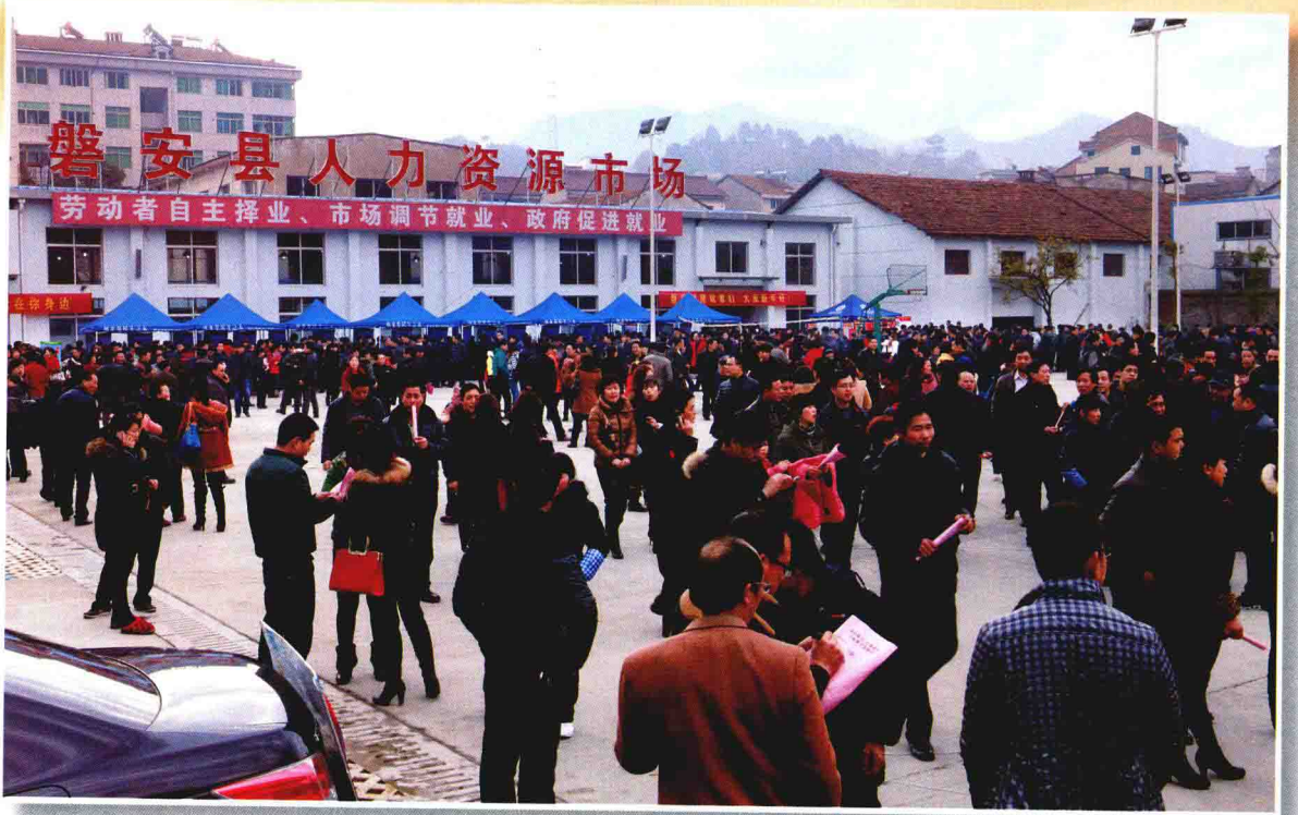
磐安县人力资源市场。