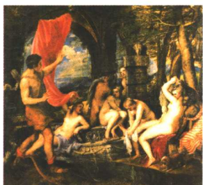
狄安娜和阿克列翁 提香