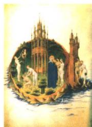
逐出乐园 林堡兄弟