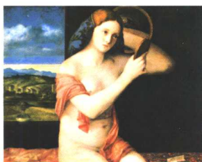
照镜子的妇人 贝利尼