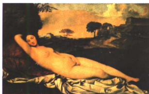
入睡的维纳斯 乔尔乔纳