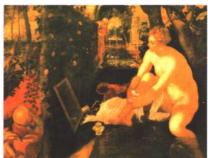
浴后的苏珊娜和长者 丁托莱托