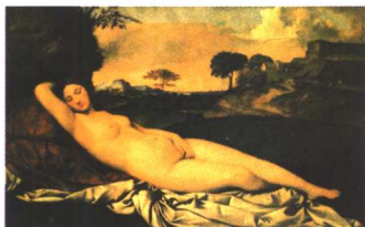
入睡的维纳斯 乔尔乔纳