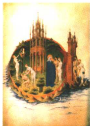
逐出乐园 林堡兄弟