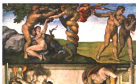
逐出伊甸园 米开朗基罗