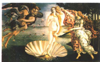
维纳斯的诞生 波提切利