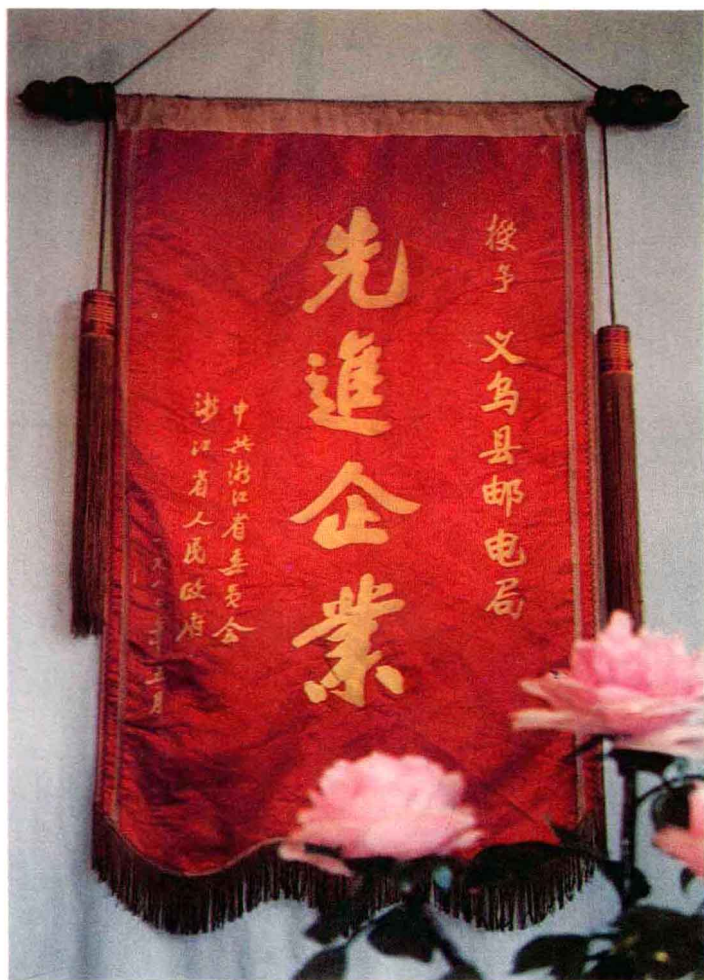
1980年省局授予“先进企业”锦旗