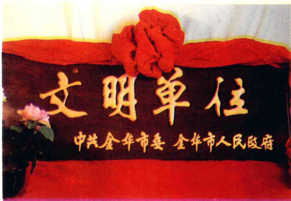
1986年中共金华市委、金华市府授予 “文明单位”奖牌