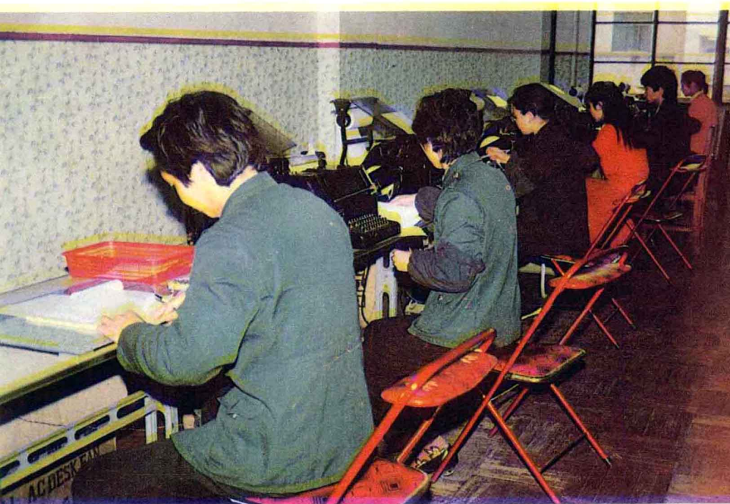
县局报房收发电报