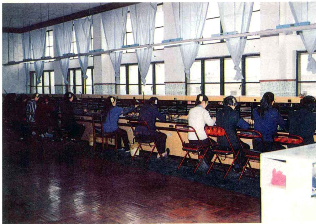
县局长途农话台接转电话