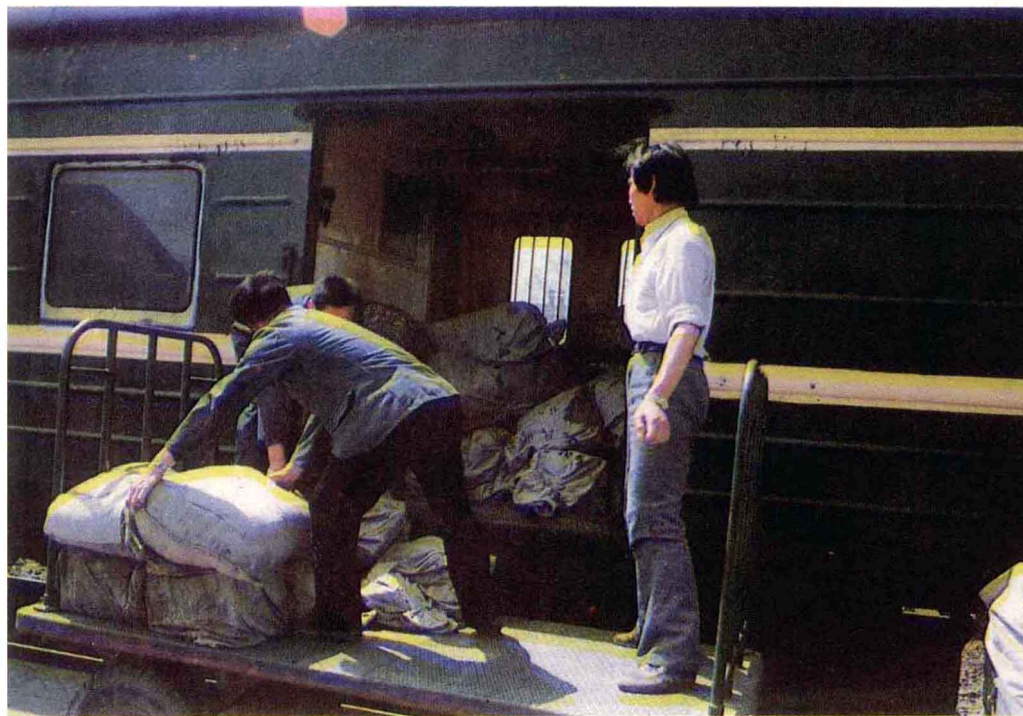
邮件接发员与运邮火车交接邮件