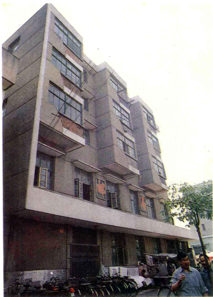
小商品市场邮电支局