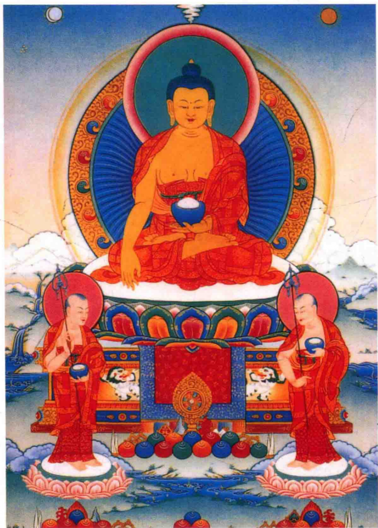
南无本师释迦牟尼佛