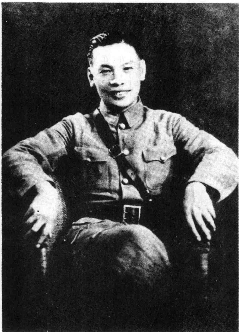
從蘇聯返國，蔣經國在江西新贛南擔任督察專員，這是國內少見的蔣經國年青時代照片