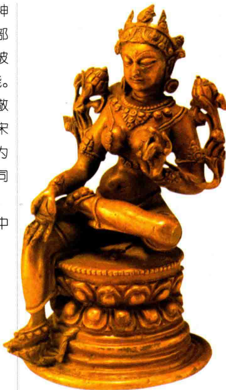
◇红铜度母半跏趺坐像（明代）