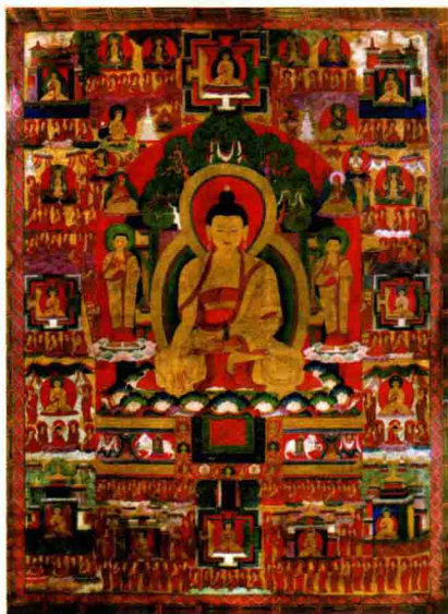
◇释迦牟尼佛成道相唐卡（明末清初）

表示释迦牟尼在成道前的过去世中，为了众生不惜牺牲自己，这一切唯有大地能够证明，因为这些都是在大地上做的事。因此，这种姿势的释迦佛又名“佛成道像”。这一形象的释迦佛通常供奉于大雄殿中央，为三世佛或三身佛之主尊。其旁常有两位比丘形象的立像，是他的两大弟子阿难和迦叶：左边年轻的是阿难，右边年老的是迦叶。