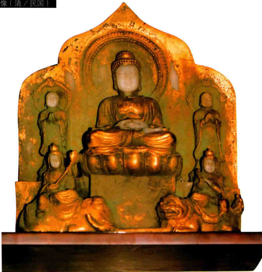
◇玉鎏金阿弥陀佛像（清 / 民国）