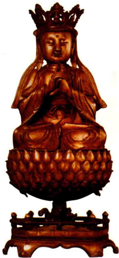
◇铜鎏金弥勒佛坐像（明代）

宝生佛，梵语 Ratna-sambhava 的意译。又称南方福德聚宝生如来或宝幢佛。在一些显教经典里又称做“南方宝幢佛”或“南方宝相佛”。宝生佛是密教的重要膜拜对象，象