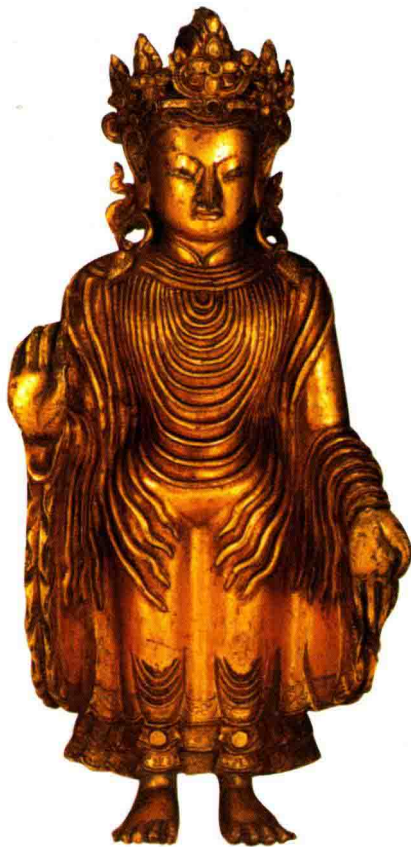
◇铜鎏金旃檀佛立像（清代）

藏密中佛的形象较之汉地佛教也稍有差异，但是形象塑造上并无区别，只是比汉地多了菩萨装束的佛和愤怒形象的佛，如金刚持和金刚手。此外，由于印度和尼泊尔等