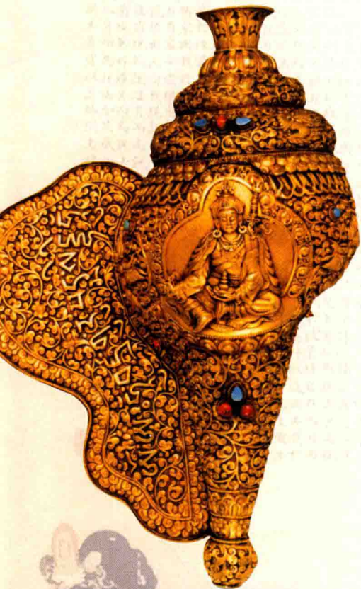
◇御制镂金嵌宝石莲华生大师金螺（清代）

有断尽，即：见惑一住，思惑三住，尘沙惑和无明惑合一住，所以菩萨只具备前两项。罗汉便只有自觉，没有他觉，更达不到觉行的圆满。