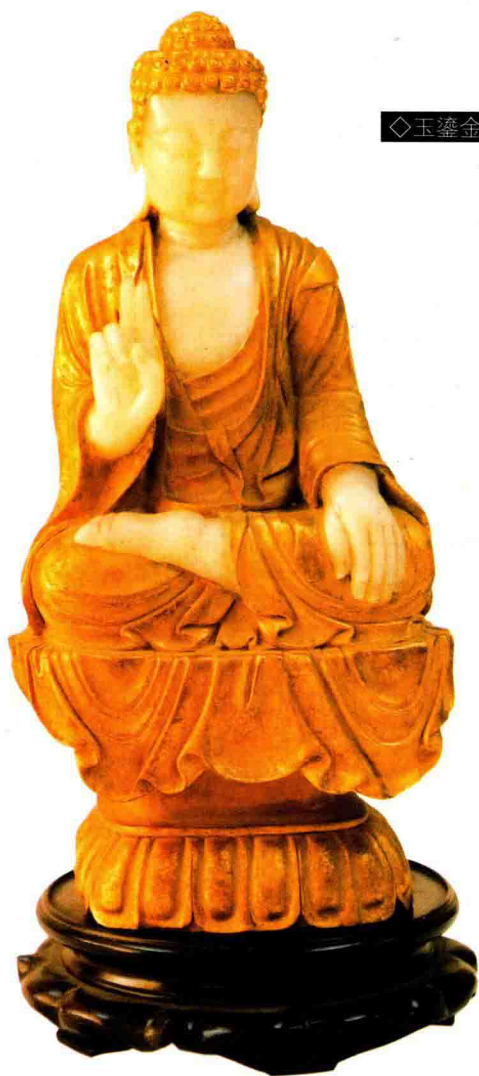
◇玉鎏金佛坐像（清 / 民国）