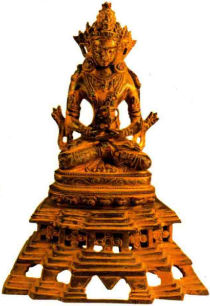
◇铜无量寿佛坐像（清早期）

佛是无量光佛化现出来的次生佛。 阿弥陀佛是佛门中的一位大佛，《无量寿经》记载：弥陀佛在西方极乐世界中往往高坐于莲台上，观世音菩萨和大势至菩萨为胁侍，因此人们称这三位大圣人“西方三圣”，或称为“阿弥陀三尊”。 说起阿弥陀佛，人们想到的更多地是佛家弟子常念的佛号，其实不然。关于阿弥陀佛这佛尊的身世，自古至今流传甚多，其中有一种说阿弥陀佛生前是古印度的一位国王，因听高僧说法，从而信仰不移，遂放弃王位，剃度出家，法号“法藏”。后来经历了无数劫难，终于修成正果，在他修成佛陀之前曾发下四十八大愿，拯救众生脱离苦海，其中一愿是：凡信奉他，念他佛号的人，死后都会到西方极乐世界。传说西方极乐世界是极美的去处，极乐世界的一切都是金、银、琉璃、珊瑚、琥珀、车渠、玛瑙七宝自然合成。吃的是“百味饮食，自然盈满”，人们不但无忧无虑，