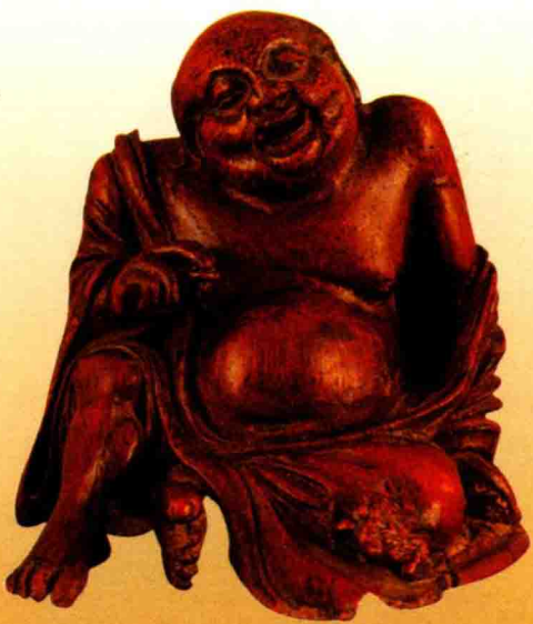
◇竹雕弥勒佛坐像（清代）

在寺庙中对千佛的供奉也屡见不鲜。其供奉形式各种各样：或在大雄宝殿作千佛像壁画，或在法堂中陈列小型的千佛塑像，还有一种是特建“千佛阁”或“千佛殿”