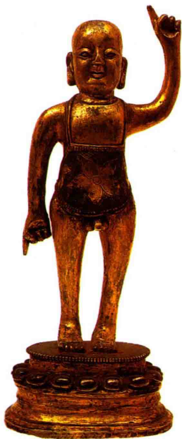
◇铸铜鎏金释迦牟尼诞生像

双脚伸直并拢，左手置身体上，右手支头，双目微闭，自在安详。这种佛像通常供奉于寺院后殿卧佛殿中。