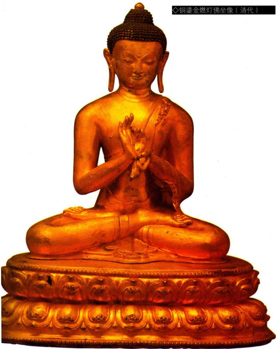
◇铜鎏金燃灯佛坐像（清代）

弥勒，是梵文的音译，意即“慈悲为怀”，是佛教中的菩萨名，也就是说弥勒是现在的菩萨、未来的佛。在佛经中，慈悲的含意为“去苦予乐”，无条件地使对方得到快乐谓之“慈”，无条件地为他人除去苦难谓之“悲”。弥勒是姓，其名叫“阿逸多”，意为无人能胜。