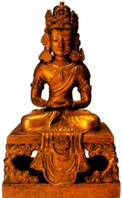
◇无量寿佛坐像（清乾隆）