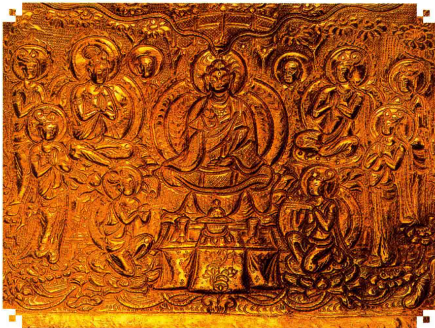
◇唐密释迦牟尼如来（说法）曼荼罗像（西安法门寺地宫金宝函）

而空间上的“世”特指佛国世界。《长阿含经》等经记载：以须弥山为中心，以铁围山为外廓，同一日月所照的四天下（即一个太阳系）为一小世界，一千个小世界（即一千个太阳系）为一个中千世界，一千个中千世界为一个大千世界。由于大千世界包括大中小三种不同千世界，所以又称“三千大千世界”。