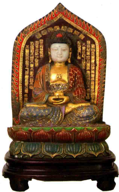
◇玉雕释迦牟尼佛坐像（清/民国）

红润、上下匀称；第三十三好，鼻梁修长，不露鼻孔；第八十种好，手足及胸都有吉祥的“卍”字相等。不管是“三十二相”，还是“八十种好”都体现了古印度人对佛祖的无限崇敬，才把审美观念及审美标准中所有的好都赋予给了佛。