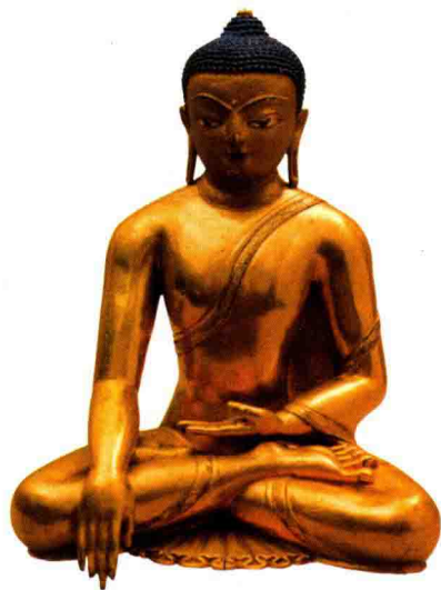
◇铜鎏金释迦牟尼佛坐像（元代）

三世佛中的“世”，也有时间和空间之分，在时间上“世”有“劫世”之意，梵语“劫波”的简称，劫又分为大劫、中劫和小劫，每一劫时都以人寿的增减来计算。佛教中称世间人的寿命从十岁开始，每百年增长一岁，增至八万四千岁；再从八万四千岁开始，每百年减一岁，减至十岁。这一增一减各为一小劫，相当于八百四万年。一增一减合为一中劫，相当于一千六百八十万年。佛教的一大劫包括成、住、坏、空四个时期，每个时期又包括二十中劫。因此一