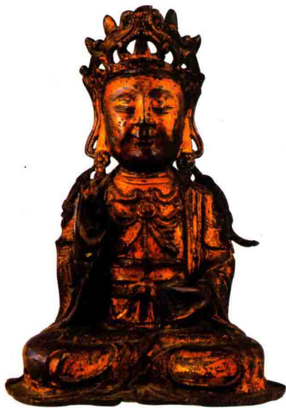
◇铜鎏金佛坐像（明代）

首先，佛的造型必须符合古印度人在塑释迦牟尼佛像时规定的形象特征，必须具备“三十二相”、“八十种好”。这个规定是具有宗教意义的，是后来成为塑一切佛的基本模式。其中三十二相是指佛三十二种奇异突出的不同凡俗的特征，又称三十二大人相、三十二大士相。相是指能明显看到的特征，例如三十二相中包含的：头顶肉髻，皮肤细腻，眉有白毫，睫毛长美，广长舌相，牙齿齐白，双肩圆满等等。八十种好，又称“八十种随形好”，大多是看不到的特征，例如：头、面、鼻、口、耳、眼、手、足等处八十种微细特征。但其中也包括一些看得见的特征，如：第一好，佛的指甲薄润、光洁；第三好，手足指圆而细长；第二十八好，嘴唇