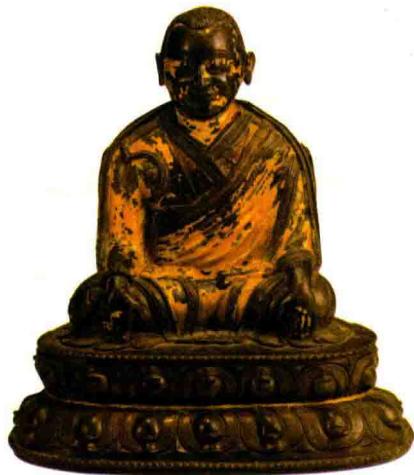
★元末明初铜都松钦巴坐像