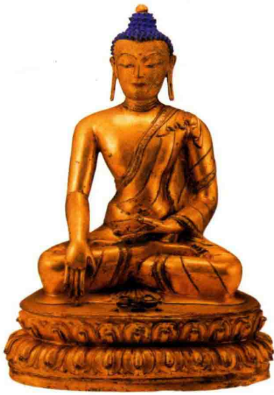
◇铜鎏金药师佛坐像（清代）