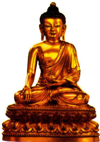
◇铜鎏金药师佛坐像（明永乐）

要护法神。据载，他们各率有七千药叉眷属，于昼夜十二时辰及四季十二个月里护佑受持、信奉药师佛的众生。这十二神将是：毗羯罗、招度罗、真达罗、摩虎罗、波夷罗、因达罗、珊底罗、颊尔罗、安底罗、迷企罗、伐折罗、宫毗罗。这十二神将从最初的毗羯罗，到最后的宫毗罗，其守护众生的时辰，刚好是从子时到亥时的十二支，而且他们的形象也都与民间流传的十二生肖有关。毗羯罗戴鼠冠，直到最后的宫毗罗戴猪冠，其次序与十二生肖完全吻合。药师殿里供奉的十二神将基本如此。