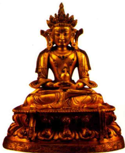
◇铜鎏金无量寿佛坐像（清康熙）

日的意思，其突出特征是两手结智拳印，即右手握左手大拇指，置胸前；在胎藏界，他表示理大日的意思，称大日理法身，其突出特征是两手结法界定印，即仰手掌，右手在上，左手在下，两拇指相触，置于脐下；两种的区别仅在手印上。