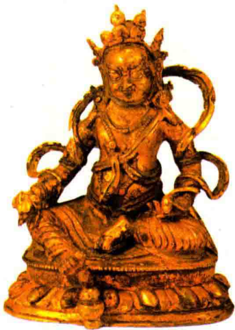
★清代铜鎏金黄财神坐像