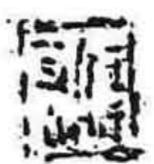
王维众(丹东市委书记)题