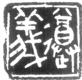
遵义 / 篆刻 戴明贤刻

湄江实在不能叫江，只是一条不太宽的河，环绕在县城周围，河水澄澈，岸旁青翠欲滴。有的地方相距不过几十公尺，力气大点的人，常常可以显个本事，捡块石子掷过河。傍晚的时候，人们总喜欢三三两两出城到湄江边去散步。湄江在城南转一个大弯，朝东流，江的中央有一个小岛，岛上长满了树。由于岛上人迹罕至，那里就成了鸟的天堂，成千成万的鸟在树上结巢。夕阳西下时，波光涟漪，一群一群的鸟飞回来，时而绕个大圈子高翔，时而绕