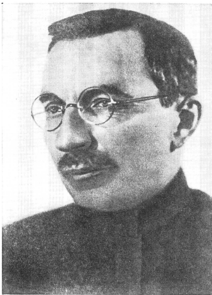
安·谢·马卡连柯,莫斯科,1936年