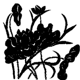
閉 关 录