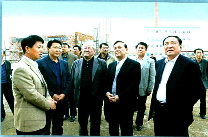
2010年10月17日,自治区人大常委会主任艾力更·依明巴海(右二)一行来和布克赛尔县慈善医院实地调研,塔城地委副书记、行署专员马宁(右一),县委副书记、政府县长才布格加甫(左二)陪同。