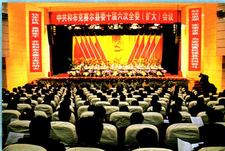
2010年1月21日,县委十届六次扩大会议会场