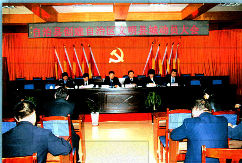
2010年4月9日,自治县召开创建自治区文明县城动员大会