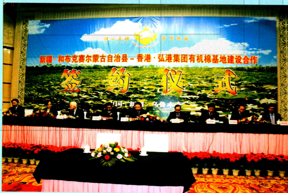
2010年1月18日,和布克赛尔县与香港弘港集团有机棉基地建设合作签约仪式现场