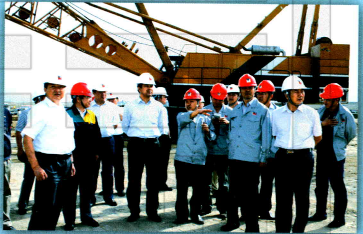
2010年8月26日,塔城地委书记彭家瑞(左四)一行来和布克赛尔县参观和丰鲁能煤矿,县委书记薛俊强(右二),县委副书记、政府县长拉格瓦·才布格加甫(左一)陪同