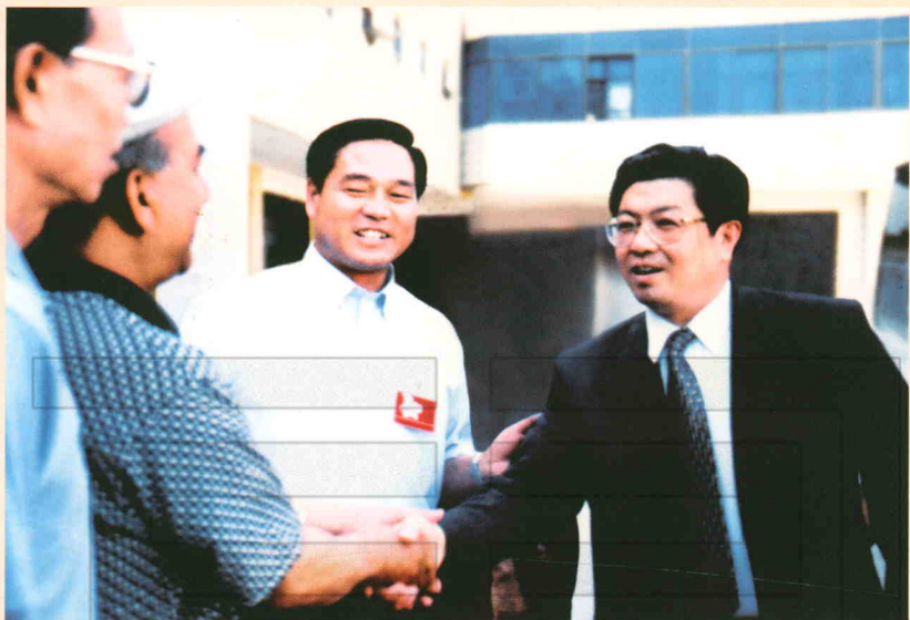
2000年5月28日,全国政协副主席、中共中央统战部部长王兆国(右一)率西部开发赴疆考察团到农二师视察工作。图为王兆国接见宋建业(右二)、阿不来提·牙合甫(左二)、刘彰根(左一)等师领导时的情景。