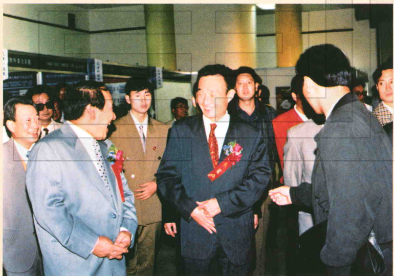
1992年9月1日国家副总理吴邦国(右二)(现人大委员长)在乌鲁木齐视察农二师二十五团在乌洽会上的摊位。