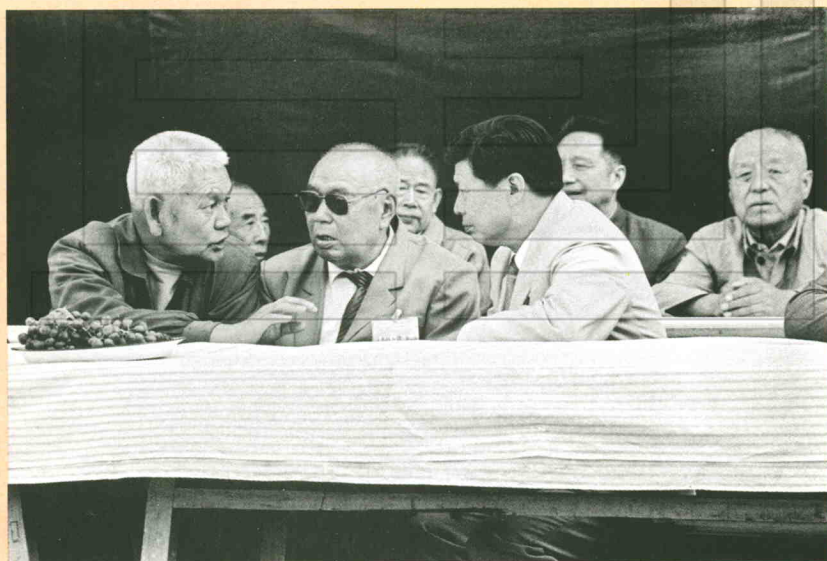
1994年9月6日,原兵团第一副司令员谢高忠(前中)在农二师40年大庆会场上,与原兵团司令员刘双全(左一)、农二师政委王建臻(右一)亲切交谈。