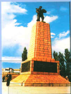
为纪念农二师建师四十周年而落成的