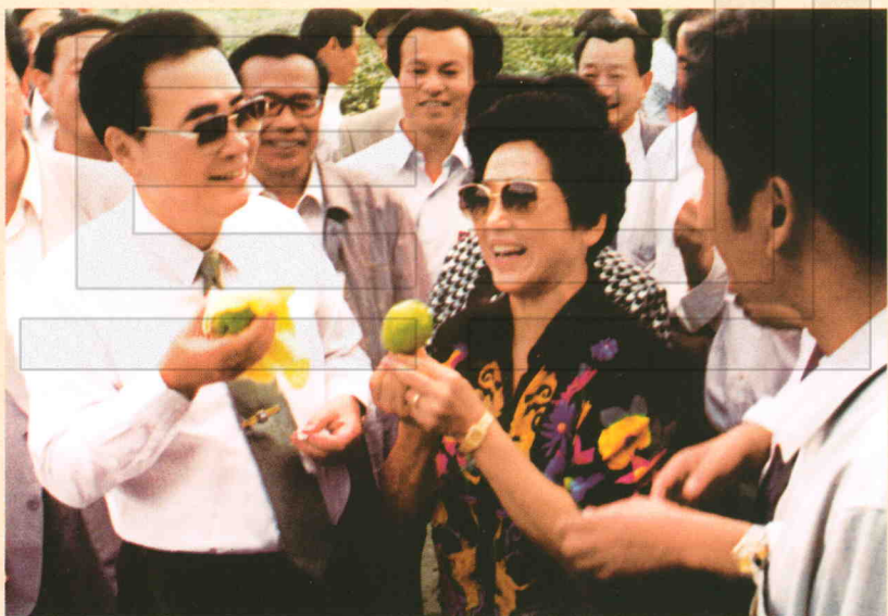
1996年9月6日,国务院总理李鹏(左一)到二十九团视察,图为李鹏欣赏库尔勒香梨并和职工亲切交谈。