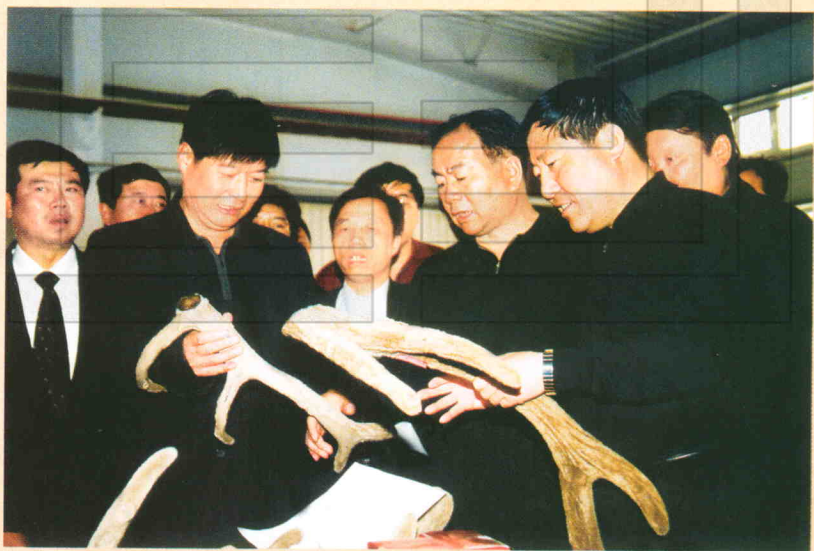
2003年,中共中央政治局委员、自治区党委书记王乐泉(右二)到农二师视察工作,图为王乐泉在观赏鹿茸,左二为师长习新民。