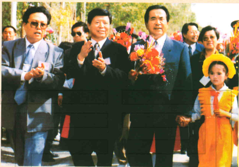
1995年10月3日,人大副委员长铁木尔·达瓦买提(右二)率中央代表团慰问农二师二十九团。左二为农二师政委王建臻。