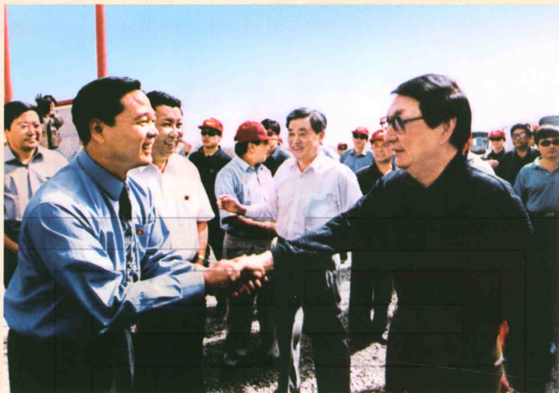
1999年7月,中共中央政治局常委、国务院总理朱镕基(右一)到库尔勒视察,亲切接见农二师师长宋建业(左一)。