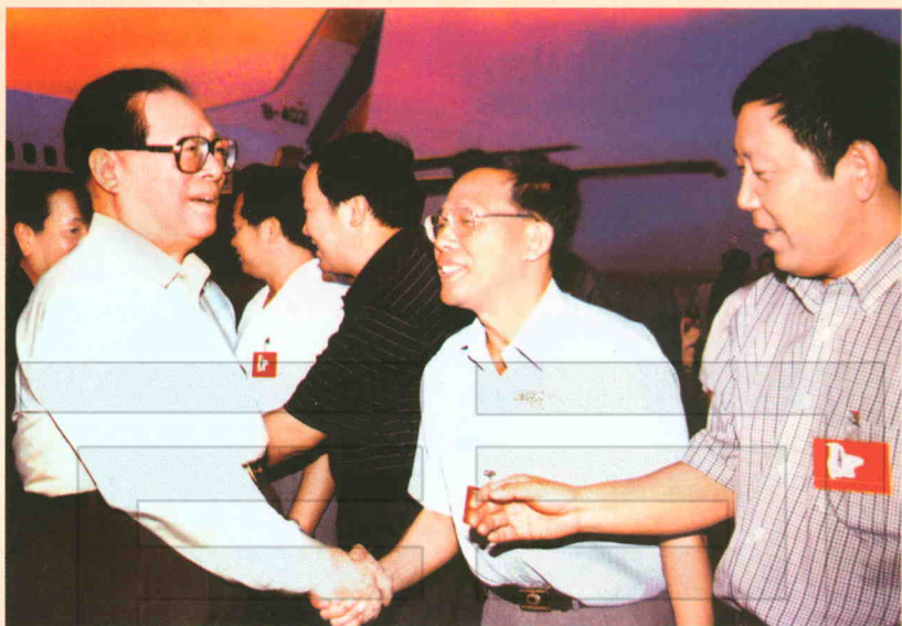
1998年7月6日,中共中央总书记江泽民(左一)到库尔勒视察,在飞机场亲切接见农二师政委葛政法(右二)。