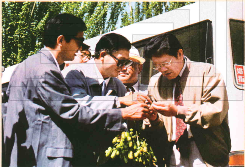
1996年9月18日,国务委员李铁映(右一)到农二师二十五团视察工作,图为李铁映在观看啤酒花时情景。