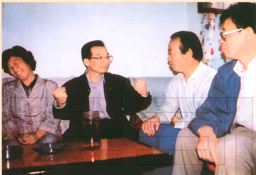
1996年5月19日,中共中央政治局候补委员、中央书记处书记温家宝(左二)(现任中共中央政治局常委、国务院总理)到农二师二十九团视察工作,与职工亲切交谈。