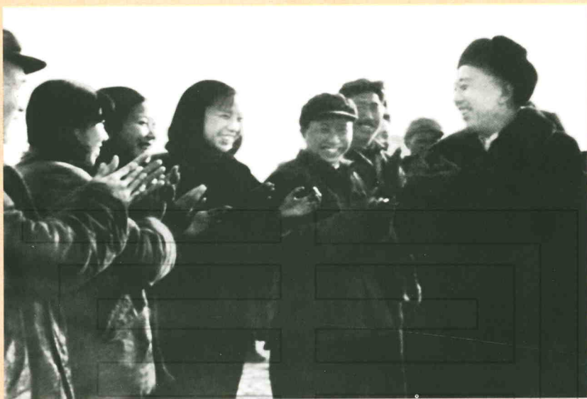
20世纪60年代,王震将军(右一)与农二师职工群众在一起亲切交谈。