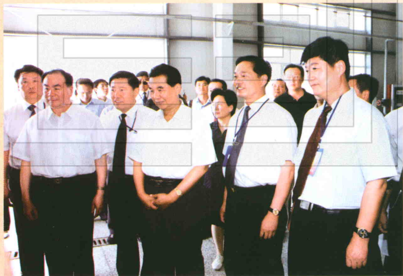
2004年5月,中共中央政治局常委、纪委书记吴官正(右三)在中共中央政治局委员、自治区党委书记王乐泉(左一)陪同下到农二师视察。右一为师长习新民,右二为政委宋建业。