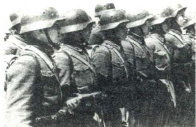
中国士兵整装待发，开赴前线。