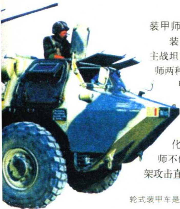
轮式装甲车是装甲师必备的重型装备。

装甲师又称坦克师，隶属于集团军或军，主要由主战坦克和坦克兵编成，分为预备装甲师和队属坦克师两种。装甲师是战斗、战役中的重要突击力量。装甲师最早出现于第二次世界大战前，以坦克为主要突击力量，在战斗、战役中进行突击作战。目前，世界上大多数国家的军队都编有装甲师，而且装甲师的武器装备也在逐渐多样化，整体作战能力逐步增强。例如，美军的装甲师不仅配备百辆主战坦克和步兵战车，还配备数十架攻击直升机和侦察直升机，以及数十门自行火炮。