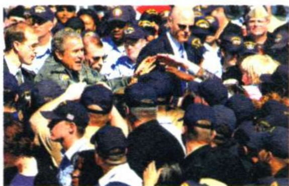
前美国总统布什视察海军。

苏联在卫国战争期间成立国防委员会，作为战时国家最高权力机关，统一领导全国的军事、政治、经济等各