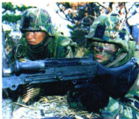
强大的武装力量是国防安全的有力保障

武装力量是国家或政治集团各种武装组织的总称，包括军队、警察、边防部队、后备役部队、民兵等正规和非正规的武装组织。武装力量是国家或政治集团对内对外实施政治政策的暴力工具。