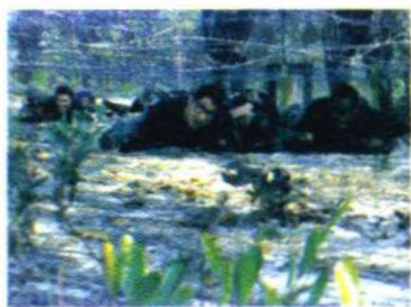
后备军的常规军事训练

常备军是国家或政治集团平时保持的现役正规军队，是武装力量的主体。一般情况下，世界各国的常备军以适量、精干为主，平时主要用于应付突发事件和局部战争、参加国家经济建设、救灾抢险等；战时则作为战争初期的作战主体及军队扩编的基础。