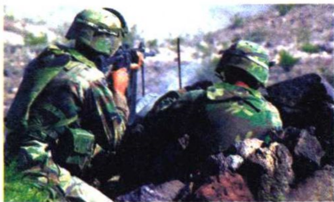
临战的野战集团军

方面军是若干个集团军组成的军队组织，一般隶属于最高统帅部或战区。方面军通常在战时组建，为诸多兵种合成的战略战役兵团，担负着一个或多个方向上的作战任务，并在重点方向上作战时统一指挥，协调作战，共同完成作战任务。