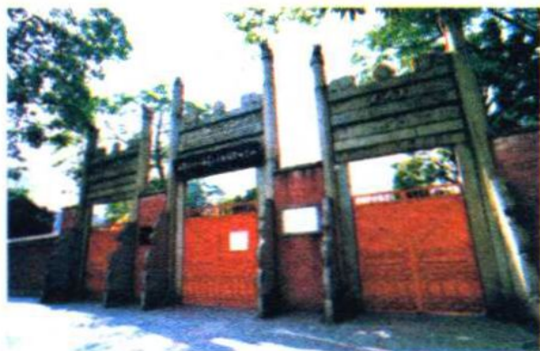
20世纪初中国民兵参加政治学习的讲习所旧址

民兵是指由不脱离生产的人民群众组成的武装组织，是常备军的辅助和后备力量。平时，民兵成员各自从事自己的本业，一旦被编入民兵部队，便要接受军事训练；战时，民兵成员集中起来，就地配合军队作战，开展游击战争，并担负各种战争勤务，维持当地治安。