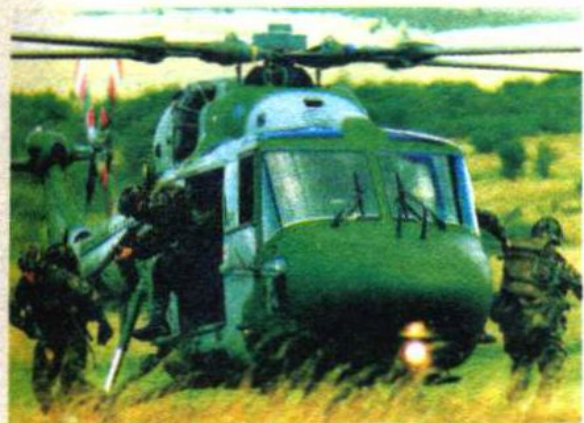
空降师降临，准备配合地面部队作战。