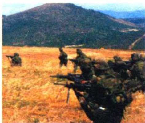
各集团军在统一指挥下协同作战。