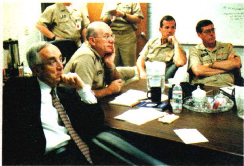
各指挥官察看军事情报，准备共商军情。