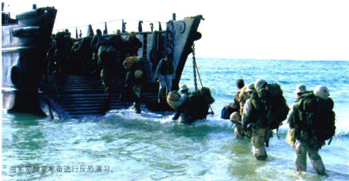
海军常规军准备进行反恐演习。

后备军是指国家在平时组建的以便战时动员扩充武装力量的非正规部队。后备军由服满现役的或经过适当军事训练的人员组成，配有现代化的武器和军事技术装备，并按有关条例进行军事训练。世界上很多国家都有后备军，其编制通常与正规部队一致。