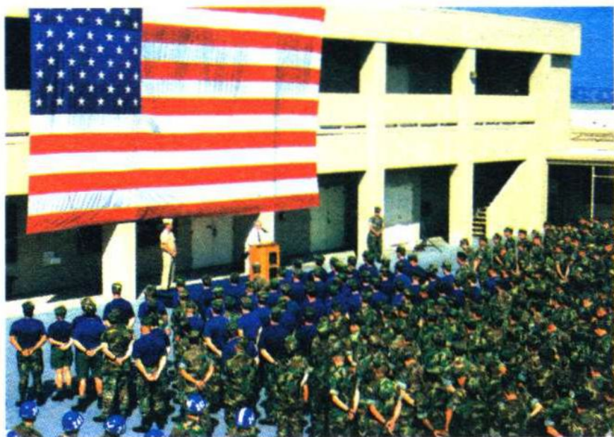
海军陆战旅的集体大会

旅是军队的一级组织，通常隶属于师或集团军，下辖若干个营（或团）。旅属于战术兵团，按其编成、装备及任务，可分为步兵旅、坦克旅、炮兵旅、战术火箭旅、空降旅、海军陆战旅等。在西方国家，旅首次出现于16世纪下半叶的西班牙，后来，世界上许多国家军队相继采用了旅的建制。