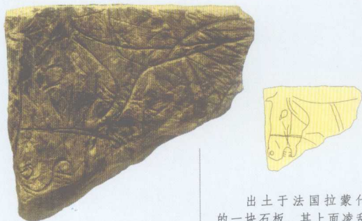
出土于法国拉蒙什的一块石板。其上面凌乱的线条，雕刻出一个隐约有可辨的马头。它是公元前12000年人类祖先驯养野马的见证。

在新石器时代，人们过着原始的部落生活，即使到了铁器和铜器时代也未改变这种生活状态。尽管如此，在英格兰南方建于约公元前20世纪~公元前18世纪的圆形石林，也称“巨石阵”，是具有重要意义的原始时代的纪念性环境雕刻。这一石林分三期建成，石块是从36公里远的沙丘运来，共80块砂岩，每块长达9.14米，重50吨，石块间距离相等，石块之间上架石条，中央摆着一块类似祭坛般的石头，整个朝着一个方向，就是夏至太阳升起的地点。这组石林在宗教和建造方面颇具神秘性，留下了许多