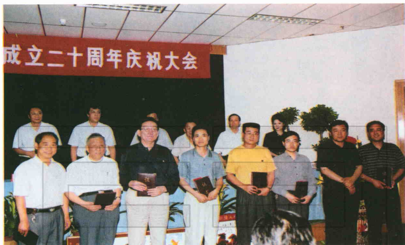
国土资源厅领导为土地学会成立二十周年举办的《论文征集》活动，给获得优秀论文作者颁奖