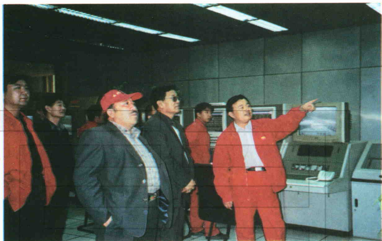
土地学会组织专家、教授在塔里木油田调研