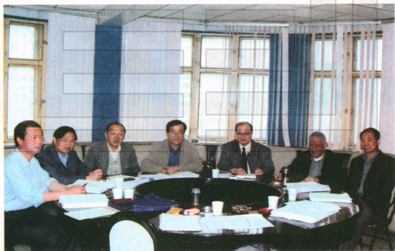
土地学会聘请专家、教授为土地学会成立二十周年《论文征集》活动稿件认真评议