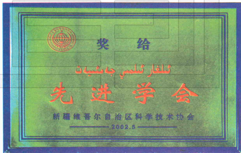
土地学会获新疆科学技术协会颁发的《先进学会》奖