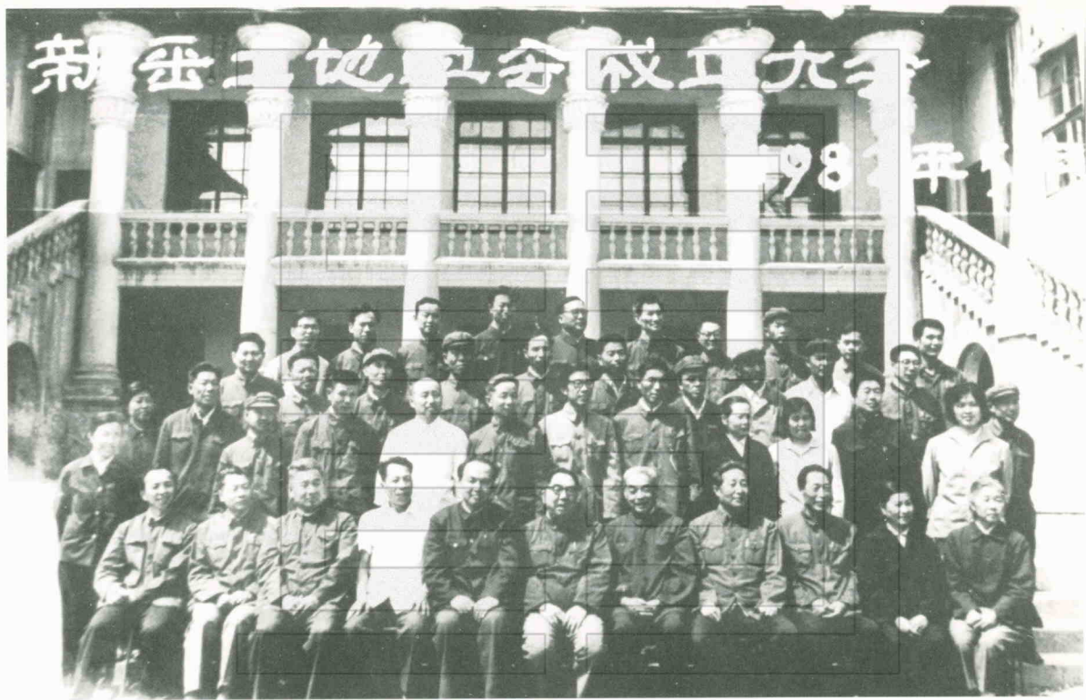
1982年5月新疆土地学会成立时代代表合影