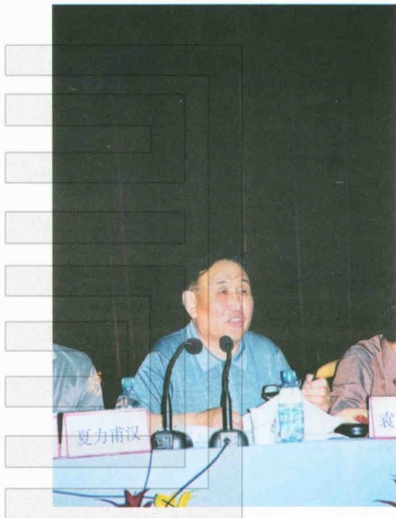
国土资源厅厅长夏力甫汉在庆祝土地学会成立二十周年大会上讲话