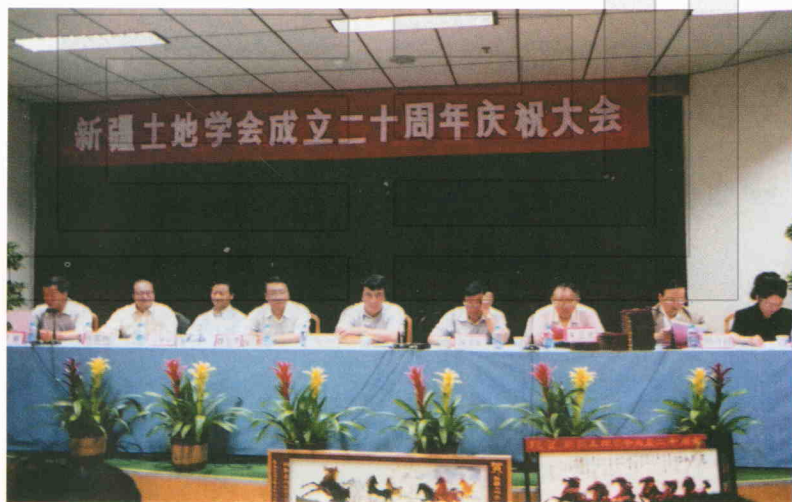
庆祝土地学会成立二十周年大会会场