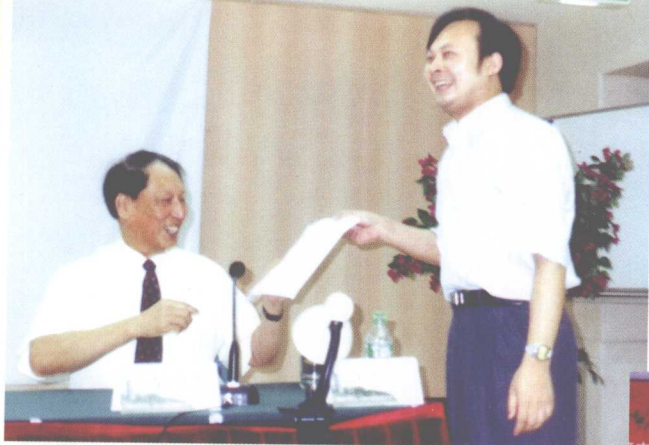
<<< 李伯淳教授赠送《中华商道》第一稿给全国人大常委会副委员长成思危。