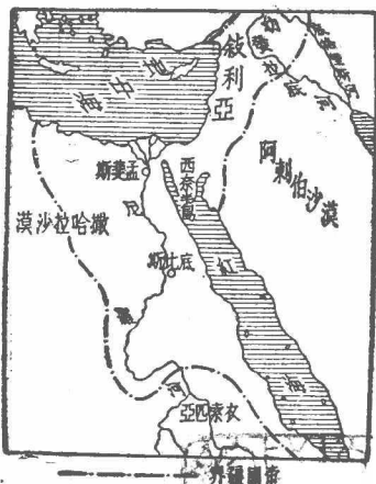
第六圖 埃及及帝國時代的疆域

帝國時代 埃及人從外來的侵略者學會了騎兵戰術，在西元前一五八〇年始將西克索人趕出去。埃及人更以武力對外擴張，向南進攻努比亞 (Nubia)，東北發展到幼發拉底河 (Euphrates) 上游，並在地中海上征服克里特島 (Crete)；這就是帝國時代 (the age of empire, 西元前一五