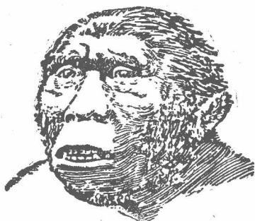
第一圖 爪哇人面貌想像圖