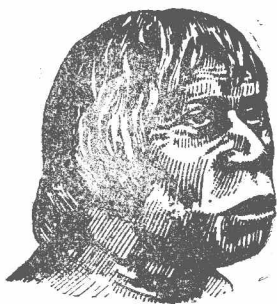
圖三第 克人面貌想像像