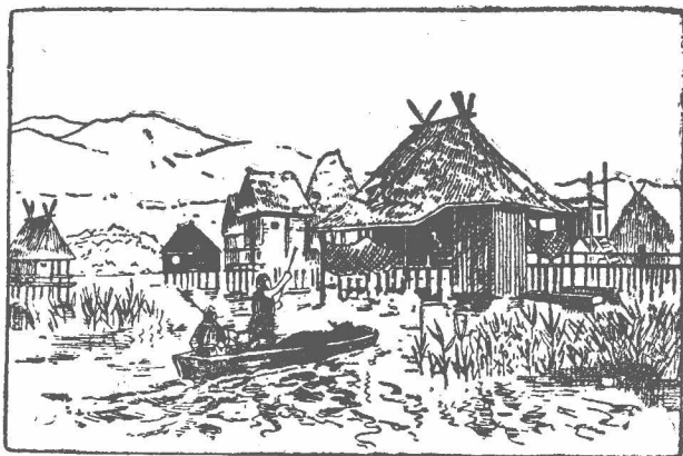
第五圖 史前時代瑞士湖村想像圖

新石器時代的人，又從野生植物裏，選擇可供食用的五穀、水果、蔬菜等加以種植，這就是農業的