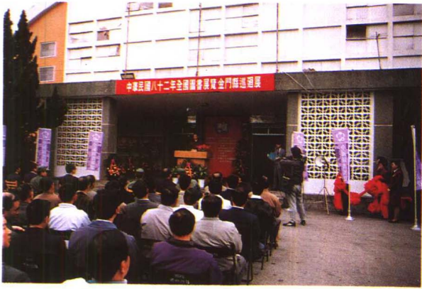
↑ 全國書展首度到金門巡迴展覽。