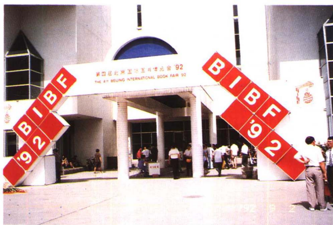
↑ 由臺北市出版商業同業公會組成之「臺北出版人訪問團」前往北京參加「第四屆北京國際圖書博覽會」。