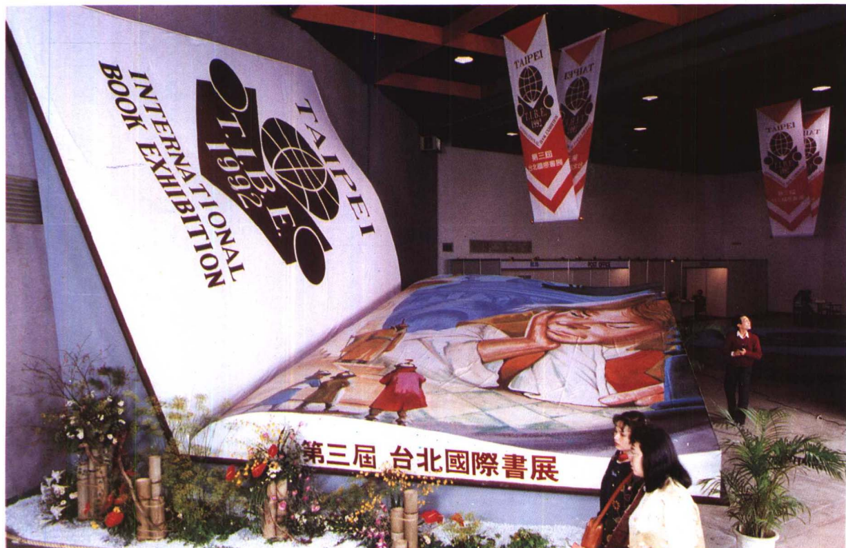
↑ 第三屆臺北國際書展精美的佈置。