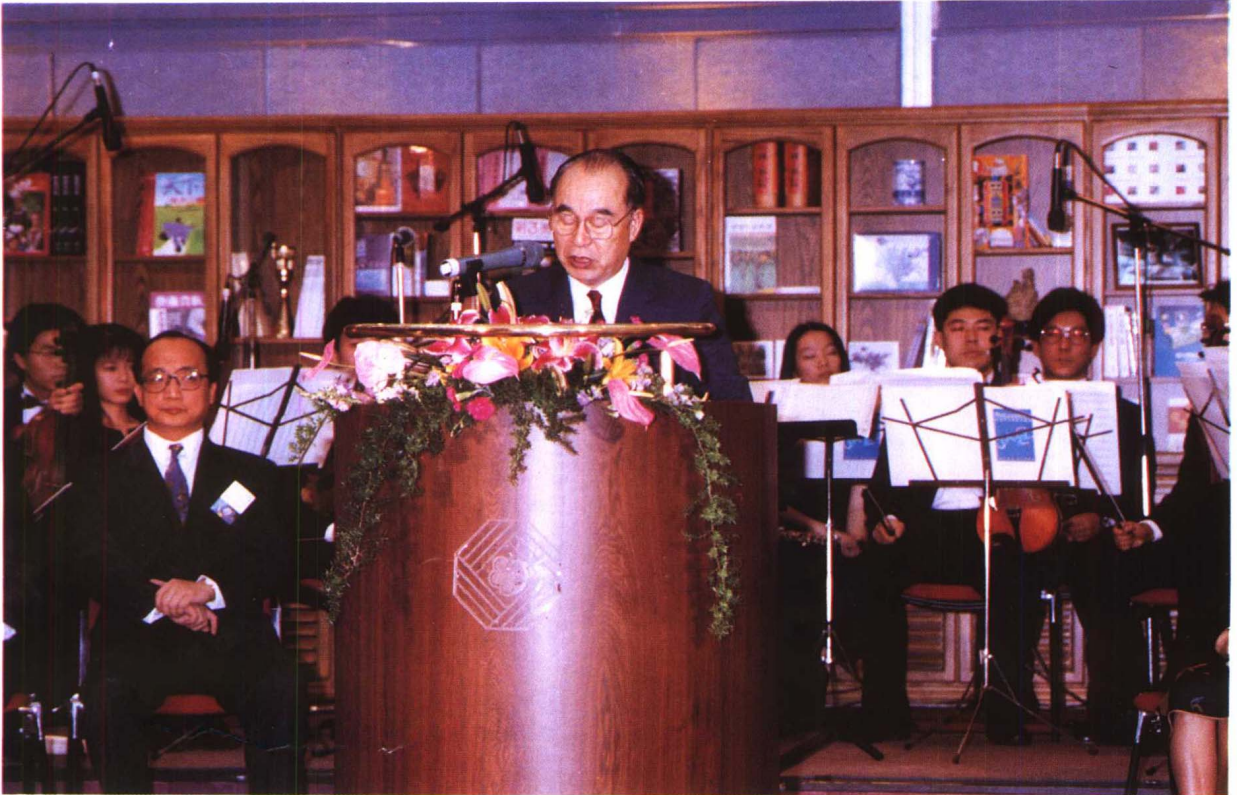
↑ 八十一年度金鼎獎頒獎典禮，李副總統元簇先生蒞場致詞。