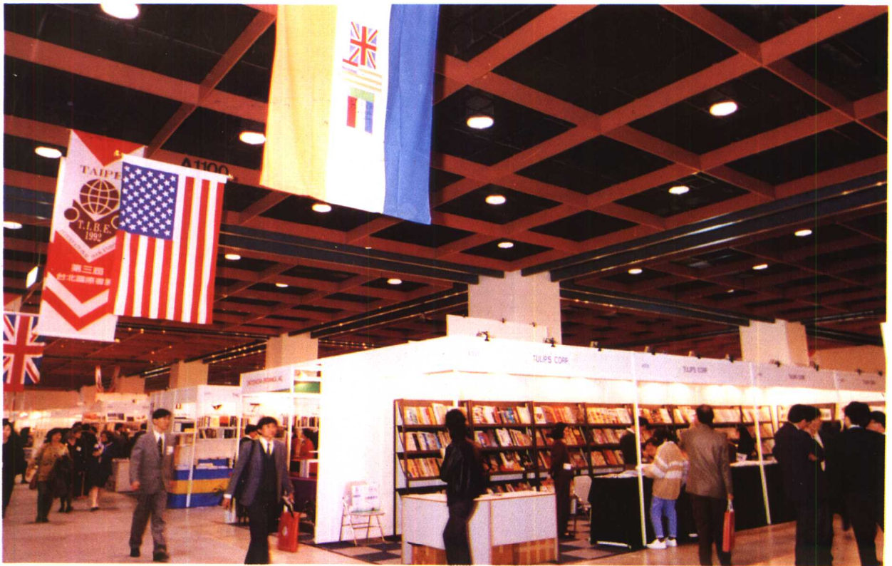
↓ 第三屆臺北國際書展展覽現場。