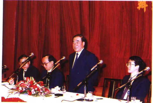
↓ 行政院新聞局於八十一年十二月三日在台北市福華飯店舉行出版事業座談會，行政院郝院長柏村先生蒞臨致詞。