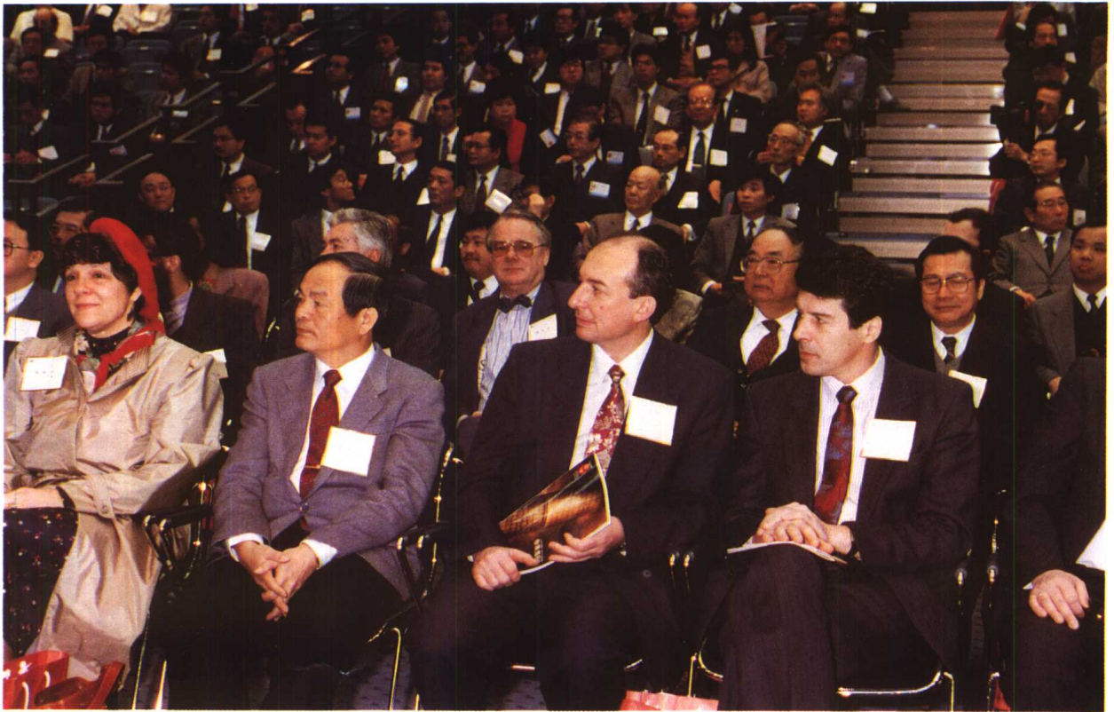
↑ 第三屆臺北國際書展於八十一年一月十七日在臺北世界貿易中心舉行開幕典禮。