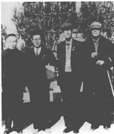
1964年，潘梓年（左一）、金岳霖（右一）与日本学者合影