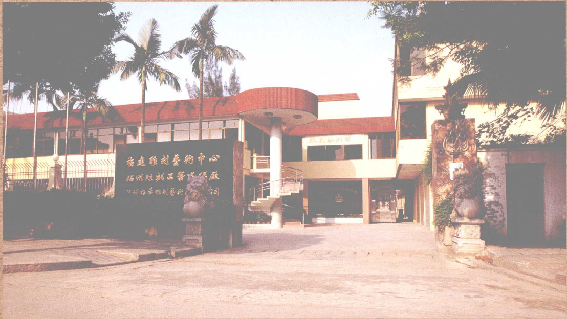
福州雕刻工藝品總廠，是我國工藝美術的重點企業之一，省、市對外文化藝術交流的主要窗口。