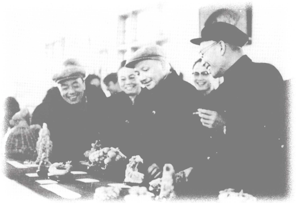
1961年，鄧小平同志在原福州工藝石雕廠觀賞壽山石雕