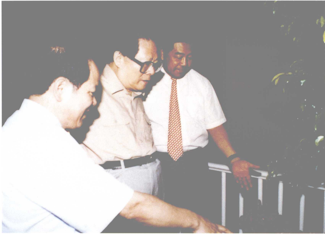
1994年6月，國家主席江澤民視察福州時，觀賞福州雕刻總廠的雕刻藝術品