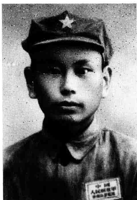
1949年5月，作者 解放温州留影。