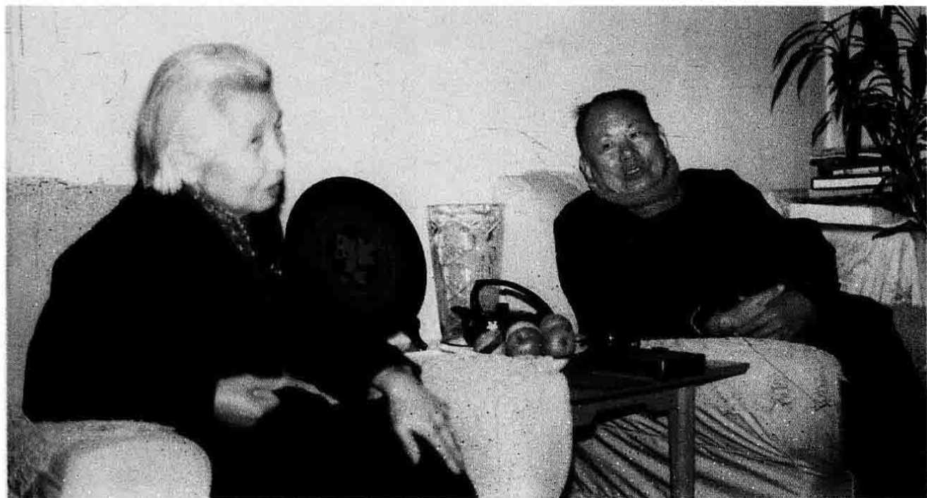
1990年12月，作者到北京看望中央组织部原副部长曾志同志。