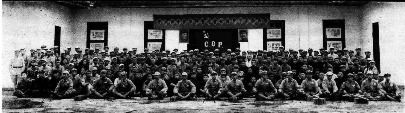
1949年10月，作者参与组织南下干部与当地干部和部队大会师，图为会师合影。