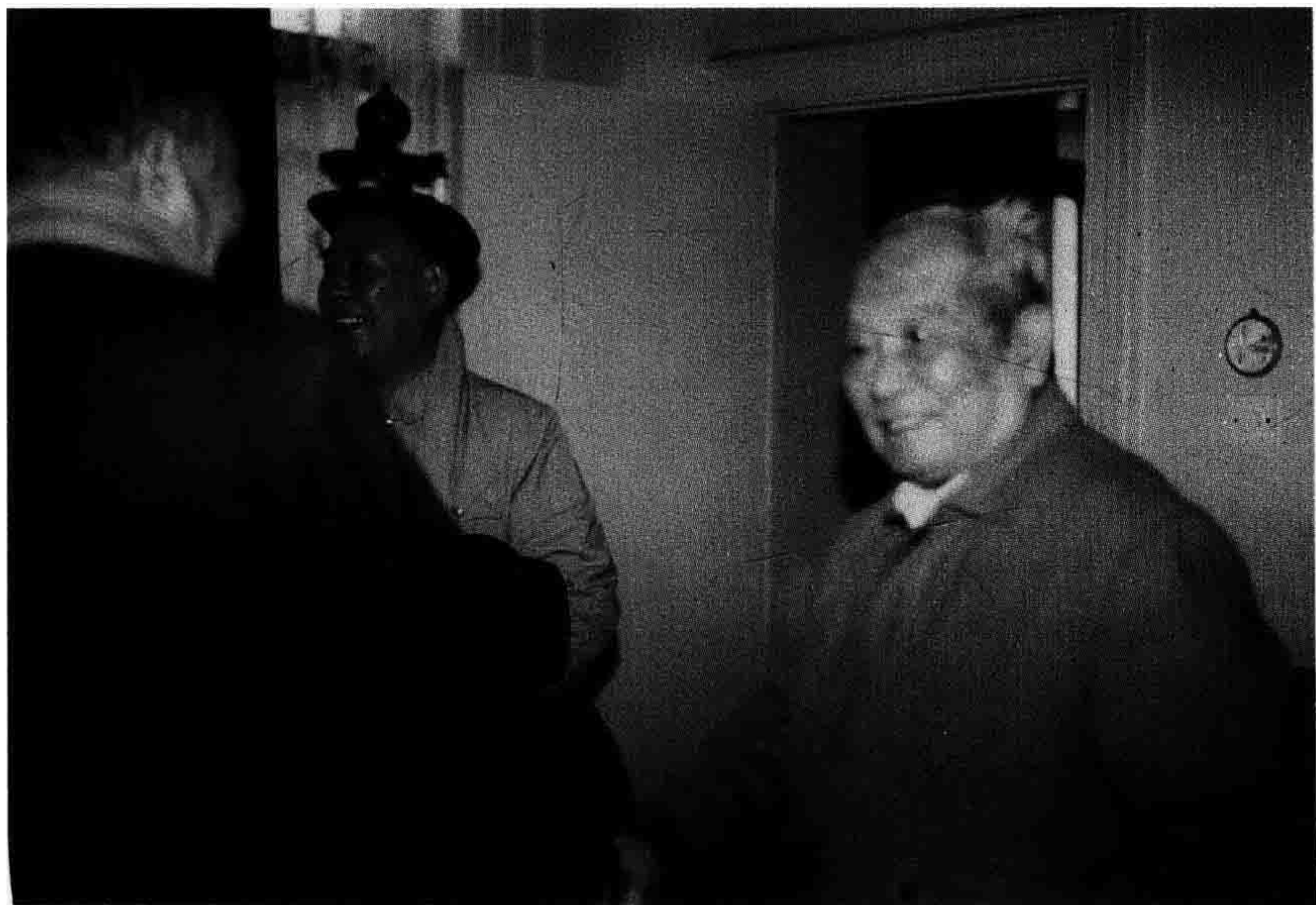
1990年12月，作者与省军区副政委钟大湖到北京看望全国人大常委会副委员长叶飞（前排右一），并请示福鼎党史问题。