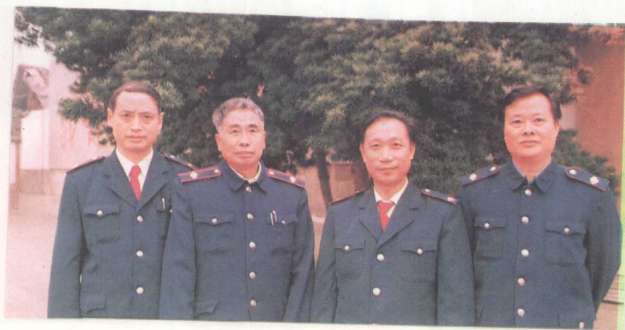
一九八九年遵义地区税务局领导合影