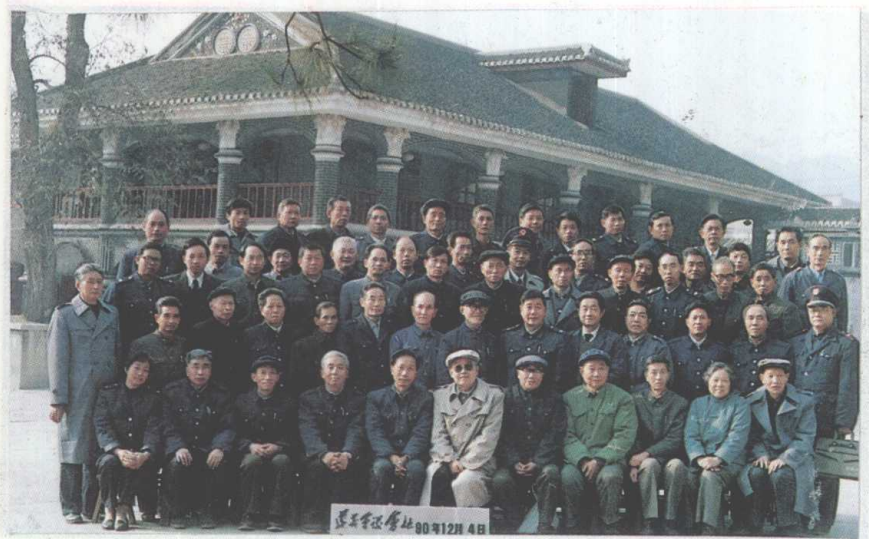
参加《遵义地区税务志》审稿会议全体代表合影