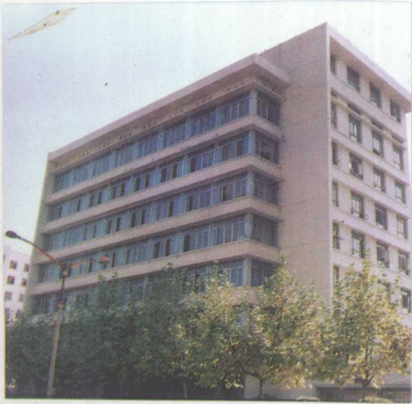
遵义市税务局办公大楼