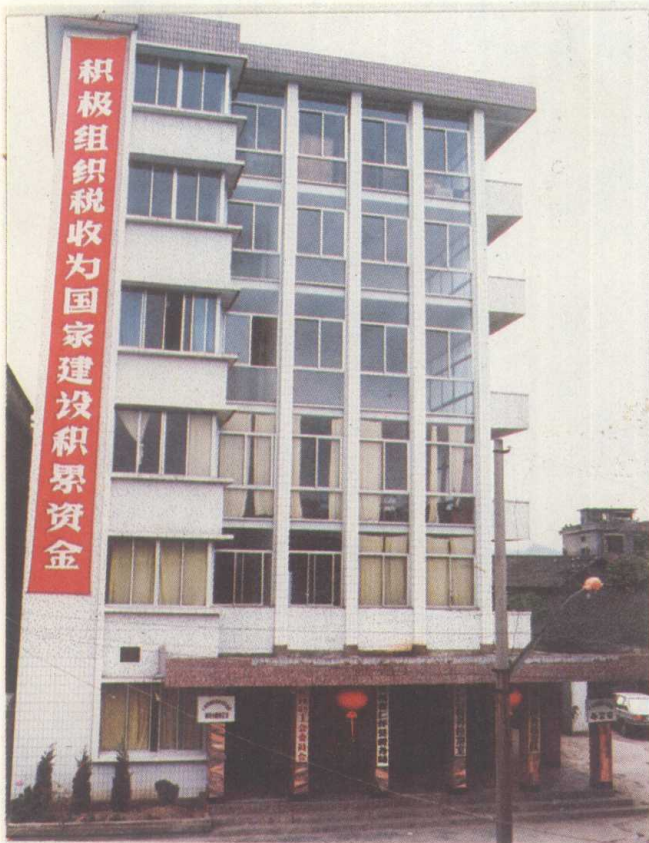
仁怀县税务局办公大楼