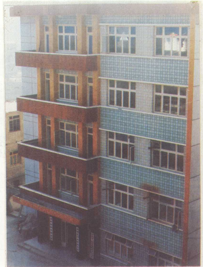
习水县税务局办公大楼