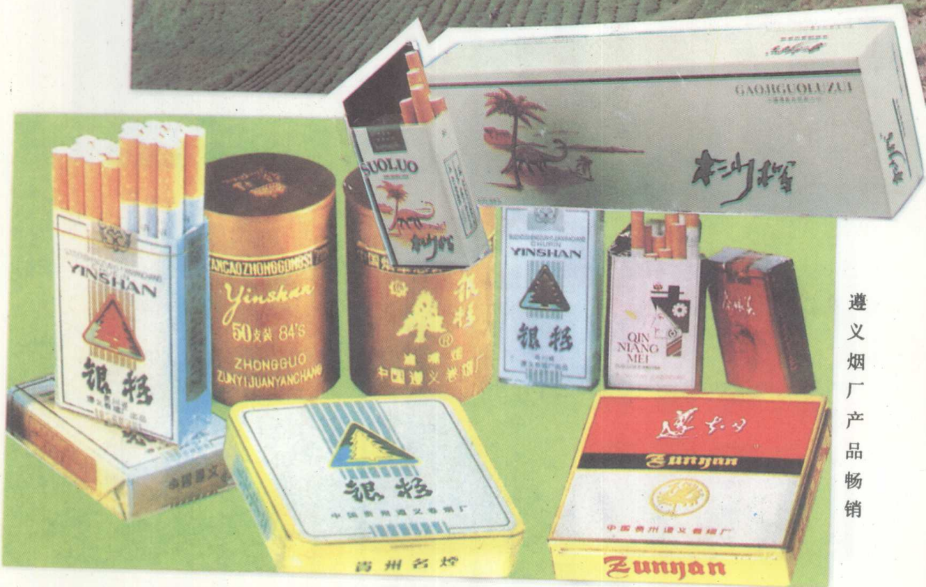
遵义烟厂产品畅销