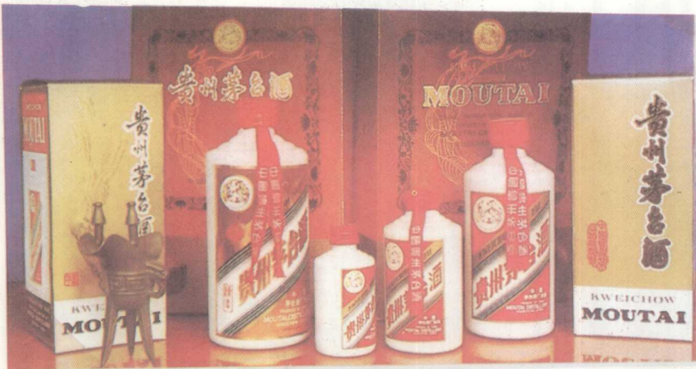
世界名酒 国家之光