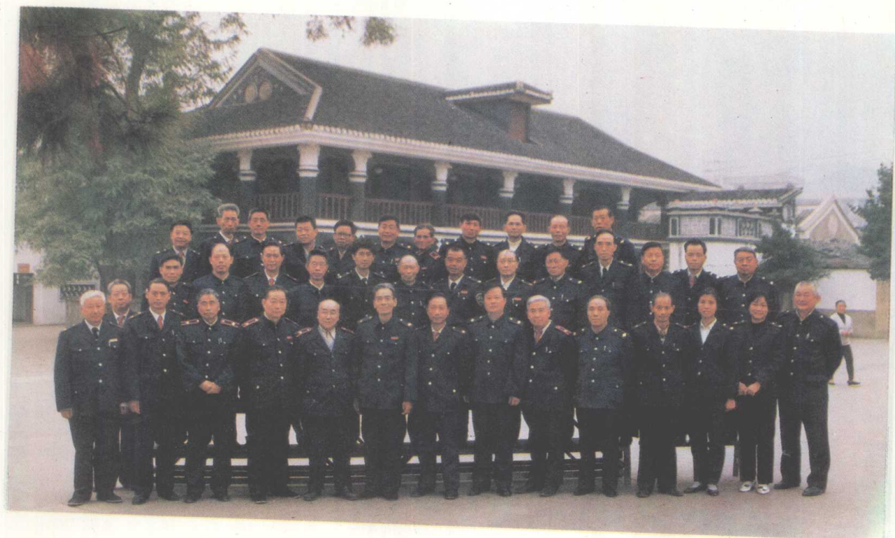
地区税务局正副局长、正副科长，各县、市税务局长合影