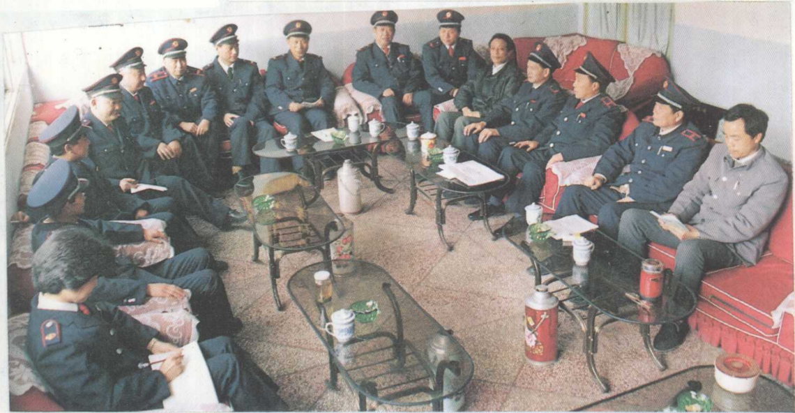
税务学会常委会议