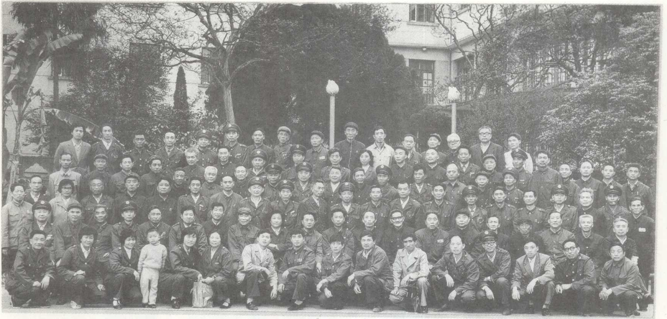
1985年遵义地区税务学会首届会议全体代表合影