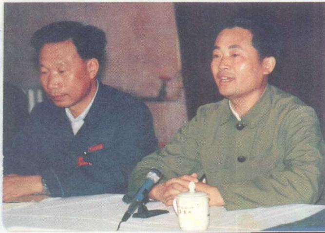
贵州省税务局孙德生局长 在遵义地区税务学会成立大 会上发言