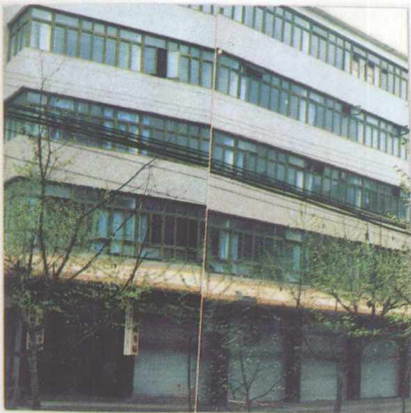
务川自治县税务局办公大楼