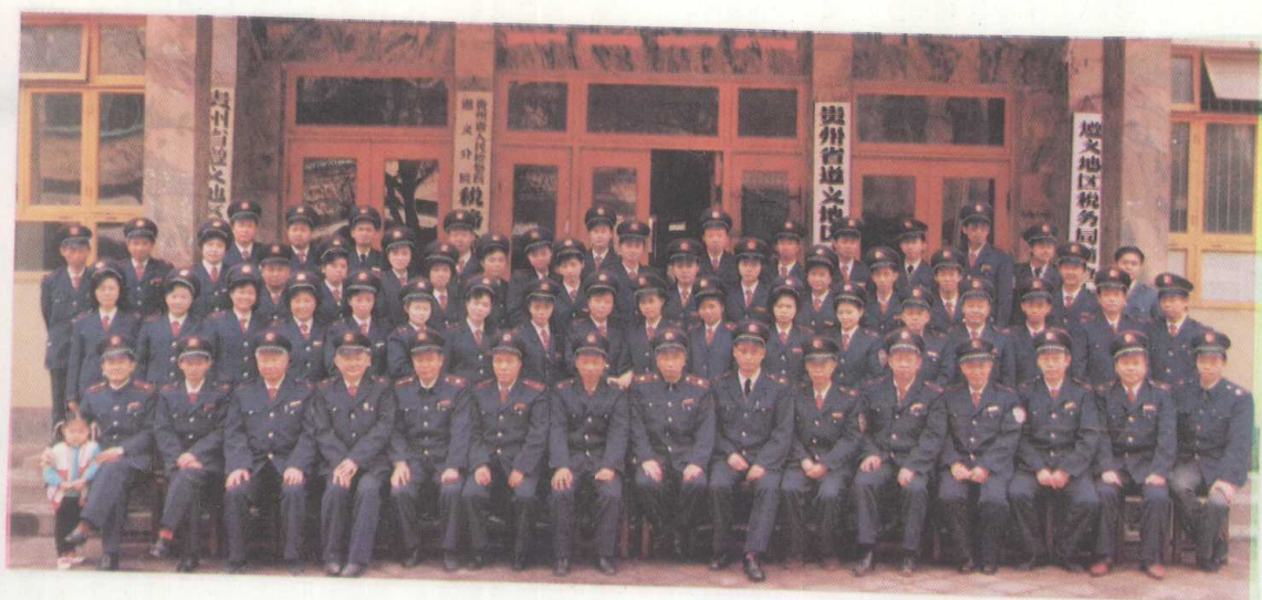
遵义地区税务局全体同志合影