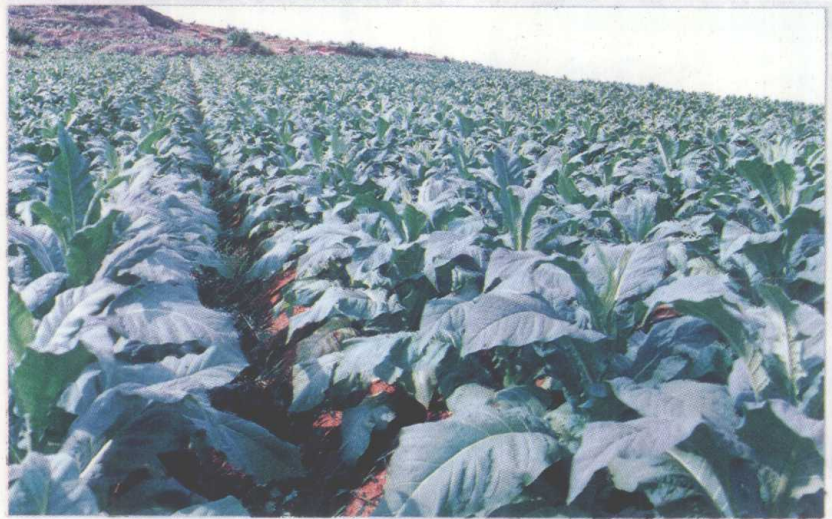
遵义地区烤烟生产基地