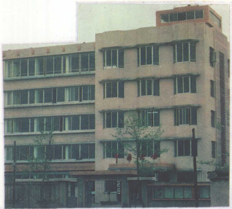
桐梓县税务局办公楼