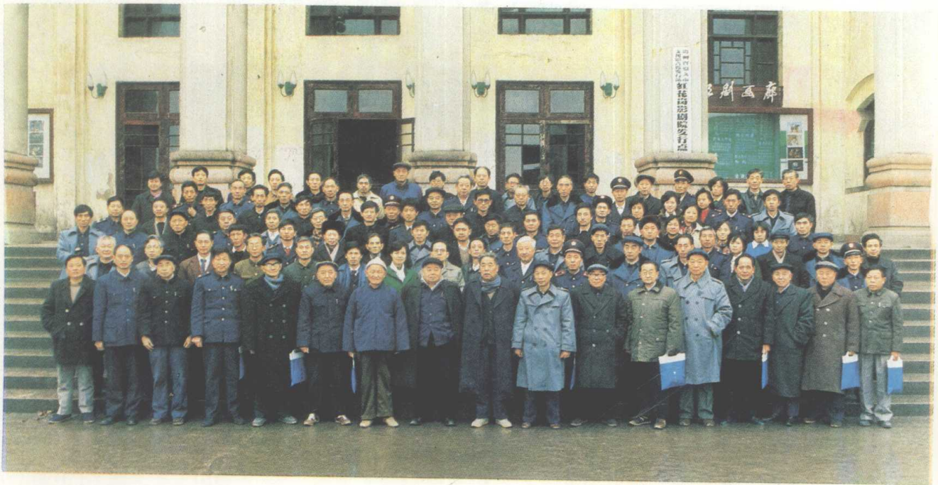
遵义地区税务学会第二届会员代表会议全体代表合影