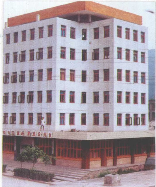
道真自治县税务局办公大楼