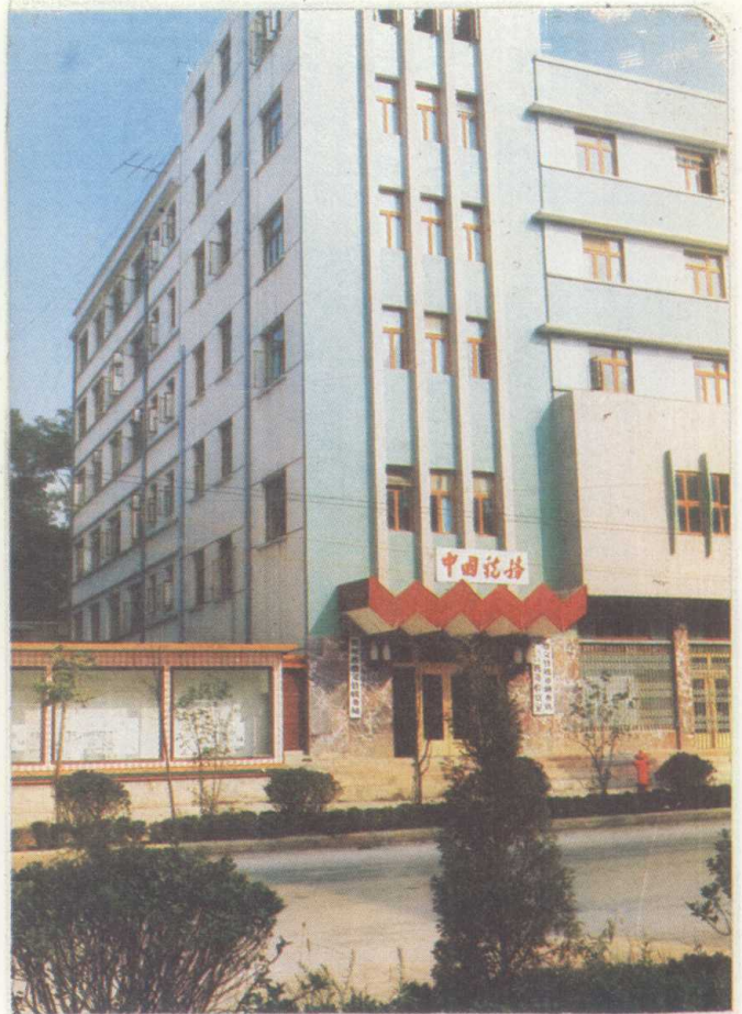
遵义县税务局办公大楼