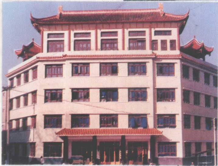
赤水市税务局办公楼