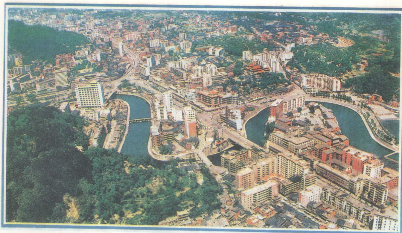
历史名城—遵义全景