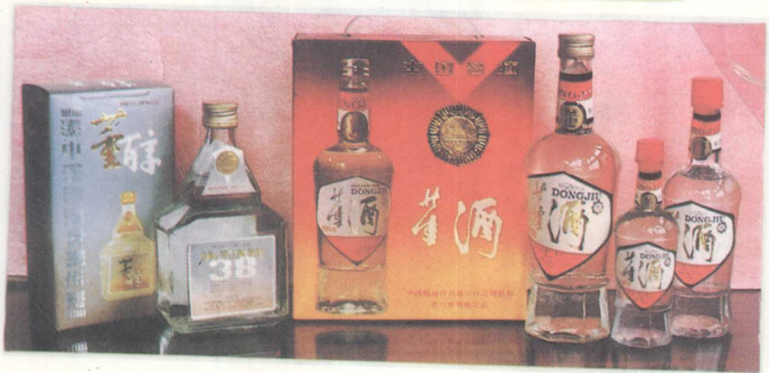
国家名酒黔北之光