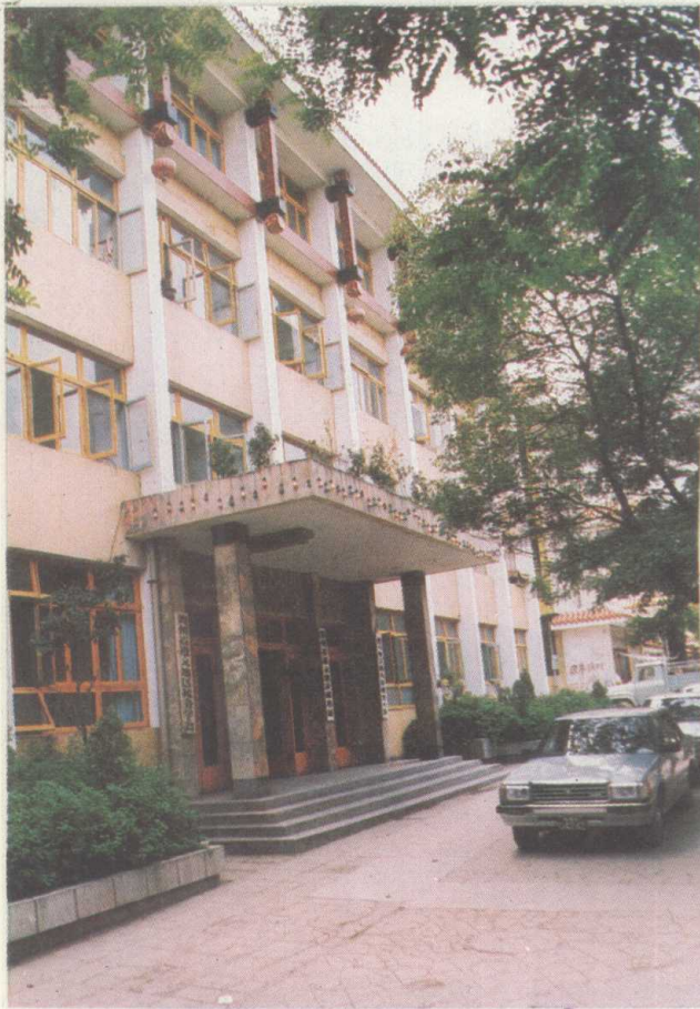
遵义地区税务局办公大楼