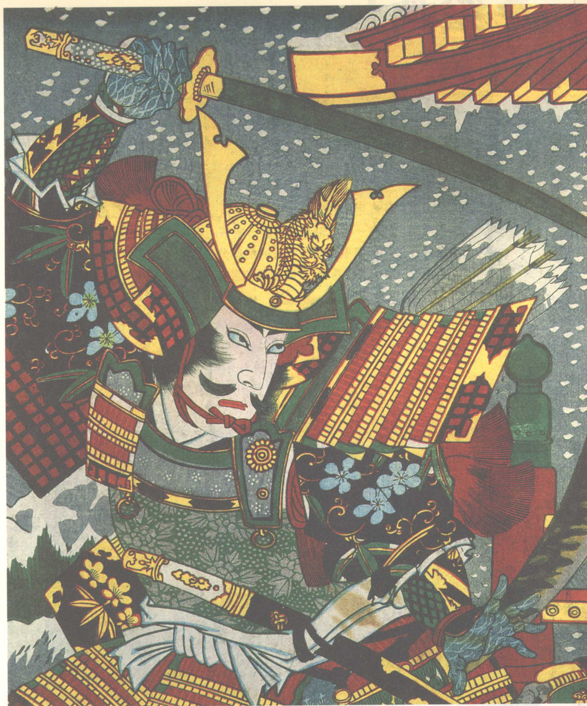
◆ 这幅 19 世纪的版画展示了一位身着盔甲的武士正挥舞着手中的刀。