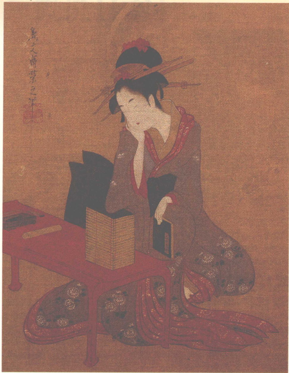
◆身着美丽丝绸和服的妇人。作者：鸟文斋荣之（1756年~1829年）。