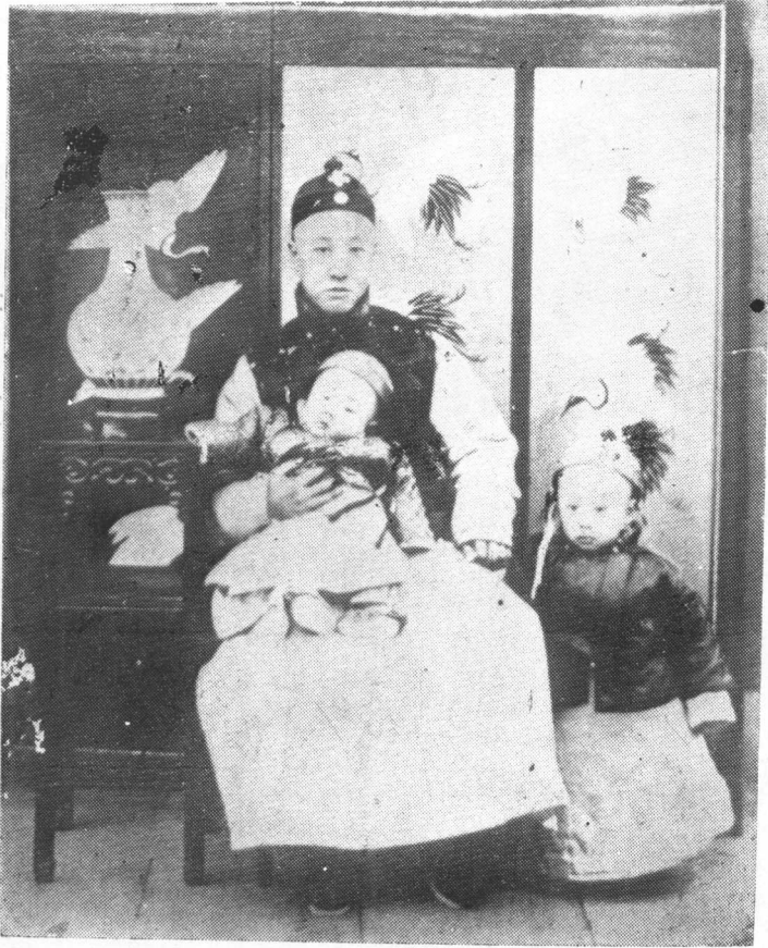
清宣統帝溥儀及攝政王載灃