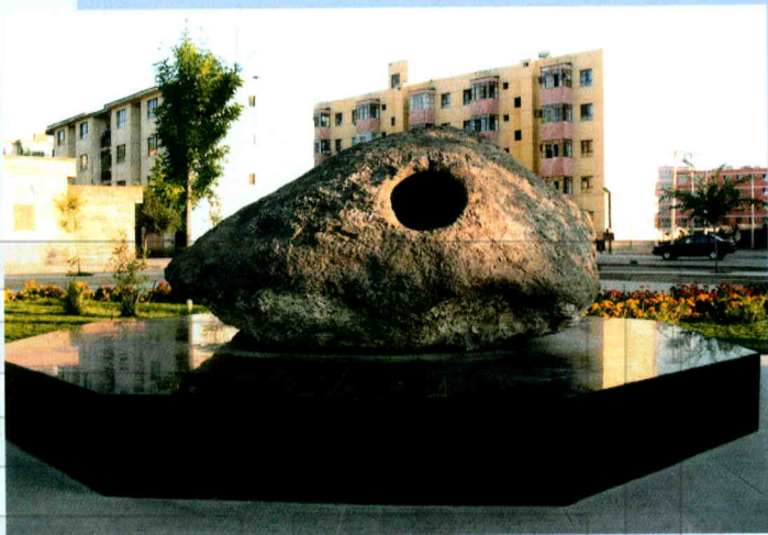
七窍灵石:2005年采自天山北坡白杨河畔。大自然的造化,人与自然和谐相处的见证。