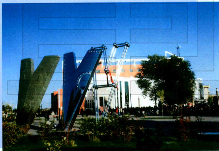
犁铧组:犁铧尖地名的由来,由青铜、不锈钢等材料制成,寓古城之过去、现在和未来。