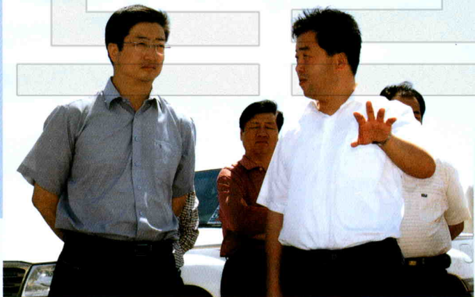
2007年5月25日，州党委书记李学军在奇台县检查工作