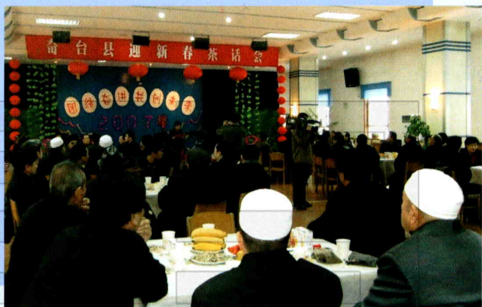
奇台县政协 2007 年元旦迎春茶话会