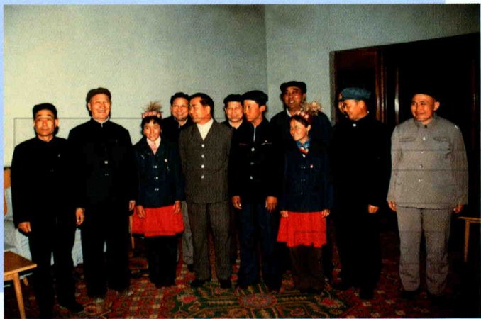
1984年2月20日，自治区人民政府主席铁木尔·达瓦买提接见抗灾保畜小英雄，见本书《抗灾保畜小英雄》一文