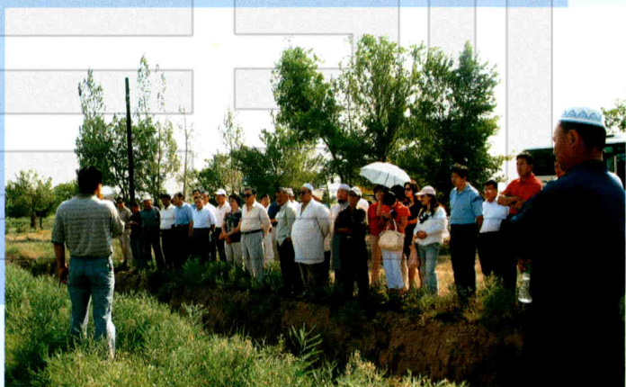
奇台县政协委员视察农村经济建设情况