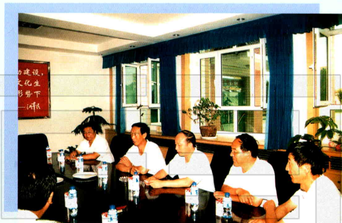
奇台县建设局领导班子