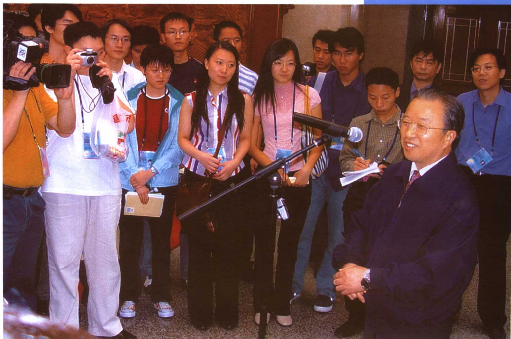
2003年9月6日，中国外交部举行首次“公众开放日”活动。图为外交部副部长戴秉国在外交部橄榄厅热情致辞，欢迎社会各界代表。