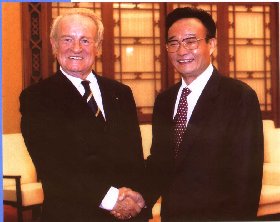
2003年9月12日，全国人大常委会委员长吴邦国在北京人民大会堂会见德国总统约翰内斯·劳。