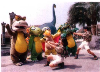
在南太平洋區的街頭，每天有恐龍寶寶的表演，很有趣喔！

術噴泉廣場前小憩，欣賞隨著悠揚古典樂聲翻飛躍動的水舞，其入夜後更有五彩繽紛、變化萬千的燈光助興，更添華麗浪漫氣息！ 走進六福村主題遊樂園，處處充滿驚奇與歡樂，等待您去發掘。