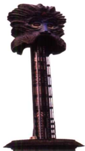
斥資兩億元的大怒神，高達53公尺。

大的特色在於各主題區風格的真實呈現；舉凡建築建材、招牌燈飾、服務人員的服裝、表演活動、紀念商品等，無一不與主題相呼應。因此，您可以欣賞到一八八一年美國大西部粗獷豪邁的小鎮風光與