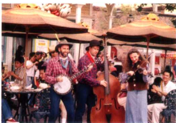
來自美國南方的傳統的鄉村民謠音樂表演。