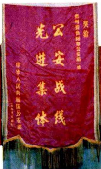
1980年一处荣获中公安部奖旗