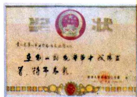
1989年治安巡警大队荣获中公安部奖状