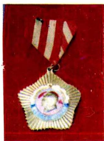
一九五五年全 国青年社会主义建 设积极分子奖章