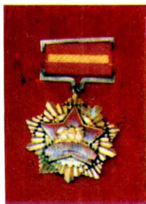
1955年全省青 年社会主义建设积 极分子奖章