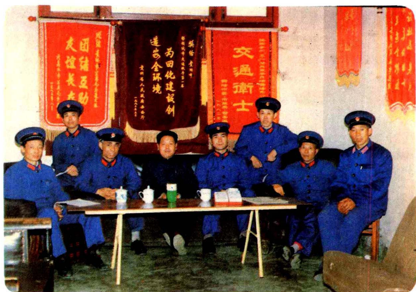
一九八三年市交通大队被省府评为“交通管理”第一名合影照片