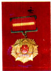
一九五九年全 国政法先进分子奖 章