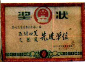
1983年一处荣获中公安部奖状