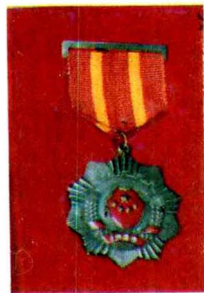
1959年贵阳市 先进分子奖章