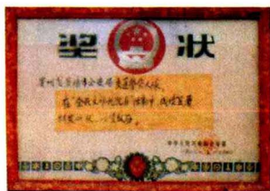
1982年交通大队荣获中公安部奖状