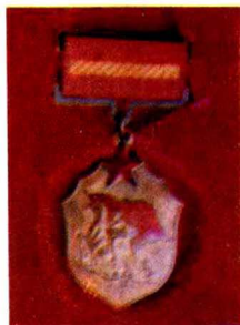
1958年全省政 法先进分子奖章