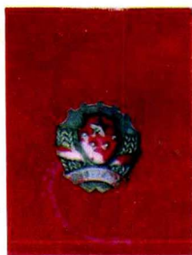
一九五六年全 国民警治保先进分 子奖章